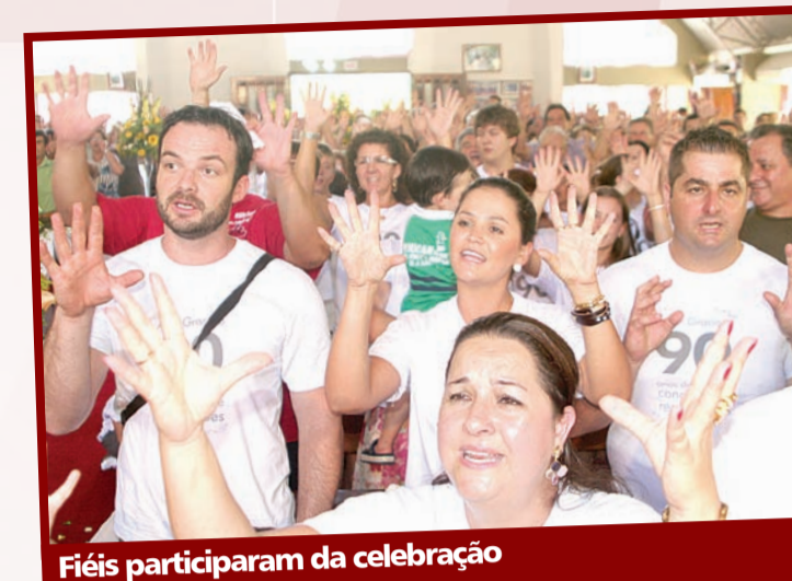
Fiéis participaram da celebração