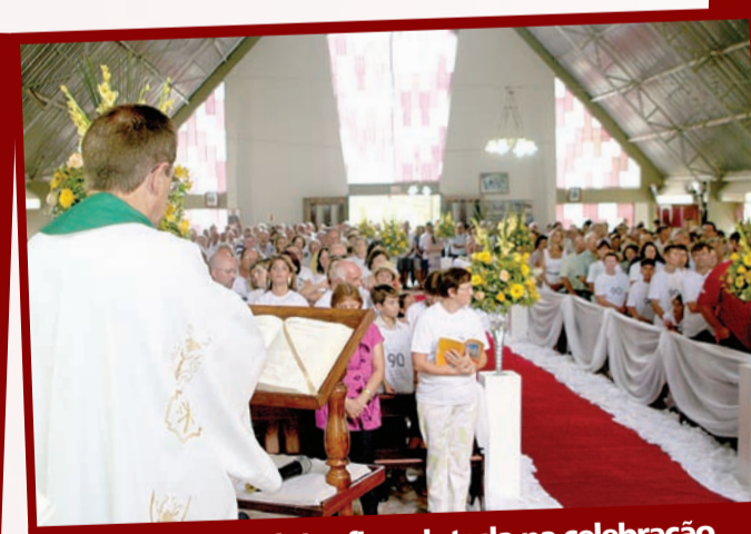
Igreja do Gasparinho ficou lotada na celebração