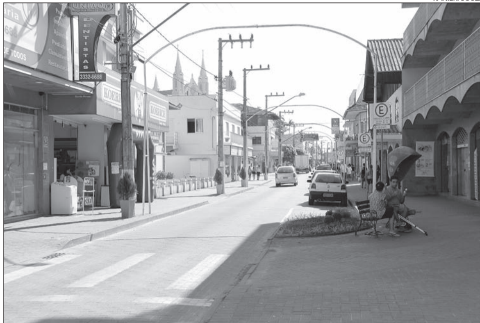
A eleição acontece na sede da CDL, que fica na rua Coronel Aristiliano Ramos

Para o atual presidente da CDL, o período em que a nova diretoria esteve no comando foi satisfatório e gratificante. "Sou a favor de mudanças sempre, por isso acho melhor que um novo presidente se candidate, já que o segundo mandato seguido