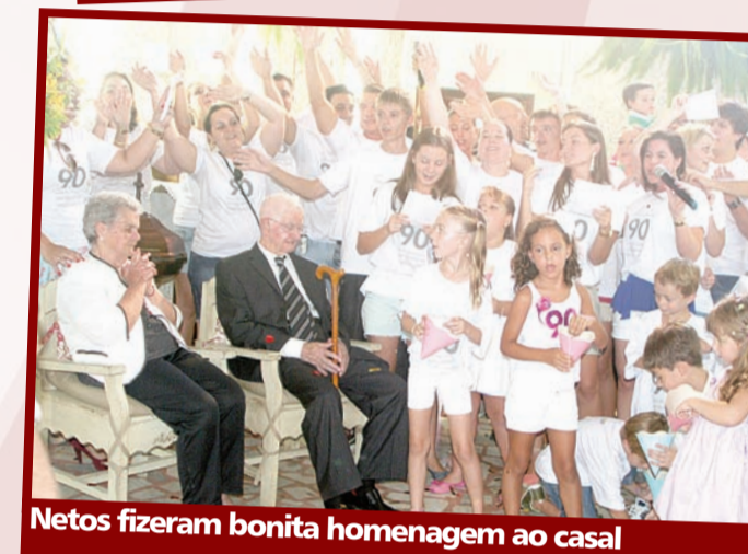
Netos fizeram bonita homenagem ao casal