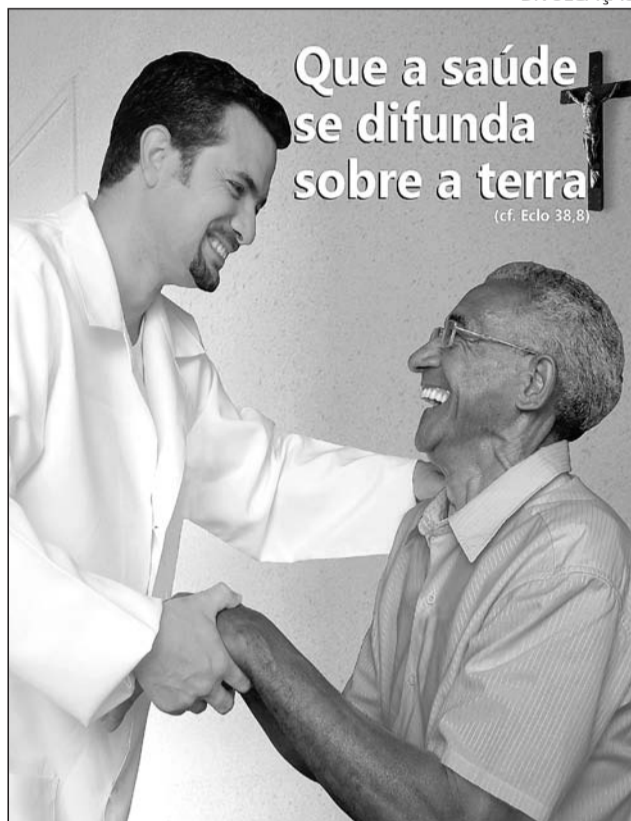
CARTAZ da campanha estará nas igrejas da cidade