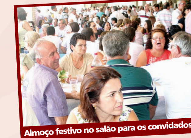
Almoço festivo no salão para os convidados