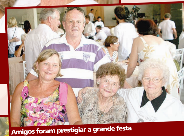
Amigos foram prestigiar a grande festa