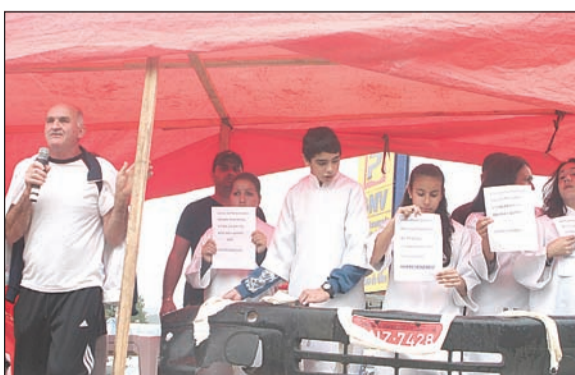
LÍDERES comunitários apareceram para dar apoio