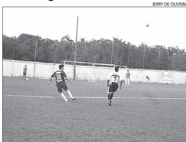
APENAS uma partida aconteceu no campo do Sete de Setembro

Mas a quarta rodada teve também bons jogos. No grupo A, a Estamparia Bimo manteve os 100% de aproveitamento, a única na competição, e goleou o Fofix pelo placar de 3x0. Pelo grupo D, o confronto dos invictos ficou no 2x2 entre Amigos da Bola e GM Madeiras. Outro jogo que chamou a atenção aconteceu no grupo F onde o vice-campeão do ano passado, Maqtim, venceu o bom time do Martins Cabelereiros por 4x3. Confira todos os resultados deste final de semana: