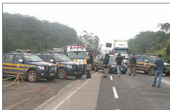
POLÍCIA Rodoviária Federal apareceu com um batalhão