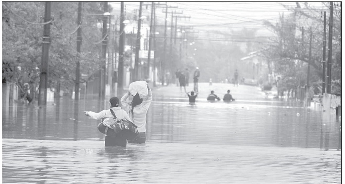
ÁGUA e lama de enchentes podem ser contaminadas com a bactéria Leptospira, causadora da doença presente na urina do rato

A água, acompanhada por lixo e esgoto, tomou conta das ruas há duas semanas e fez de Gaspar um cenário perfeito para a disseminação de uma doença: a leptospirose. As pessoas passavam entre a água, que poderia estar contaminada pela bactéria Leptospira, para buscar seus pertences e muitas vezes pareciam estar alheias a possibilidade de pegar a doença.