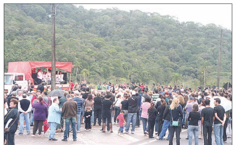
CERCA DE 200 pessoas participaram da manifestação na manhã de sábado