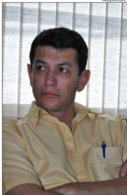
SECRETARIO fala sobre comissionados

O secretário de Finanças afirma que os cargos comissionados são muito importantes para qualquer forma de governo. "Quando eleito o prefeito possui um Plano