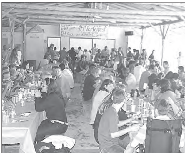
COMUNIDADE se fez presente e apoiou o evento beneficente

"A gente nunca imagina o quanto é conhecido. Começo a ver quantos amigos eu tenho", comentou, feliz com o resultado do almoço realizado em prol de sua luta. Ele revelou que hoje sua esperança é ter de volta a vida que tinha antes do acidente. É este o motivo de ele seguir firme nas sessões de fisioterapia, para recuperar os movimentos que perdeu.