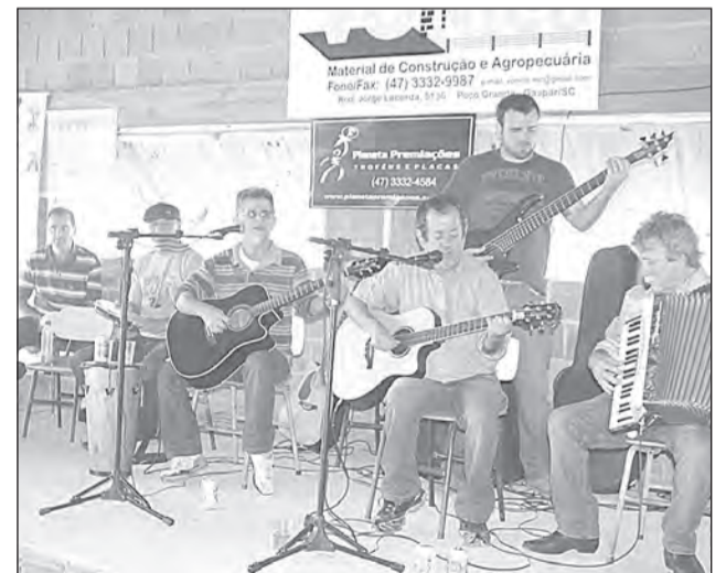
VÁRIAS duplas sertanejas se apresentaram durante o almoço