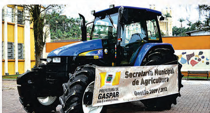
5 Trator Cabinado adquirido para auxiliar os agricultores