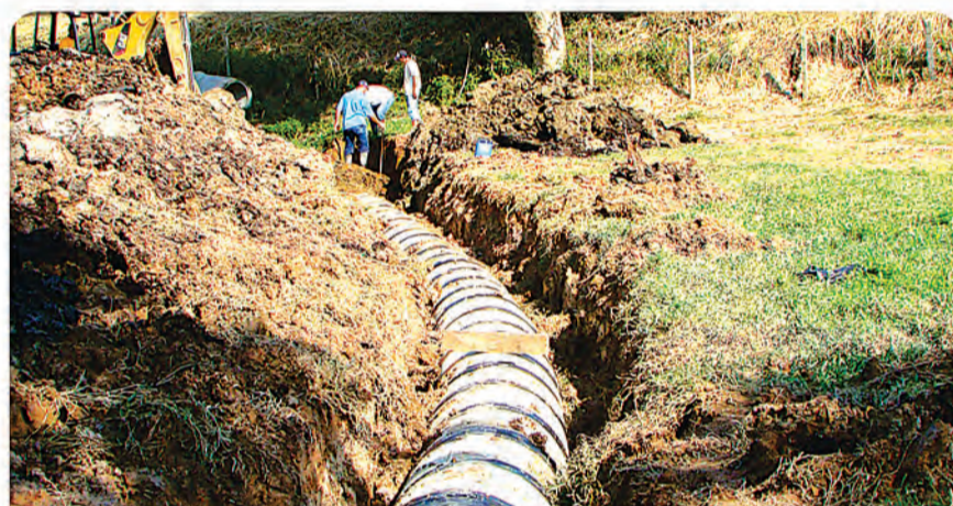
3 Tubulação evita alagamentos na Av. Frei Godofredo