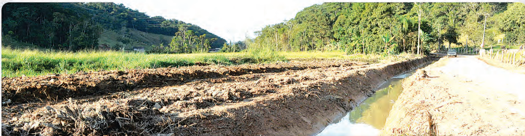
1 Desassoreamento do Ribeirão Garuba