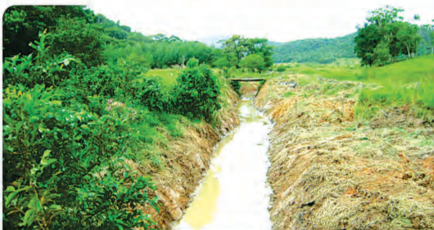
2 Desassoreamento do Ribeirão Macuco