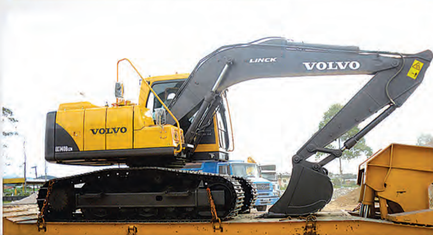
4 Escavadeira hidráulica adquirida para desassoreamento de valas e ribeirões