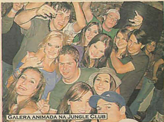
GALERA ANIMADA NA JUNGLE CLUB