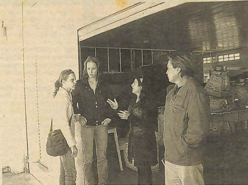
EQUIPE de Balneário Barra do Sul esteve em Gaspar para conhecer o projeto bem sucedido