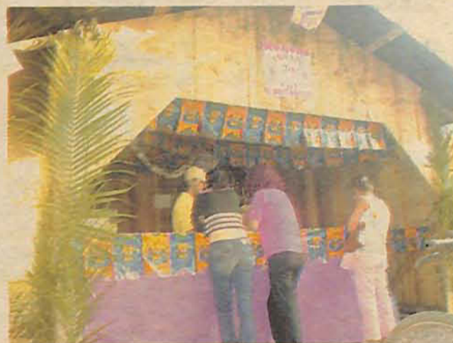
DIVERSAS atrações estão sendo preparadas para o público

Diferentemente do ano anterior, a distribuição de alimentos será feita exclusivamente para os clientes que comparem nas barra-