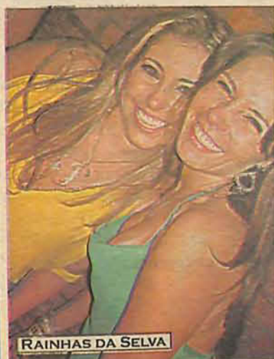
RAINHAS DA SELVA