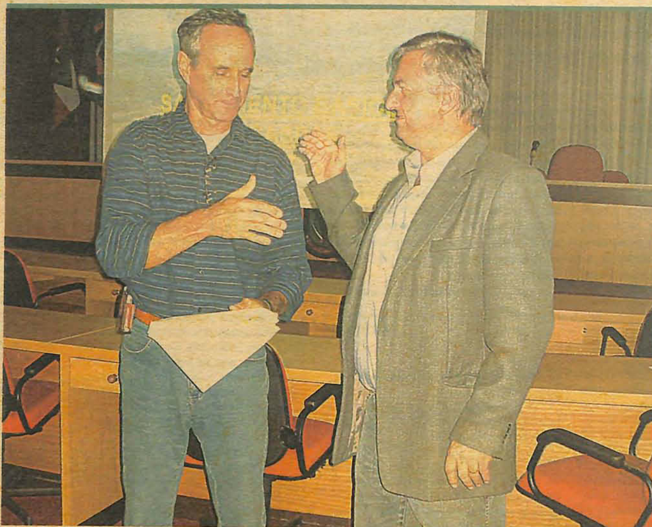
Câmara recebe projeto de instauração de política de saneamento básico