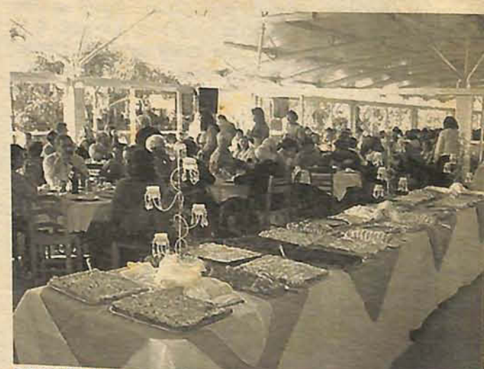
PROMOÇÃO reuniu dezenas de produtores no Café Colonial

O Café da Mulher Rural acontece há cinco anos, e começou a partir de uma necessidade de aproximar consumidores e produtores