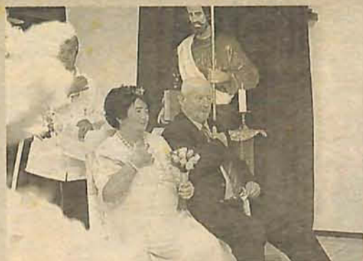
Os noivos, durante a cerimônia na capela