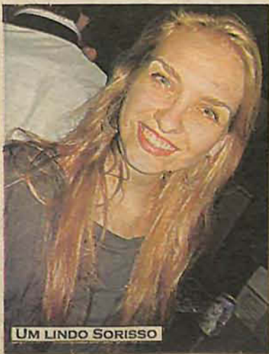
UM LINDO SORISSO