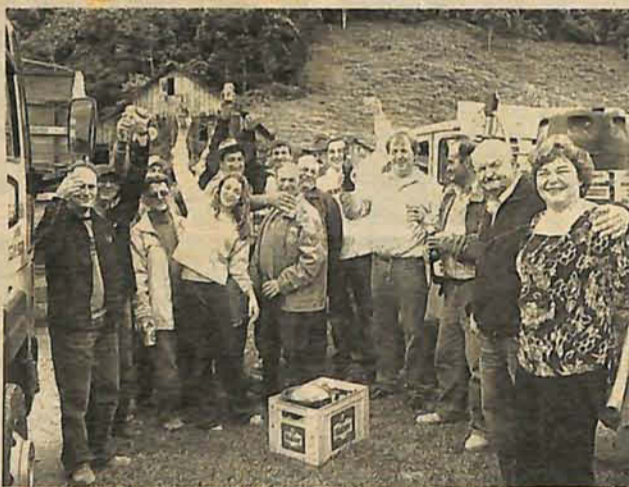
COMUNIDADE comemora o sucesso da ação com a vencedora