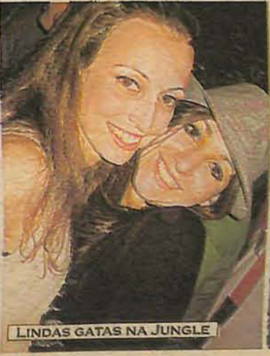
LINDAS GATAS NA JUNGLE