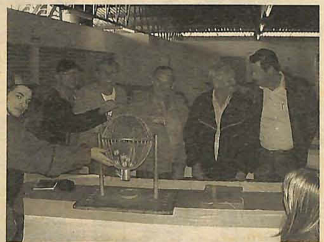
SORTEIO aconteceu na sede da Santa Clara, no domingo

Calcule, pondere, analise, compare, pense. E assine.