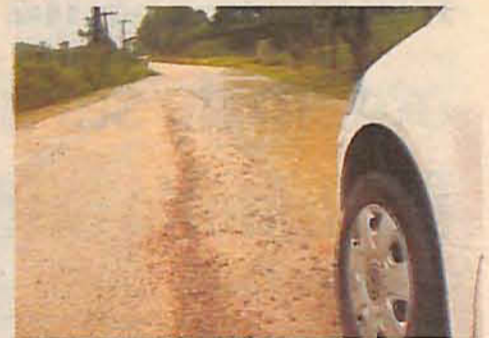
Estrada Geral Óleo Grande

A defesa Civil alerta que, se confirmada a previsão de chuva intensa, moradores de áreas vulneráveis a deslizamentos devem ficar atentos no caso de aparecimento de fendas, depressões no terreno, rachaduras nas paredes das casas e inclinação de tronco de árvores ou postes. Se houver rajadas de vento intenso, recomenda-se que a população evite o trânsito próximo ou embaixo de árvores, postes e placas, bem como de lugares desprotegidos aos ventos fortes. As prefeituras também devem orientar os agricultores para que tomem as medidas preventivas necessárias para minimizar os efeitos de possíveis alagamentos.