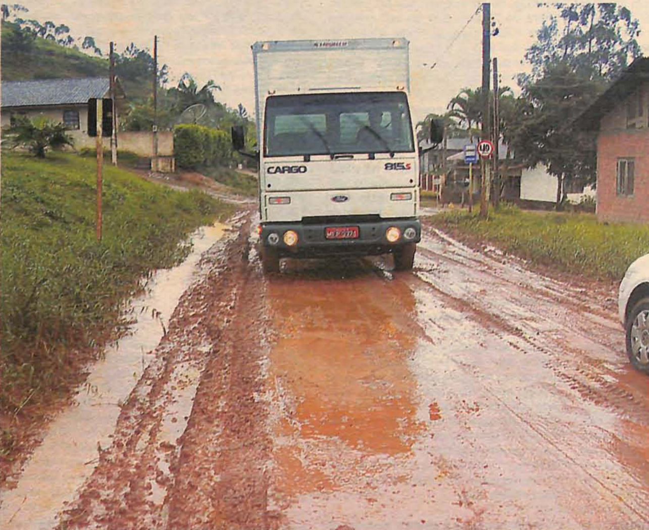
REPORTAGEM percorreu as principais ruas de barro da cidade e verificou a existência de buracos, lama e muita água parada