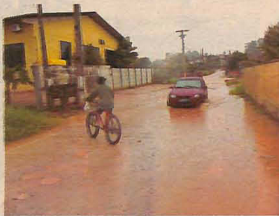
Bairro Santa Terezinha

Conforme o diretor estadual de Defesa Civil, capitão Márcio Luiz Alves, o alerta é necessário, pois o mau tempo deve atingir todo o Estado, podendo provocar uma diversidade de ocorrências. "No Vale, por exemplo, a preocupação é com a elevação do nível dos rios, pois muitos já estão