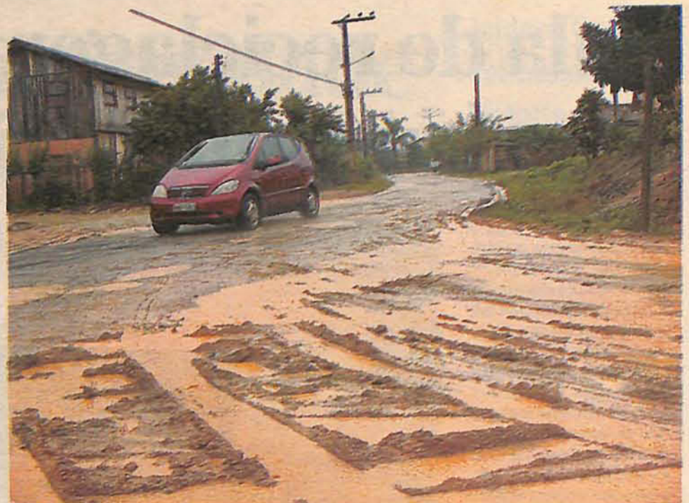
Estrada Geral do Sertão Verde