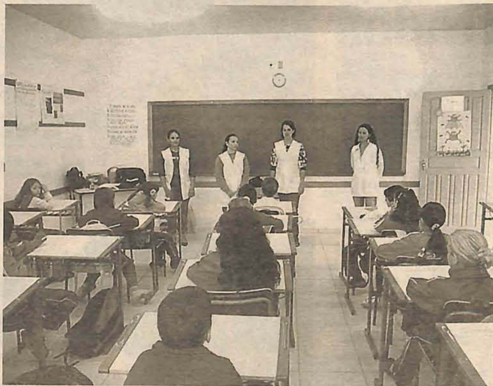
ALUNOS estudaram o tema e presenciaram de perto vários materiais produzidos com lixo

Durante toda a tarde o grupo formado por 24 alunos aprendeu sobre a importância da reciclagem e participou de atividades diferentes. A atividade teve como principal objetivo desenvolver o interesse das crianças para a importância da reciclagem do lixo. Além disso, a aula diferenciada oferecida pelas quatro estagiárias da Uniassevi pretendia demonstrar às crianças os meios de