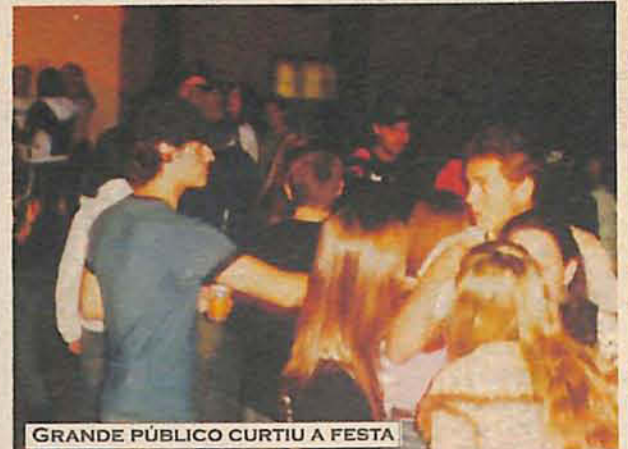
GRANDE PÚBLICO CURTIU A FESTA