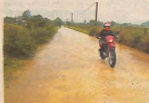
Estrada Geral Macuco