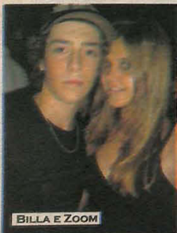
BILLA E ZOOM