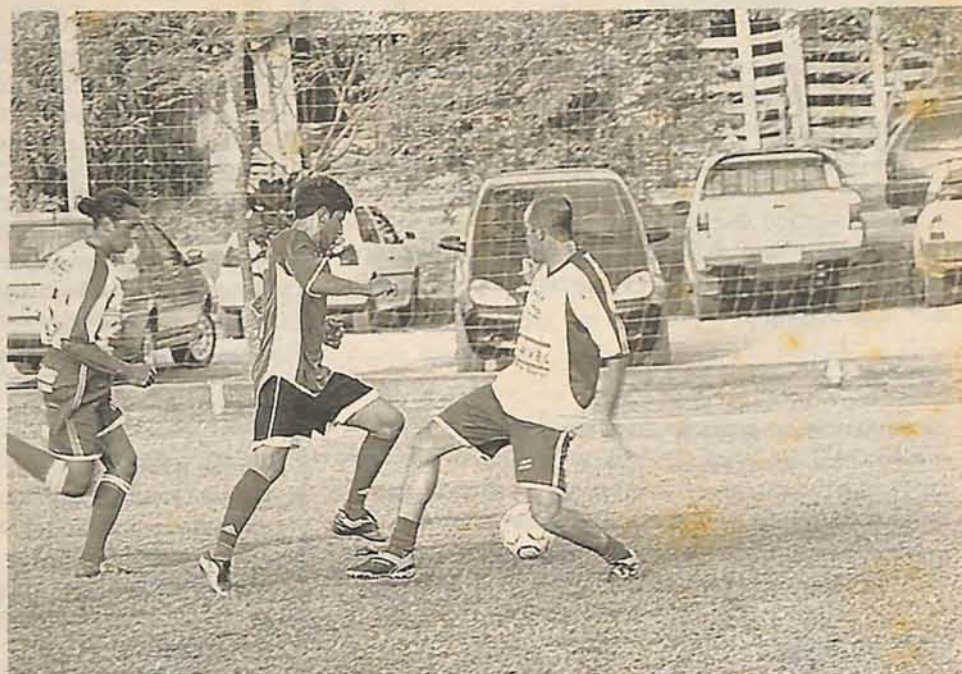
FEIKUMADRE de Almir (C) empata com MCS

Também pela Chave C, Panteras/Sango's Malhas e FWG empataram em