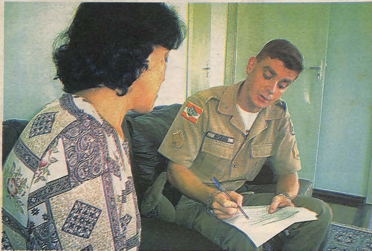
PARCERIAS importantes foram estabelecidas no encontro, resultou em ações positivas em relação ao combate às drogas

Além disso, foram discutidas formas de conseguir apoio financeiro para a "Semana de Bem com a Vida", que acontece nos