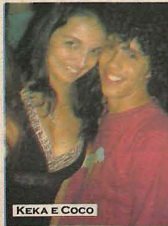
KEKA E COCO