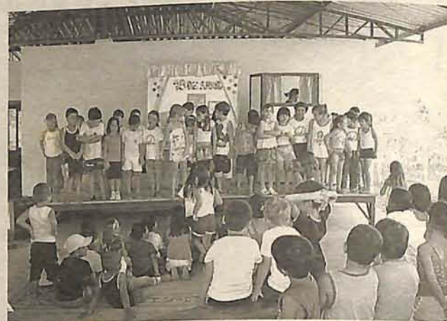
CRIANÇAS que participaram da Festa puderam ouvir histórias

A I Feira do Livro da Ferandino Dagnoni aconteceu no ano passado e, devido ao sucesso, os professores e coordenação da escola decidiram repetir o evento.