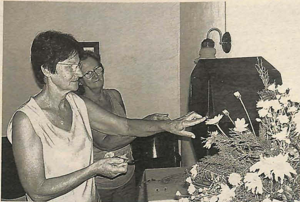
ARROMBAMENTO aconteceu uma semana após a realização da Festa da Comunidade

A festa da Comunidade Jesus Cristo Libertador reuniu centenas de pessoas no final de semana do dia 14 de abril. As senhoras comemoram o sucesso do evento. "Houve grande participação popular, com