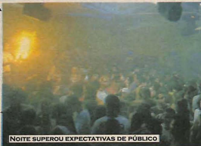
NOITE SUPEROU EXPECTATIVAS DE PÚBLICO