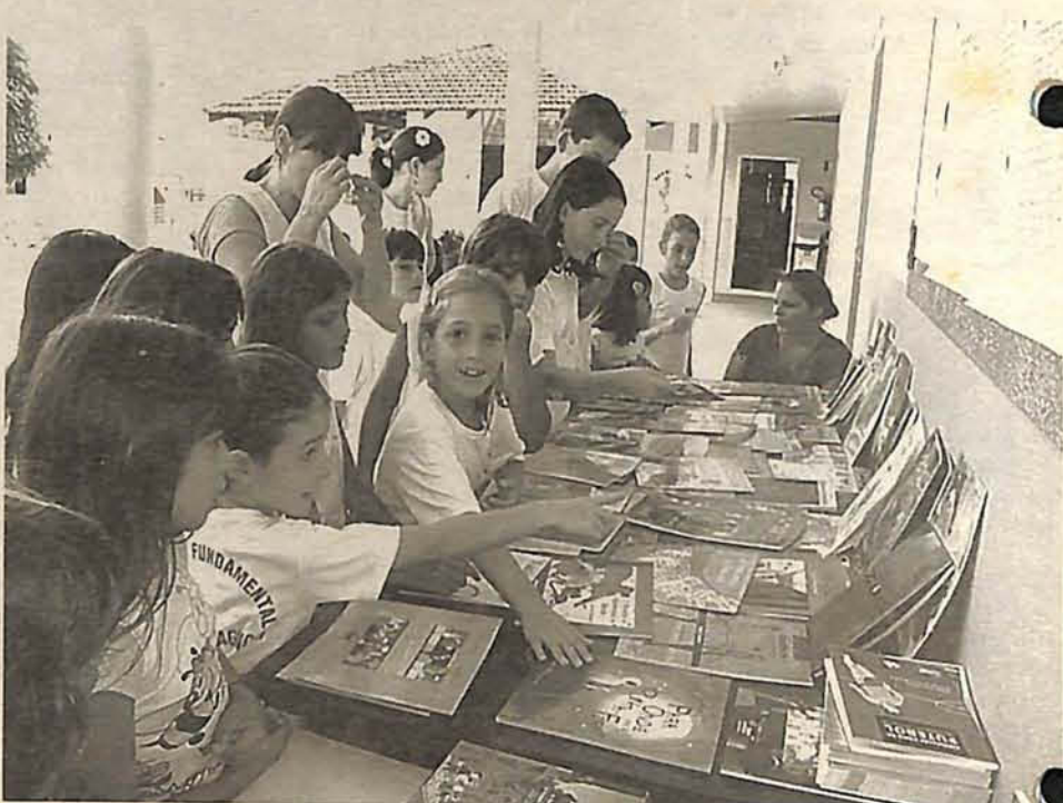
O UNIVERSO dos livros infantis esteve muito próximo das crianças durante a Semana