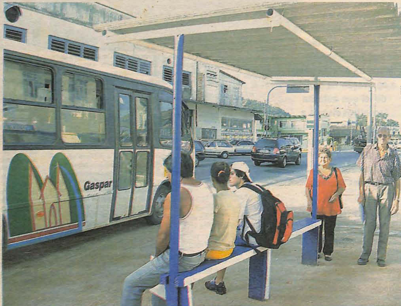
CENTRO HISTÓRICO é composto pelos prédios na área central da cidade, e tem preservação garantida pelo Plano Diretor