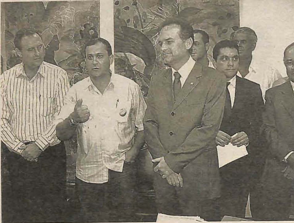
ASSESSORES acabaram direcionando a coletiva e não permitiram perguntas da imprensa