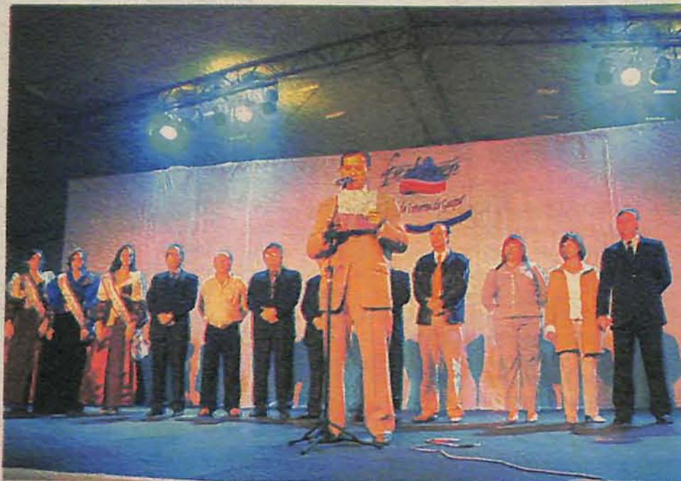
ORGANIZADORES acreditam que esta deverá ser uma das melhores festas de Gaspar

Na ocasião será exposta a planta dos pavilhões, o número de estandes e expostas as mudanças