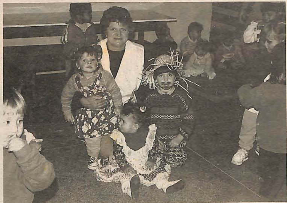
DURANTE muito tempo ela trabalhou na creche do bairro, um local de onde tem saudade

Calcule, pondere, analise, compare, pense. E assine.