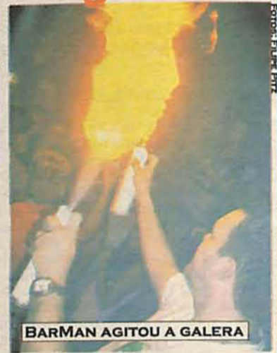
BARMAN AGITOU A GALERA