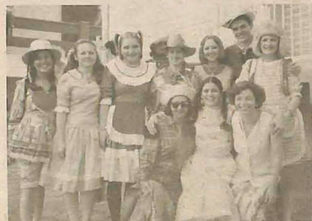
Neste sábado, 25 de junho, o Lojão do Povo, Loterias Zimmermann, Construtora PML e Pare Super 1,99, prepararam para vocês a nossa festa junina! Haverá pinhão, quentão, pipoca e cachorro quente! Esperamos por vocês!