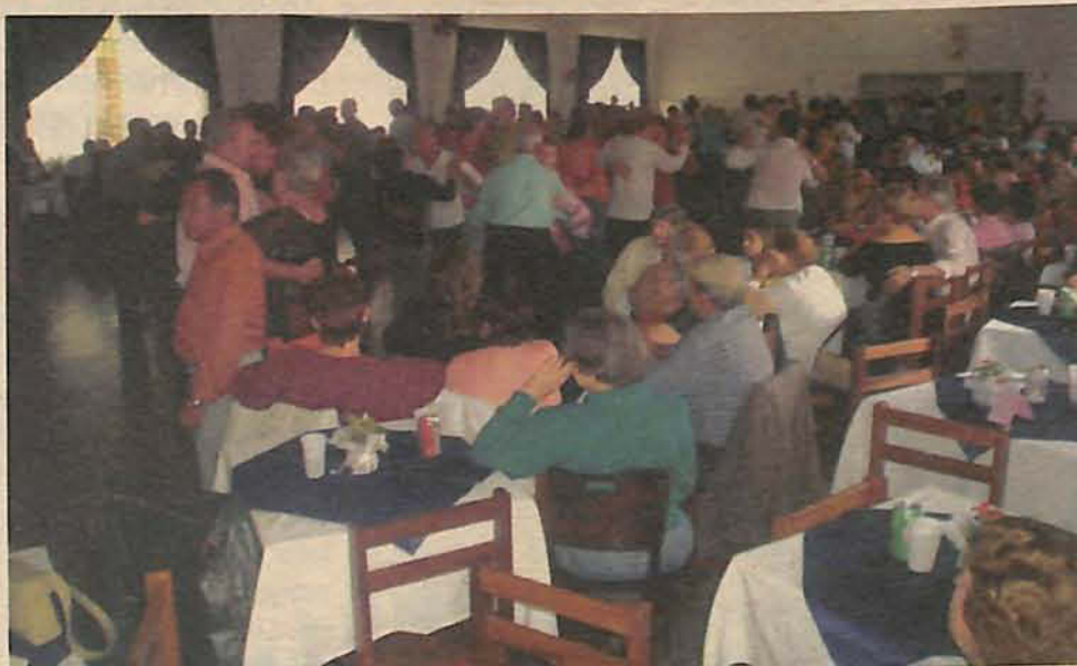
Tarde dançante animou integrantes da terceira idade nesta quarta-feira, 22

Uma programação especial foi preparada para a terceira idade, que pôde participar de uma anima-