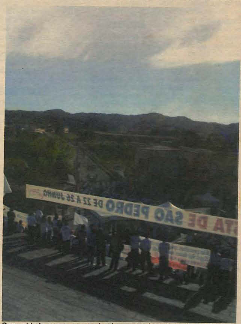
Comunidade compareceu ao local programado, mostrando sua força

O abaixo-assinado circulará pela cidade até a semana da água, em setembro, quando um novo evento será organizado e as assinaturas serão entregues ao governador do estado. Ao todo, os organizadores da campanha esperam obter 20 mil adesões. A nova ponte está orçada em cerca de R$ 25 milhões.