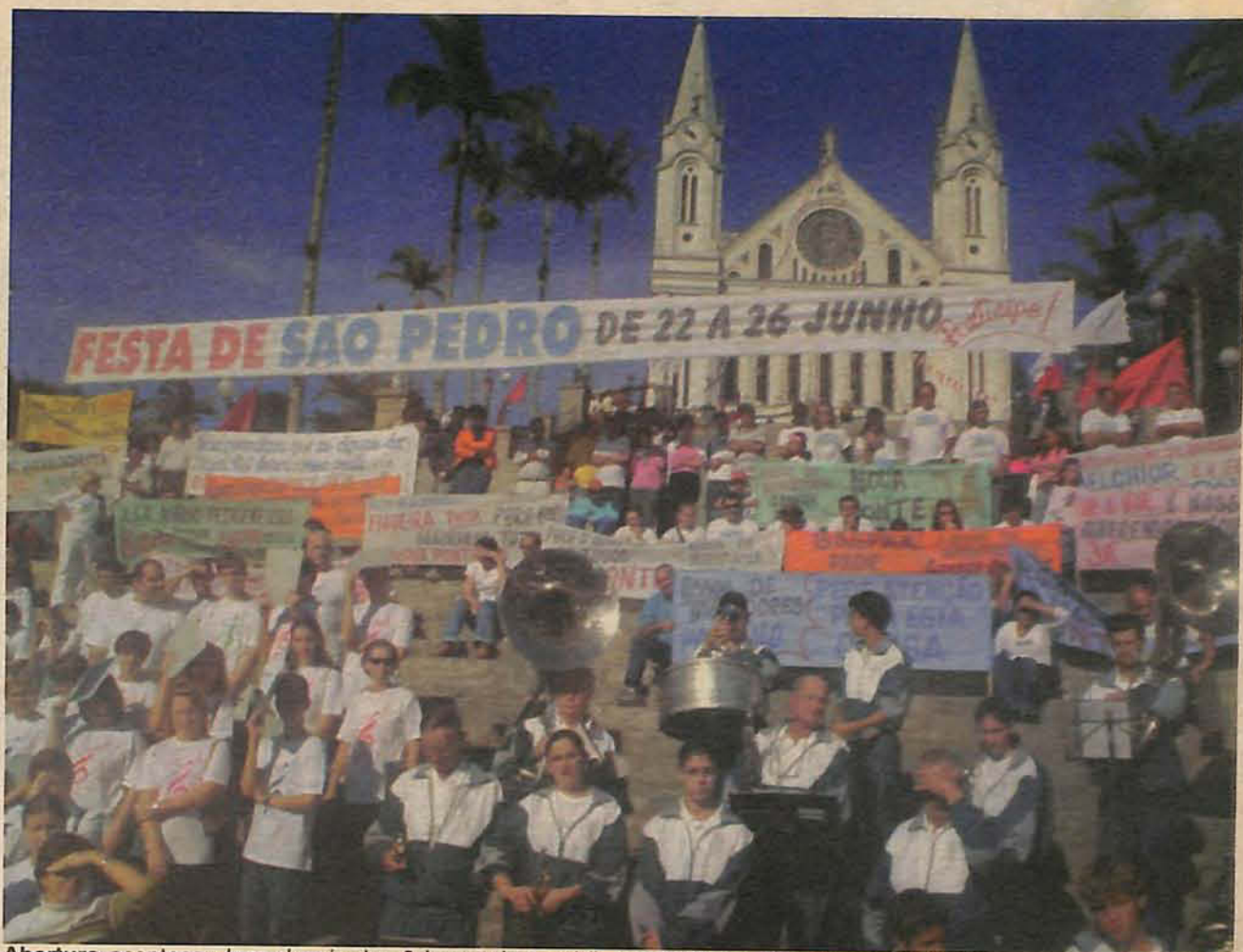
Abertura aconteceu logo depois das 9 horas da manhã, com a Missa. Depois, manifestações apoiaram a causa