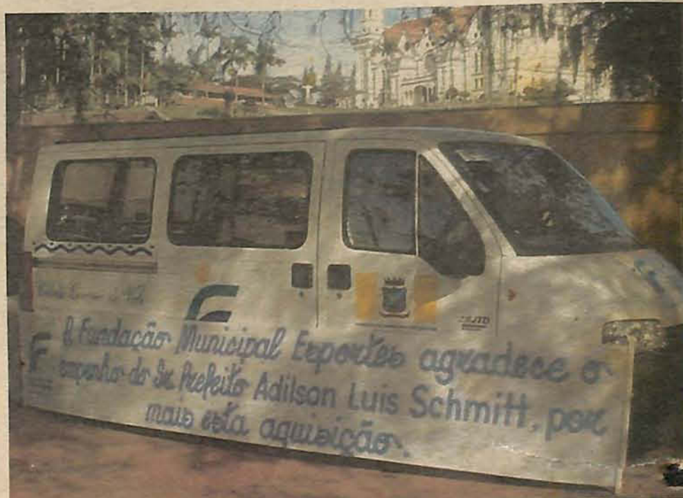
Fiat Ducato entregue na terça-feira será destinado a FME

A intenção da administração, além de prestigiar um importante setor do governo municipal, é ofere-