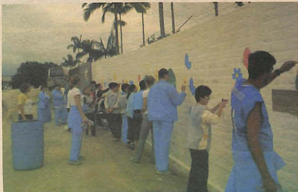
Pinturas lembraram o tema da Campanha da Fraternidade para 2005: a Paz