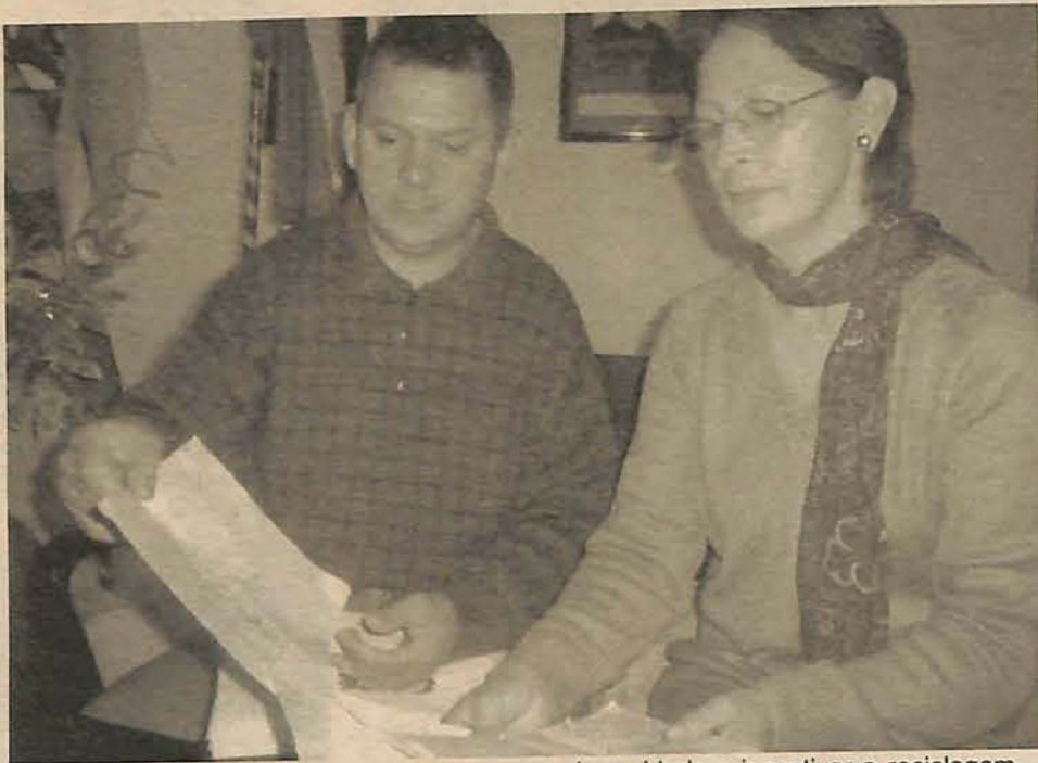
Proposta do grupo é levar o programa para toda a cidade e incentivar a reciclagem

O projeto ainda está em fase de planejamento e até o próximo mês começará suas atividades práticas, que incluem uma pesquisa junto à comunidade e coleta do lixo nas residências situadas nas proximidades da escola. Para isso, um grupo de alunos será selecionado pelos coordenadores do projeto. "Pedimos que os estudantes escrevessem algum texto relacionado ao meio ambiente, estamos recolhendo estes textos e então escolheremos os alunos que coordenarão o projeto. Os pequenos te-