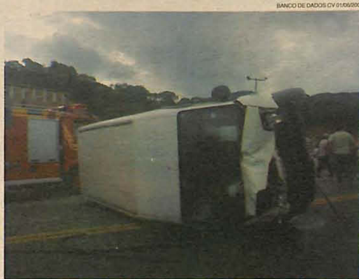
Duplicação deve reduzir acidentes fatais, constantes no trecho

segundo o pedágio. "O pedágio ficaria em torno de seis a dez centavos por quilômetro, mas o preço deverá ser discutido com transparência. Com certeza lutaremos pelo preço mais baixo para o catarinense", garante.