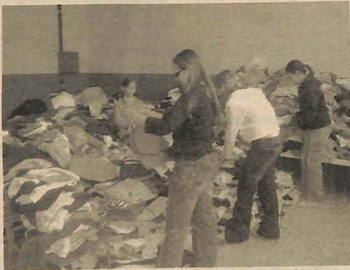
Doação da escola foi a mais expressiva de toda a cidade

A gincana aconteceu durante a primeira semana de junho e mobilizou toda a comunidade escolar com brincadeiras, disputas e arrecadações. A etapa final da gincana acontecerá nas próximas semanas e esta-