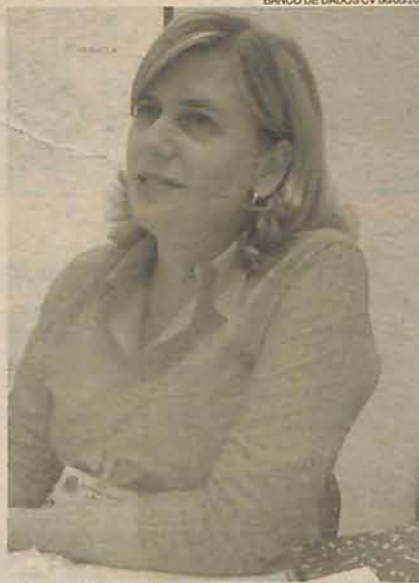
Secretária: incentivo à vacinação

pode, assim, causar lesões que resultam em paralisia, e é aí que os membros do corpo podem ser afetados. Os braços e as pernas são mais frequentemente afetados.