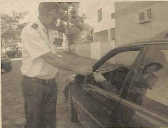
Veículos estacionados no local estão cobertos por seguro

A Águia Park possui dois locais para estacionamentos na área central: