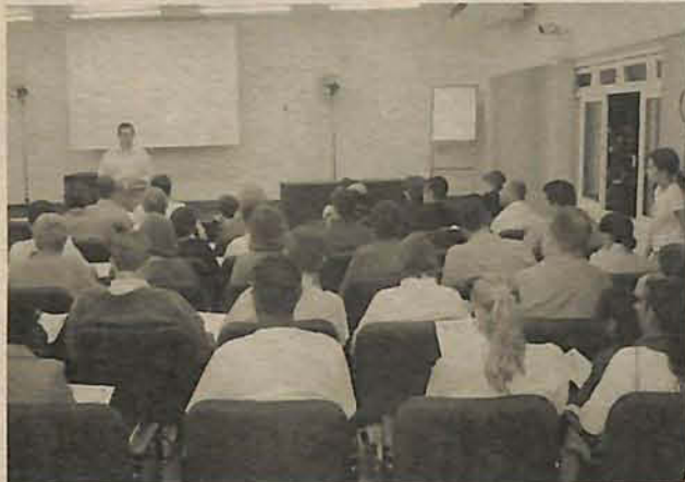
Eleição aconteceu na semana passada, na prefeitura