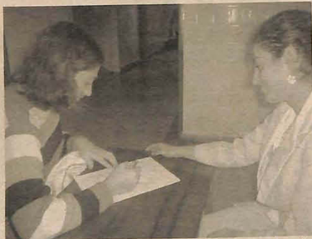
Alguns serviços foram prestados quarta-feira, no hospital

A programação estava agendada para o dia do aniversário mas, devido a chuva, foi transferida para hoje. Na quarta-feira os serviços foram prestados no próprio hospital, para que a data não passasse em branco. Um