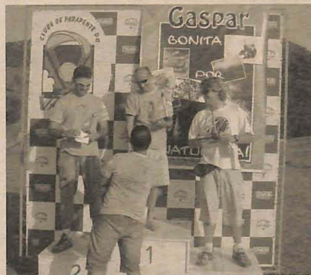
Premiação aos vencedores da 4ª Etapa do Campeonato Interestadual de Parapente