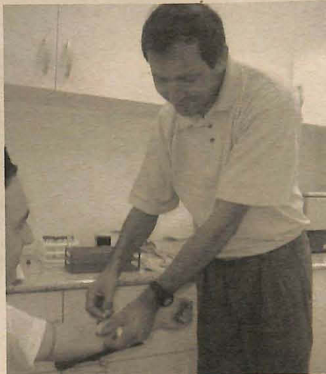
Campanha pretende detectar a doença em sua fase inicial

A faixa etária mais acometida varia de acordo com o tipo de infecção, sendo entre 20 e 39 anos para hepatite B e entre 30 e 49 anos para hepatite C. A infecção nestas hepatites acontece geralmente por via sexual, no caso da hepatite B, e por uso de drogas injetáveis, no caso da hepatite C, podendo ser contaminadas por outras formas, como giletes descartáveis, seringas, alícatas de unha, etc.