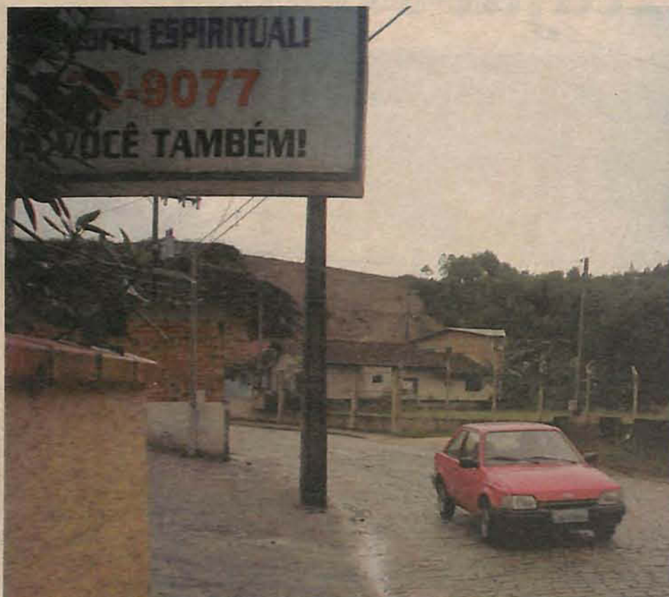
Reduzir a poluição visual, principalmente na área central, é o objetivo desta fiscalização

ruas centrais da cidade e encontrar postes, paredes e muros com cartazes colados. A maioria deles já está desgastado pelo tempo e está visualmente poluído. Um dos locais mais críticos é o prédio onde funcionava a empresa de malhas Emerson. Lá estão colados centenas de cartazes, todos corroídos pelo tempo. Segundo Krajevski, estes cartazes também serão retirados, pois estão em situação irregular.