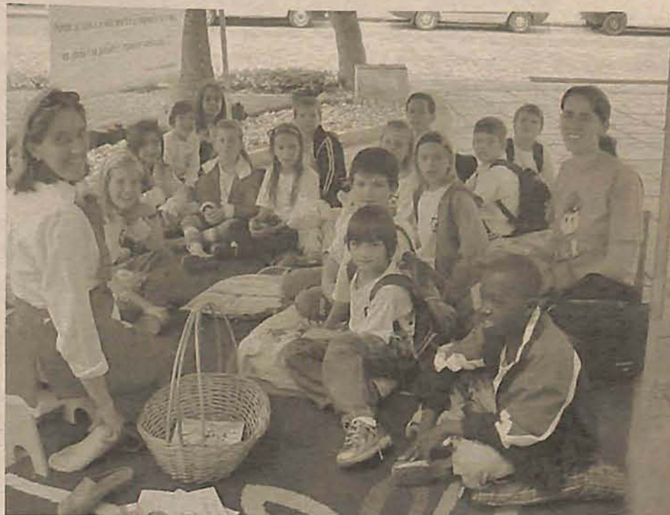
Incentivar a leitura infantil é uma eficiente maneira de transformar a sociedade