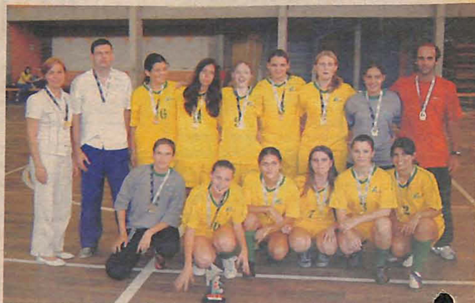
Equipe de Futsal Feminino campeã da fase classificatória em Ascurra.

A próxima fase será a etapa regional que será disputada entre 21 à 26 junho de 2005 em local a ser confirmado.