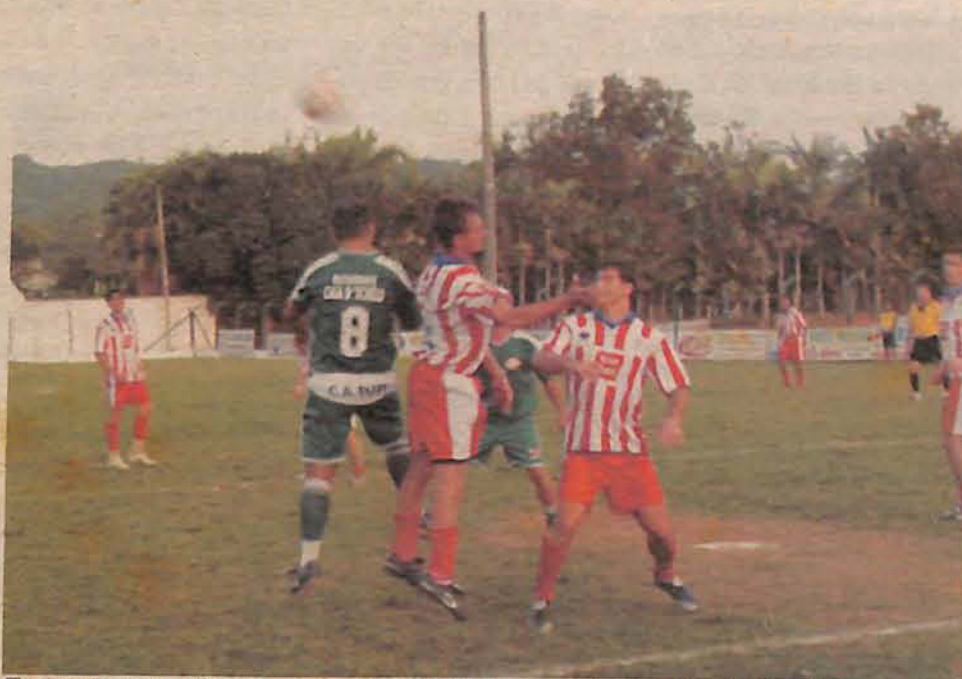
Tupi treina com afinco para as disputas do Campeonato Amador da Liga Brusquense