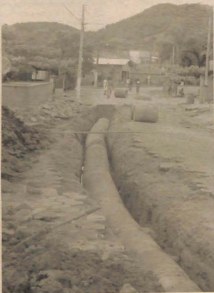
Obras nas tubulações de esgoto estão sendo intensificadas

A obra já está em fase final. Os tubos foram substituídos e agora estão sendo instaladas novas bocas de lobo e também será refeita a pavimentação da via, que teve que ser aberta. Con-