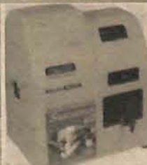
Sucana 60 - Hobby

Rua: Pedro Schmitt Júnior, 60 (Rod. Jorge Lacerda, Km 20) Povo Grande - Caixa Postal: 142 - Gaspar