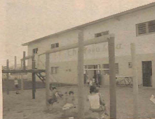
Comunidade da Margem Esquerda já está sendo atendida

Com a redução da fila de espera no CDI da Margem Esquerda, o número de crianças que aguardam por uma vaga nos Centros de Educação