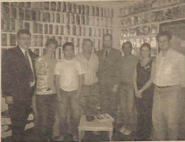
CDL de Gaspar participará do encontro, em Blumenau

As cidades de Blumenau, Indaial, Luis Alves, Timbó, Ilhota e Gaspar estão trabalhando juntamente com a Federação das Câmaras de Dirigentes lojistas para receber os participantes do evento que tem como proposta desenvolver uma programação técnica de nível, que envolva motivação, profissionalização e aborde os temas do mercado. Programações sócio-culturais também fa-