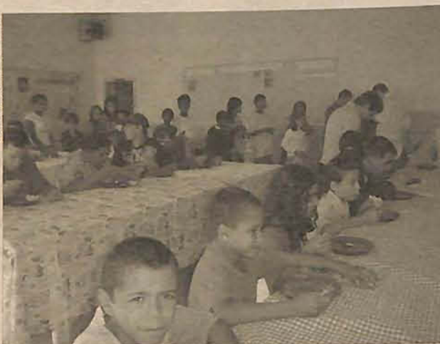
Jornada integral para alunos da João XXIII, em Tubarão

Onde já tem: Agrolândia, Águas Mornas, Araranguá, Benedito Novo, Blumenau, Bom Jardim, Bom Retiro, Bombinhas, Brunópolis, Brusque, Caçador, Campos Novos, Canelinha, Canoinhas, Capinzal, Chapecó, Concórdia, Correia Pinto, Criciúma, Curitiba, Dionísio Cerqueira, Faxinal dos Guedes, Fraiburgo, Florianópolis, Ibirama,