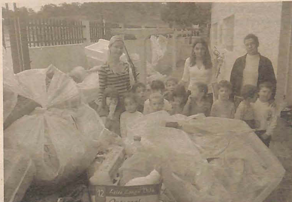
Reciclagem envolve a comunidade do CDI, que reúne 400 quilos de lixo por semana