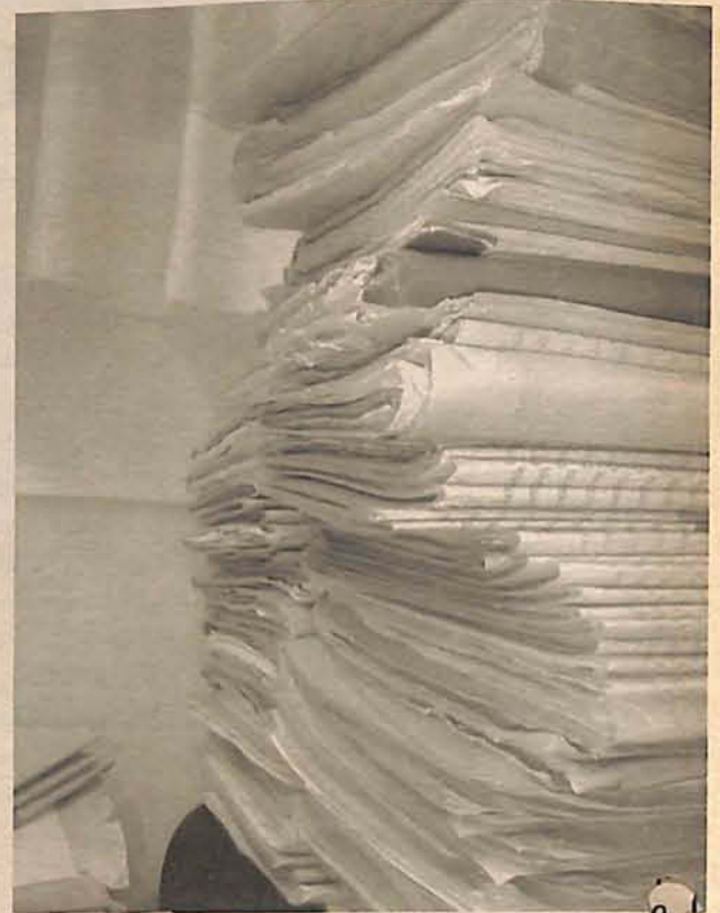
Mutirão quer reduzir a quantidade de processos parados

Maiores informações sobre o Mutirão da Conciliação podem ser obtidas junto ao Fórum de Gaspar a partir das 13h.