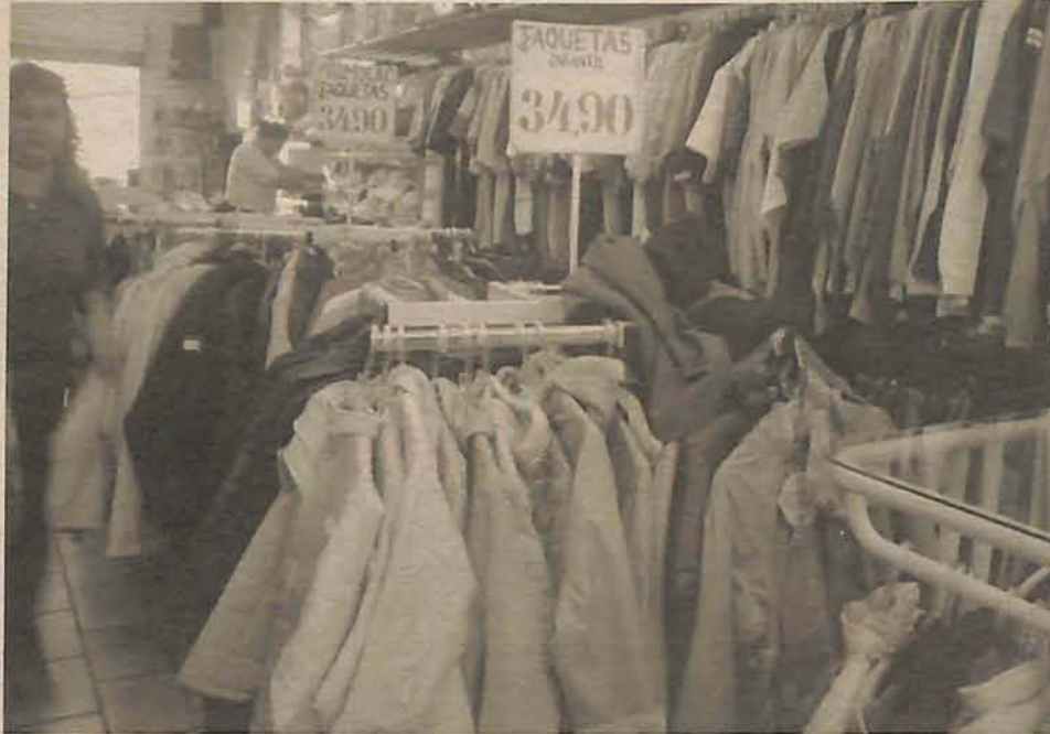
Coleção outono/inverno já pode ser encontrada em todo o comércio local