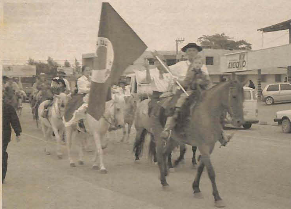
O tradicional desfile é uma das principais atrações da promoção tradicionalista

O Rodeio terá início com o tradicional desfile pelas principais ruas da cidade, que está marcado para o dia 20, a partir das 14h, no mesmo dia está marcada a disputa "Troféu da Cidade" e a partir das 23h acontece baile com o grupo Tche Campeiro e Portal Gaúcho. Nos demais dias do evento grupos como Gaitaço.com, Garotaço e