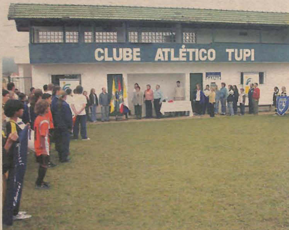
Abertura aconteceu no campo do Tupi

No naipe feminino, Escola Ivo D'Aquino e