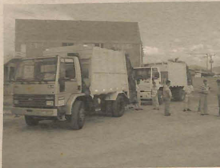
Decisão pelo recolhimento de lixo precisou ser tomada rápido

O departamento jurídico já notificou a Recycle, que não pode mais realizar o trabalho, já que estaria operando ilegalmente (sem contrato para a prestação de serviço).