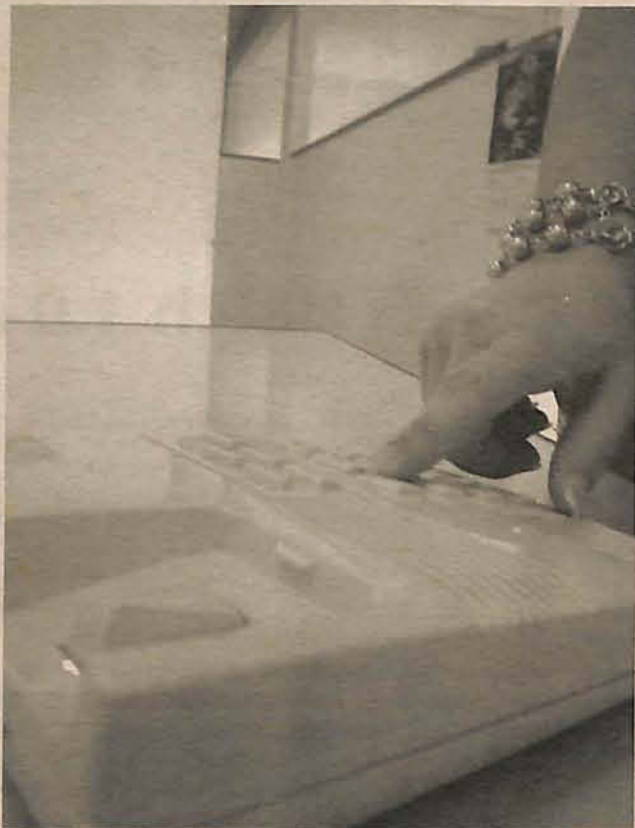
Comunidades podem receber o conforto do telefone