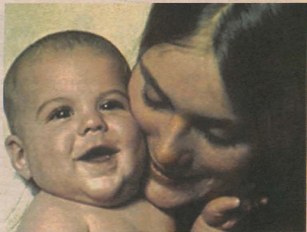
Dia das Mães só perde para o Natal em valores movimentados no comércio

O jantar está marcado para o dia 13 de maio. Os sorteios acontecem em cada loja, neste sábado.