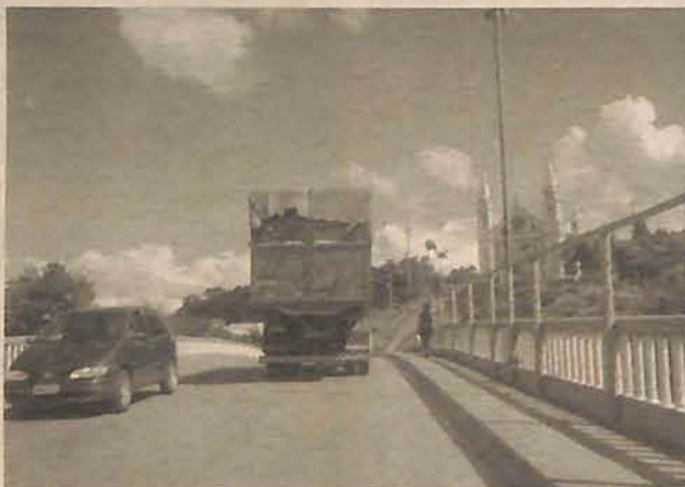
Ponte tem sua estrutura comprometida há muito tempo

Em princípio, o prefeito adianta que serão colocadas duas cancelas sob as cabeceiras da ponte.