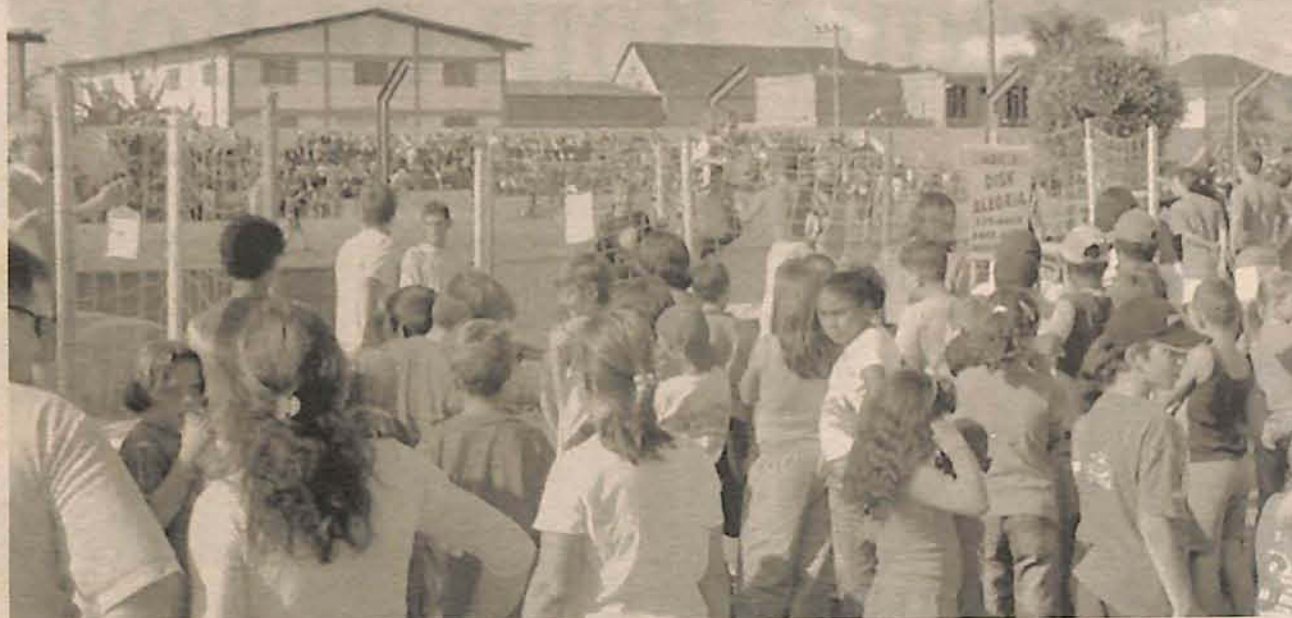
Grande público compareceu na festa do Tupi

Mais uma vez a Festa de 1º de Maio do Clube Atlético Tupi foi sucesso.