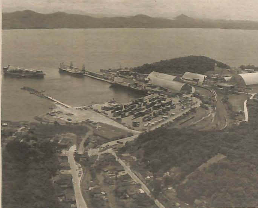
São Francisco do Sul é líder na renda per capita

Esses dados constam do trabalho desenvolvido pela Secretaria de Estado do Planejamento, a partir de informações do IBGE (Instituto Brasileiro de Geografia e Estatística). Confira aqui os principais dados e mais informações no endereço eletrônico da Adjori: www.adjorisc.com.br