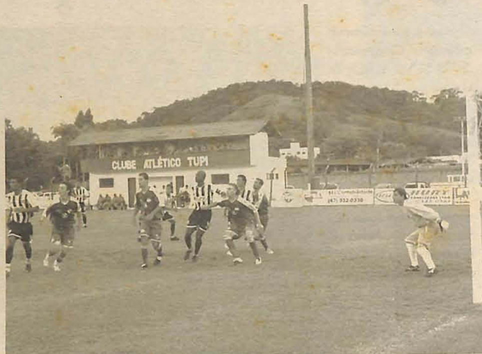
Figueirense marca 6 a 1 em jogo amistoso no Barbosa Fontes

O jogo foi outro, a rapaziada correu, marcou, pressionou e acabou marcando o gol do Tupi, e segurando o ataque do Fi-