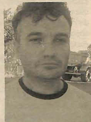
Presidente da associação denuncia alta velocidade

Outro problema enfrentado pela comunidade da Pedro Simon são as enchentes. O local é um dos primeiros da cidade a ficar debaixo da água nos dias de mais chuva. Diversos pontos já foram levantados para evitar a inundação, porém nada do que foi feito até o momento