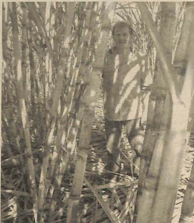
Produtores de cana e vendedores estão apreensivos

A notícia traz alívio aos produtores e aos proprietários de quiosques que vendem a garapa nas demais regiões do estado. Porém, diferente do que tem sido noticiado na imprensa local, ainda não