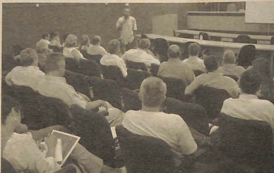
Plenário da Câmara ouviu a apresentação da prefeitura sobre o novo Plano Diretor