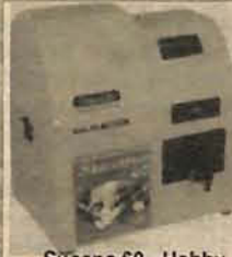
Súcana 60 - Hobby

Rua: Pedro Schmitt Júnior, 60 (Rod. Jorge Lacerda, Km20) Poço Grande - Caixa Postal: 142 - Gaspar