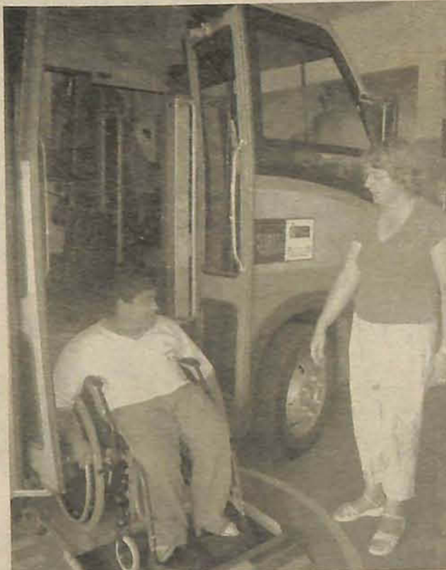
Novo microônibus dá mais conforto aos alunos da Apae