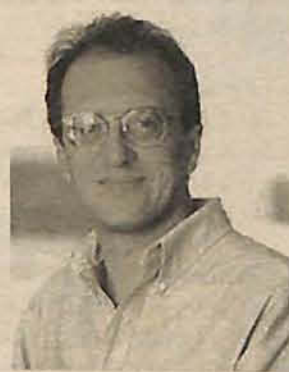
Deputado foi indicado como candidato ao Senado