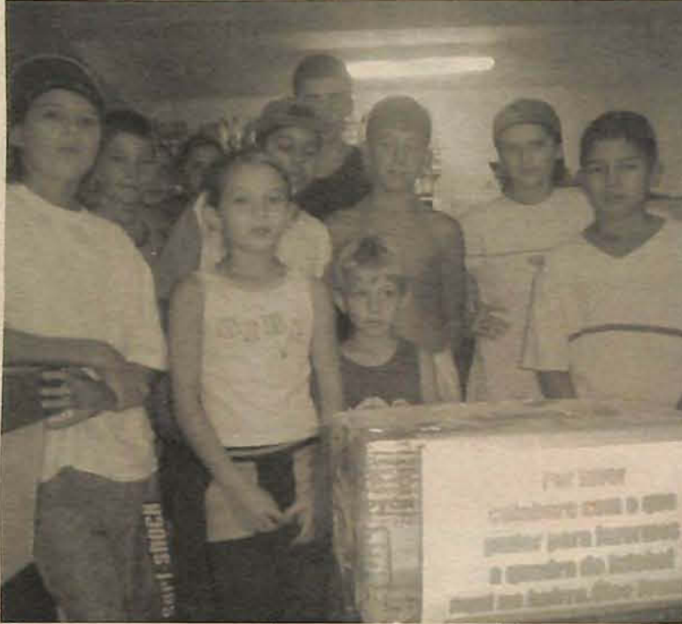
Garotos esperam arrecadar os recursos necessários para a quadra

Ter um local apropriado para praticar esportes e para se divertir nos momentos de lazer. Este é o maior sonho das crianças que residem no bairro Óleo Grande, próximo à escola e à capela. Para realizar este sonho, um grupo de cerca de 25 crianças decidiu fazer uma caixinha com os dizeres: "Por favor, colabore com o que puder para fazermos a quadra de futebol aqui no bairro Óleo Grande". A caixinha foi colocada em um dos estabelecimentos comerciais do bairro e