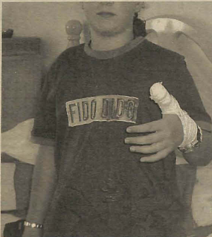
Menina mostra os sinais do que teria sido uma agressão

As crianças acusam o zelador de ter batido nelas com uma vara enquanto elas bebiam água de uma cachoeira, em um terreno particular, que fica atrás da associação. Elas afirmam que ele bateu com a vara e depois saiu correndo atrás delas morro a baixo e soltou um cachorro para pegá-los. O zelador defende-se das acusações e afirma que a pena alertou as crianças de que elas não deveriam beber a água da cachoeira e nem tomar banho, pois a água é utilizada pela comunidade. "Eu não bati em nenhuma delas, elas estão machucadas pois quando me vi-