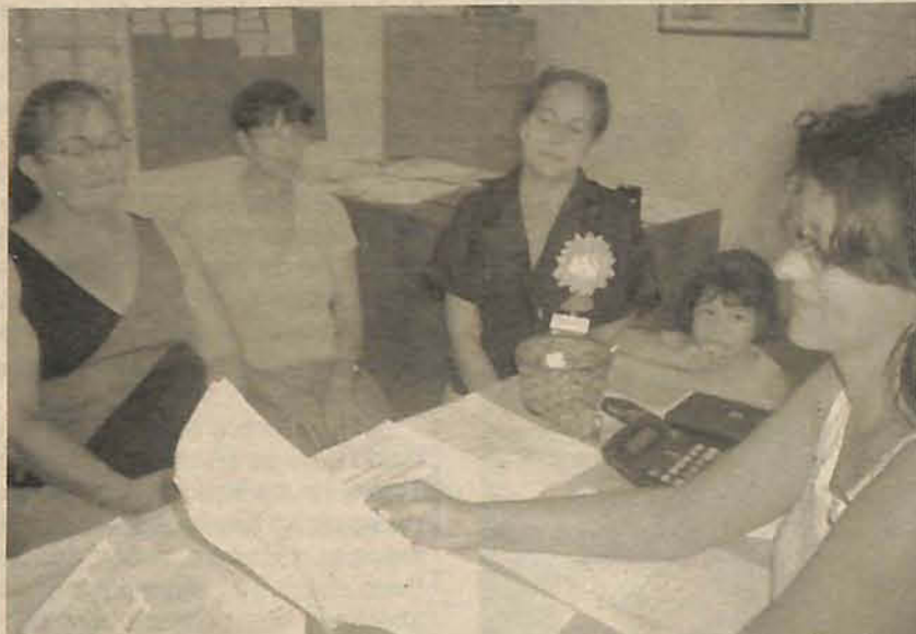
Equipe está percorrendo as ruas do bairro, analisando casos prioritários