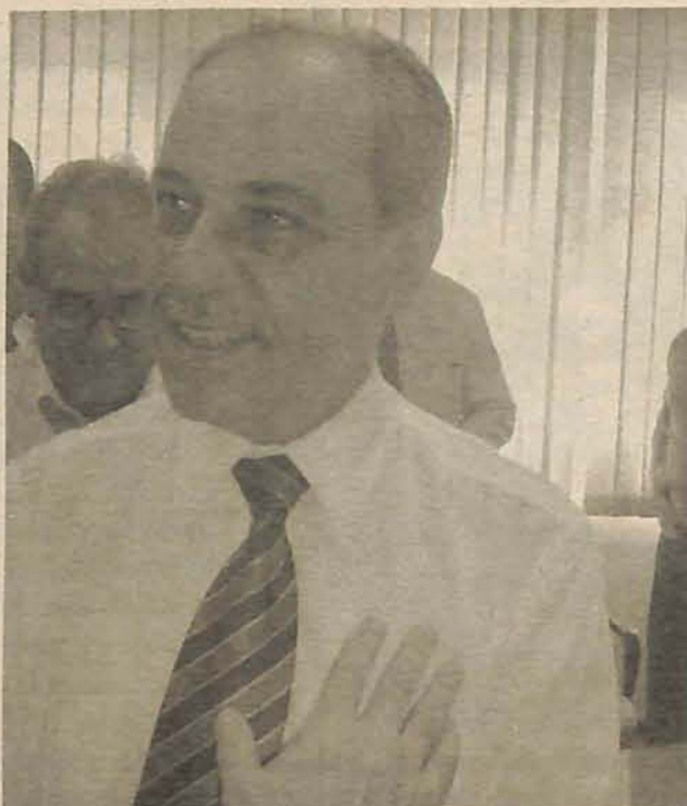
Secretário visitou hospital e reuniu-se na Prefeitura