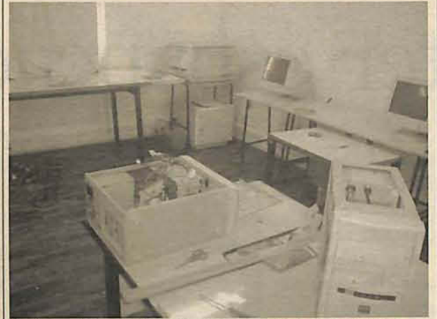
Prejuízo foi o maior até agora, em todos os roubos

Portão desmontado, portas arrombadas, papéis jogados por todos os lados. Foi assim que a zeladora da escola Vitório Anacleto Cardoso, no Porto Arraial, encontrou o educandário na manhã de quarta-feira, 30. A escola foi arrombada durante a madrugada e os ladrões levaram 12 computadores, impressoras, dois vídeo cassetes, dois aparelhos televisores e alimentos que estavam armazenados no freezer e na despensa da cozinha. A polícia esteve no local fazendo a vistoria, mas não tem suspeitos para o roubo.