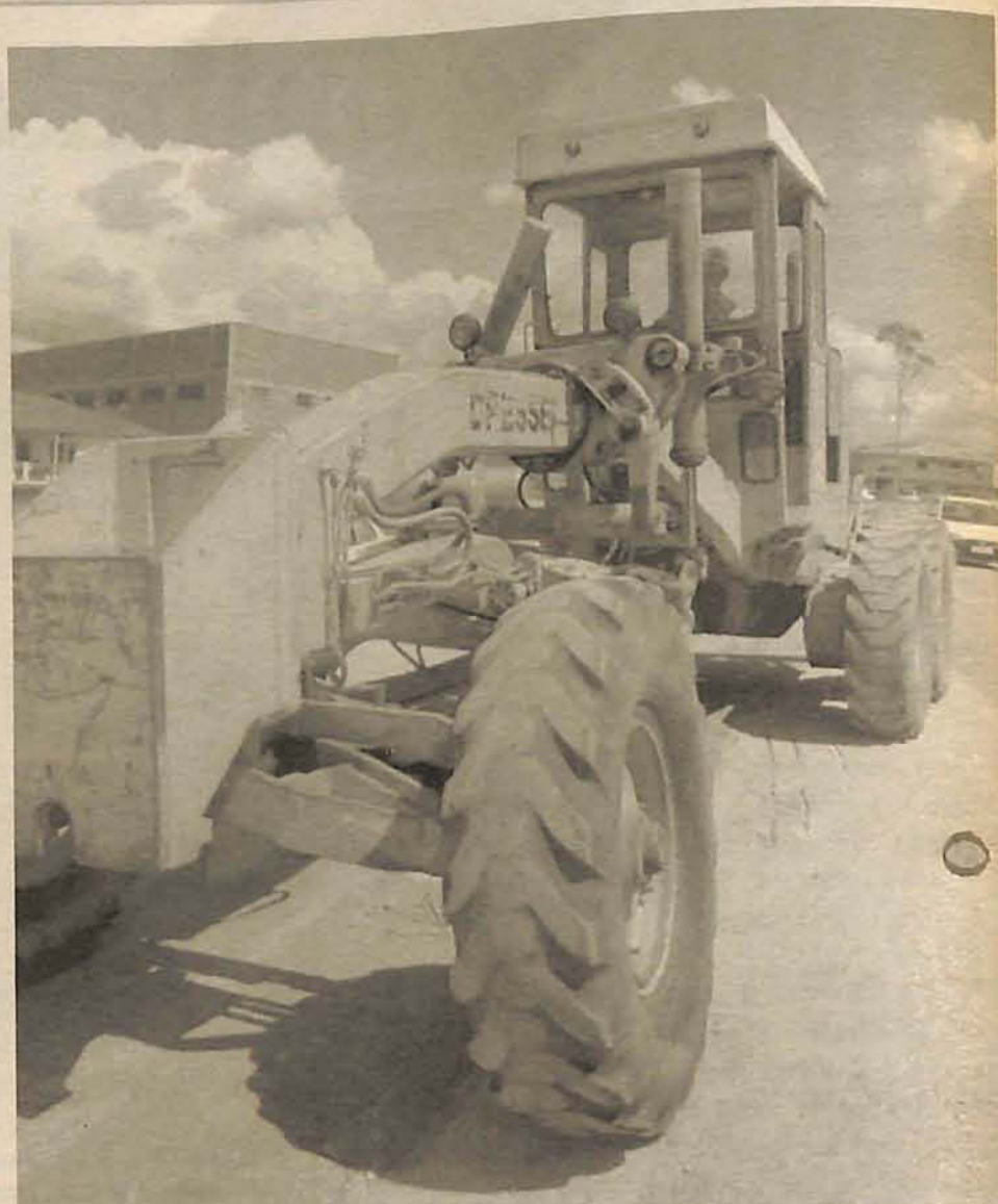
Maquinário da prefeitura está sendo reformado para atender obras prioritárias

Segundo o secretário, no decorrer do ano, novos maquinários deverão ser reformados para beneficiar a comunidade.