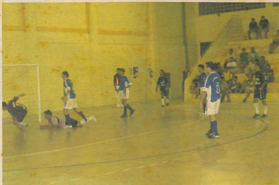
Cruzeiro não conseguiu segurar até o final

No segundo jogo da noite, a equipe da Sociedade Cruzeiro, assustou a equipe do Ciro/Malhas Alex, quando terminou o primeiro tempo vencendo pelo placar de 5 a 1. No segundo tempo o jogo