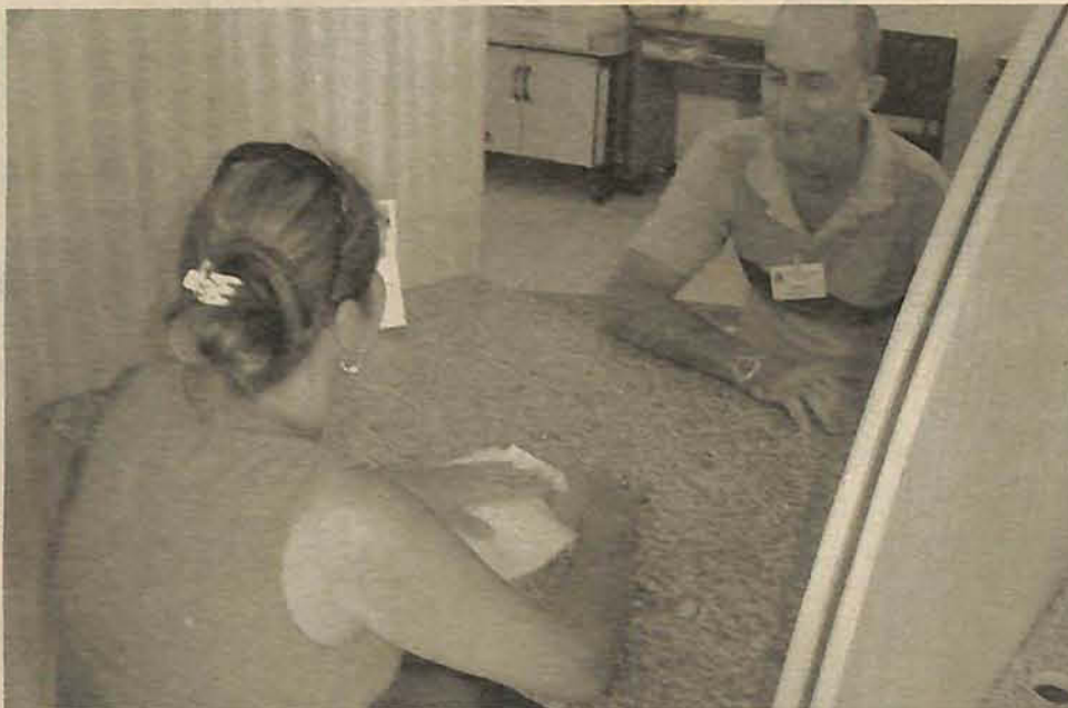
Inscrições podem ser feitas no hall da prefeitura, na segunda e na terça-feira

No total, estão disponíveis 115 vagas para o Ensino Médio e 45 vagas para o Ensino Superior; neste último, o aluno deverá estar cursando pelo menos o quinto semestre. As vagas serão preenchidas durante o ano letivo e o programa tem a validade de um ano.