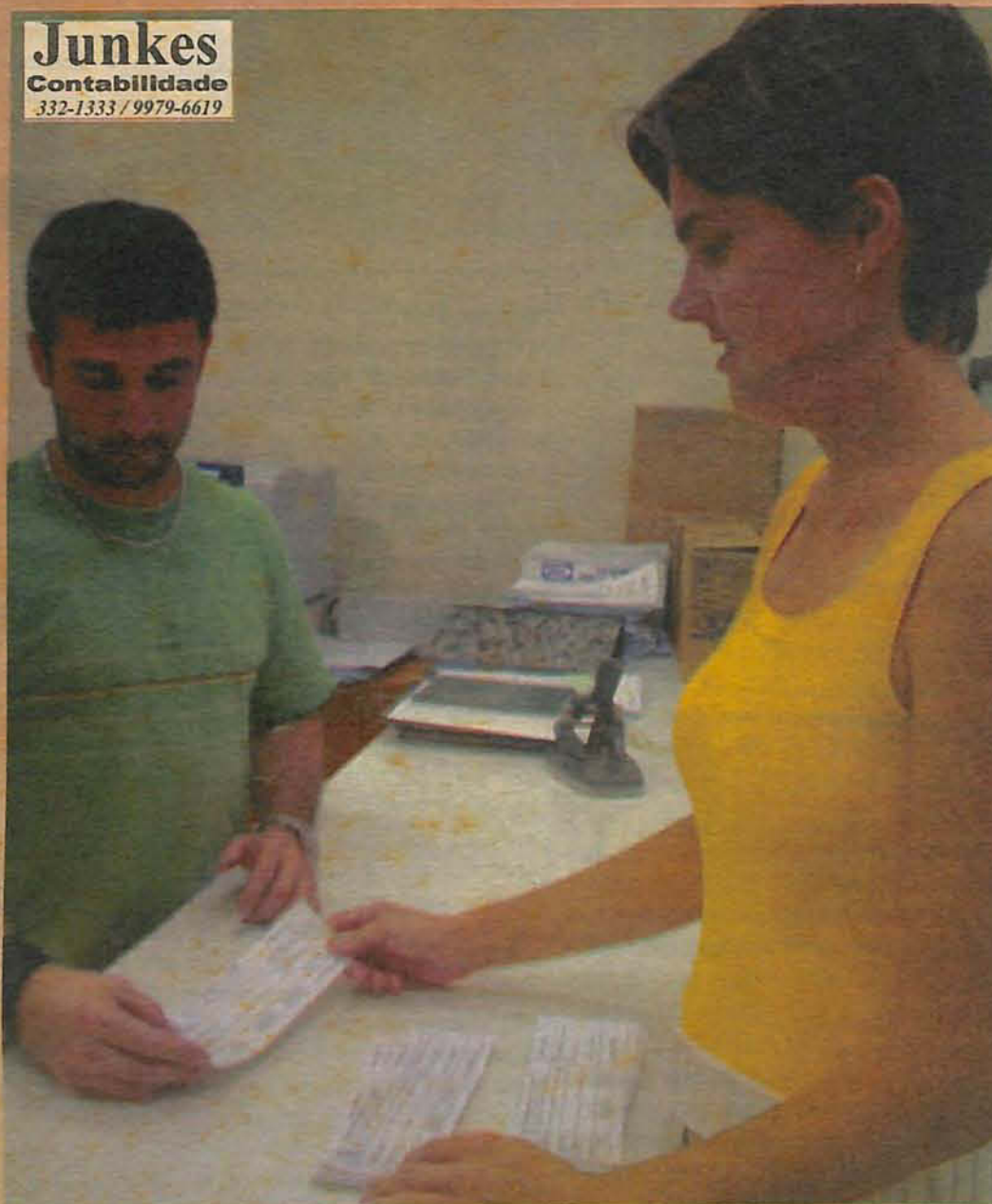
Junkes Contabilidade 332-1333 / 9979-6619

Estabelecimentos comerciais, industriais, prestadores de serviços e profissionais autônomos tem até o dia 31 para pagar a primeira parcela do Alvará de Funcionamento. Caso o pagamento não seja efetuado, os contribuintes ficam sujeitos a cobrança de multas e juros.