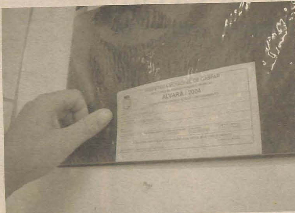
Prefeitura pretende arrecadar cerca de R$700 mil com o imposto

Bernx, explica que o valor do Alvará depende da categoria de cada estabelecimento comercial e também do número de funcionários empregados no estabelecimento. "No total, estão sendo produzidos 2.900 carnês para os estabelecimentos da cidade. Nestes contribuintes estão incluídas as indústrias, comércio em geral, prestadores de serviços e profissionais autônomos. O reajuste do Alvará é re-