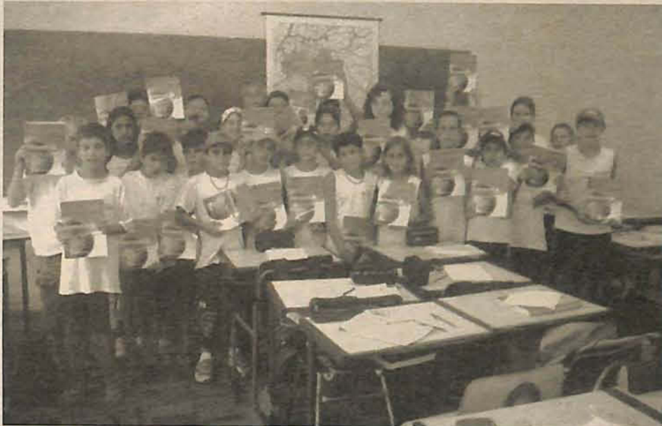
Aulas são uma parceria da secretaria de educação com o Centro de Cultura Italiana

Os alunos das escolas Ana Lira, no Alto Gasparinho, e Ferandino Dagnoni, no Gasparinho Quadro, tiveram uma aula diferente nesta semana. Além de ser em horário extra-classe, a aula foi ministrada por uma professora que, ao invés de ensinar matemática, português ou artes, ensinou italiano. A aula faz parte de um projeto piloto de ensino da língua italiana nas escolas do município e esta sendo realizada através de uma parceria entre a Secretaria Municipal de Educação, através do Circolo Trentino Di Gasparin, com o Centro de Cultura Italiana do Paraná e Santa Catarina.