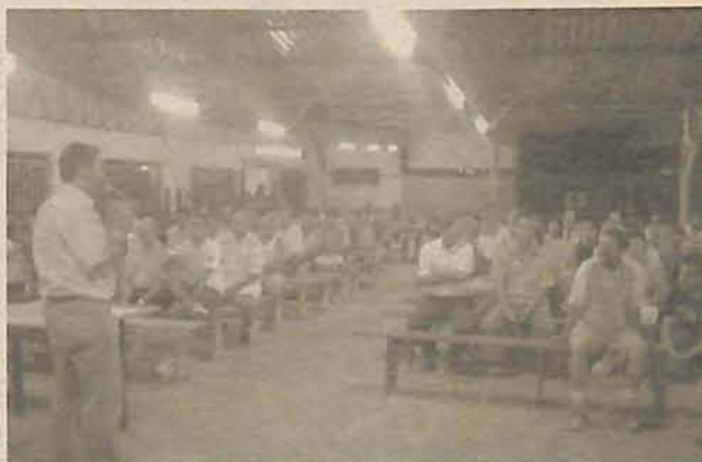
Prefeito Adilson ouviu as reivindicações dos moradores

Além disso, obras como a canalização do esgoto na rua da Comunidade Santa Clara foram prometidas pelo executivo municipal. "A tubulação da rua da Comunidade já está sendo licitada, e assim que terminar a licitação será