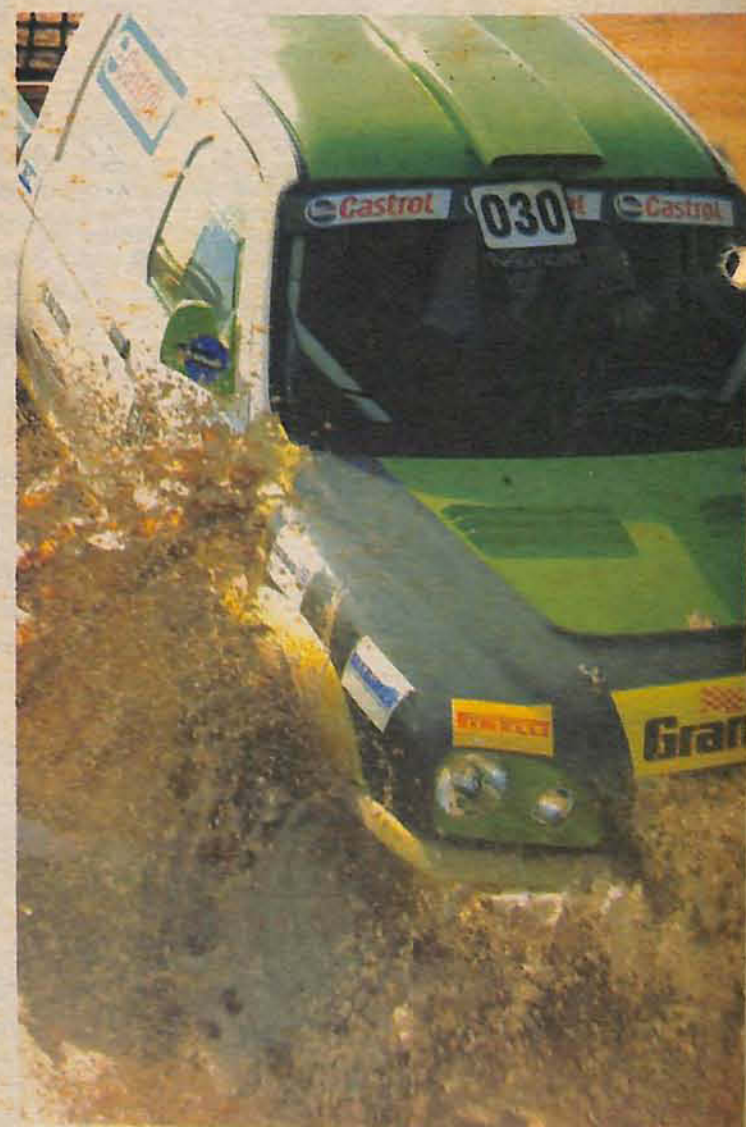
Arrojo dos pilotos encantou público presente no evento