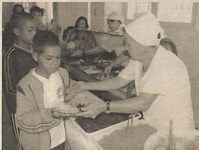
Orçamento para merenda escolar é de R$ 1,1 bilhão

O tema é “Vamos Cuidar da Alimentação Escolar” e o principal objetivo é orientar os membros dos Conselhos de Alimentação Escolar (CAEs) municipais a aumentar a eficiência da fiscalização e da execução do Programa Nacional de Alimentação Escolar (Pnae). A tele-