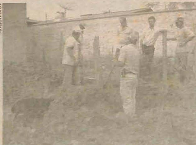
Problema do bairro é o esgoto, ainda sem solução

O maior problema da comunidade sempre foi um esgoto, que corria a céu