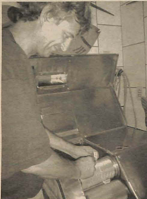
Alerta geral fez a Vigilância estadual lacrar máquinas