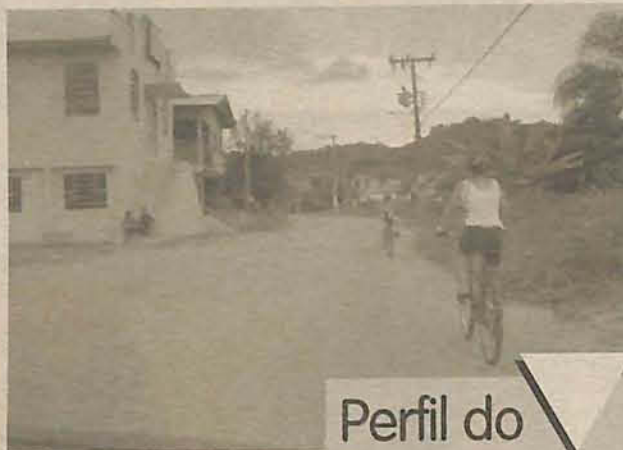
Mil famílias vivem no local

No geral, existem poucas empresas e comércio no Sertão verde. Apenas duas empresas de usinagem, um mercado e alguns bares movimentam a economia do local. Muitas facções funcionam nas garagens das casas, são mini-empresas que geram emprego para as mulheres do bairro. Além disso,