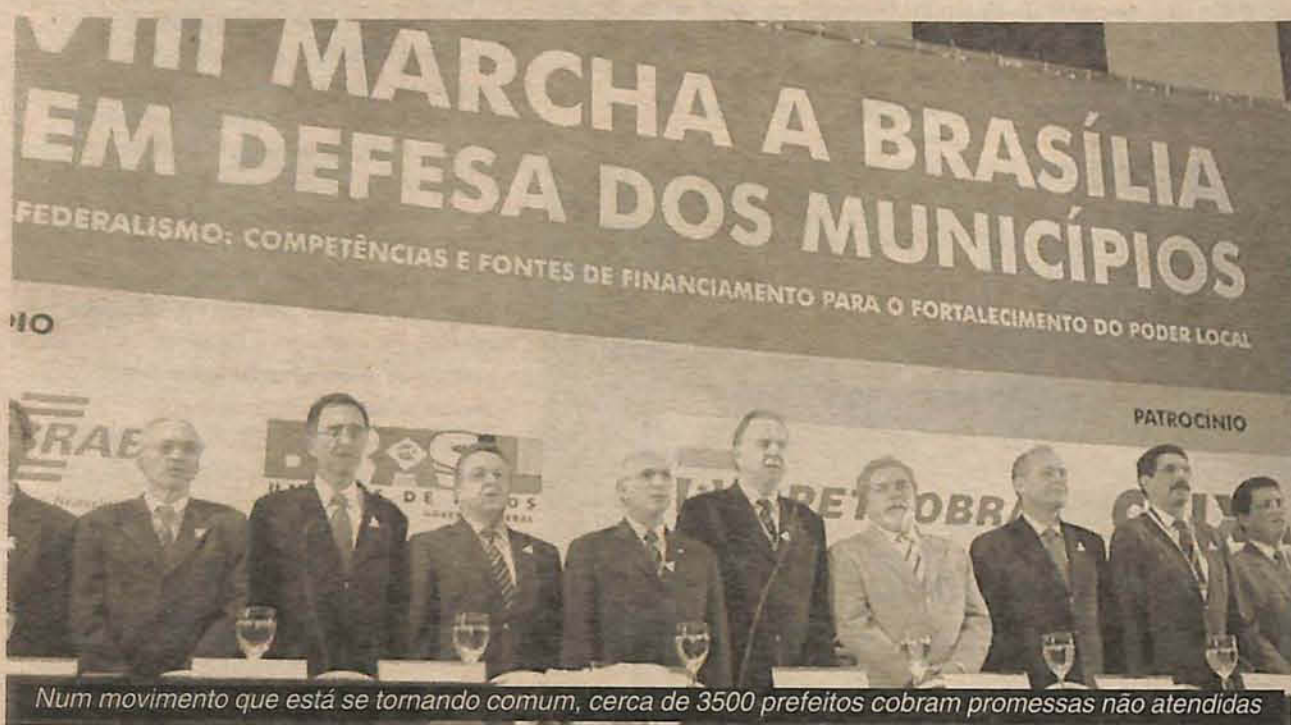
Num movimento que está se tornando comum, cerca de 3500 prefeitos cobram promessas não atendidas

Os recursos viriam com o aumento de 1% no FPM (Fundo de Participação dos Municípios), formado pela arrecadação de dois tributos federais: o Imposto de Renda e o IPI