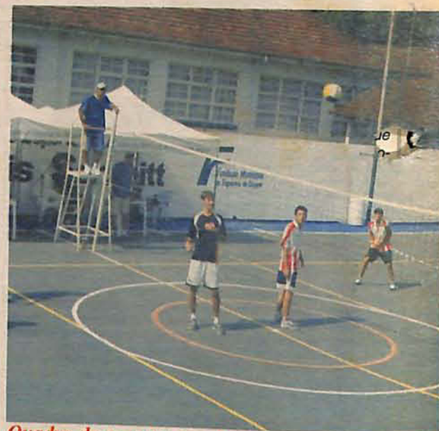
Quadra de esportes recebeu diversas melhorias

Festival de voleibol, promovido pela Fundação Municipal de Esportes de Gaspar, no último sábado e domingo, na Quadra de Esportes Otávio L. Schmitt, foi considerado um sucesso pelos organizadores.