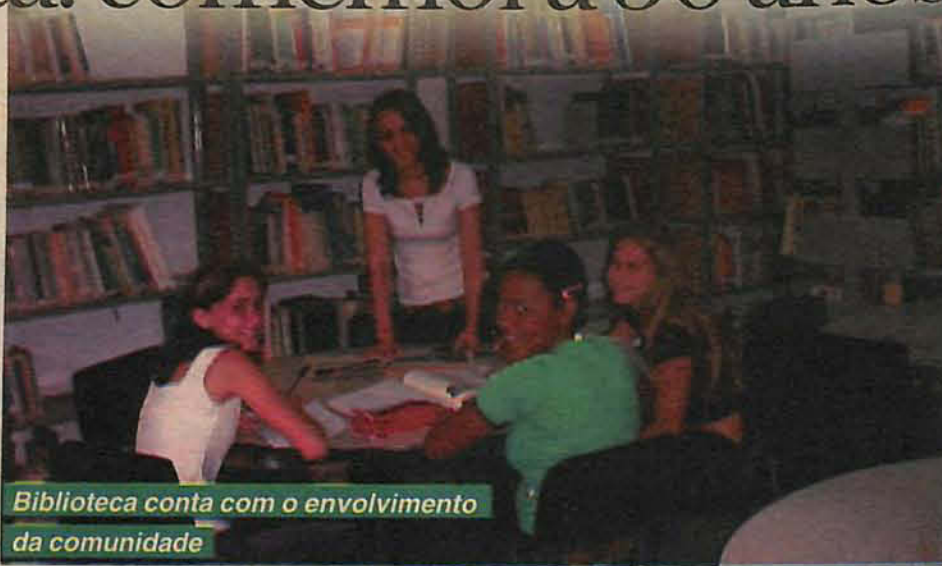
Biblioteca conta com o envolvimento da comunidade

Para comemorar a data, algumas pessoas ligadas à biblioteca estarão participando, hoje, do desfile em comemoração ao aniversário do município. Ontem, quinta-feira, 17, foi organizado um "Sarau de Verão", em parceria com o Departamento de Cultura. E também estão sendo distribuídos folders com informações sobre a Biblioteca/Sociedade Amigos da Biblioteca/Proler; marcador de páginas alusivo aos 30 anos e sacolas comemorativas, que os usuários utilizarão para transportar o material destinado a em-