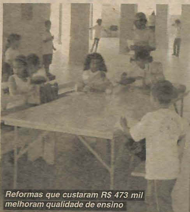
Reformas que custaram R$ 473 mil melhoram qualidade de ensino