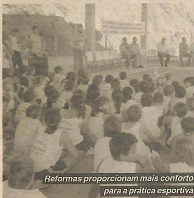
Reformas proporcionam mais conforto para a prática esportiva