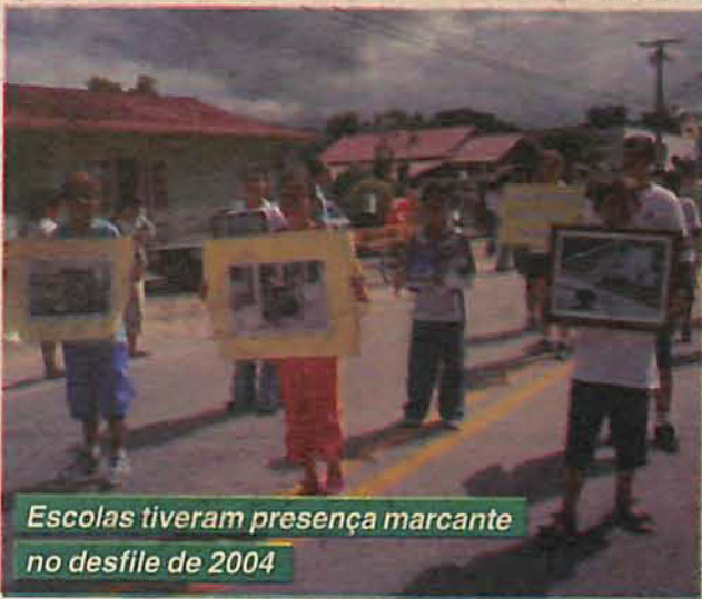
Escolas tiveram presença marcante no desfile de 2004

Escolas, CDIs, clubes e diversas entidades como o grupo de idosos, Exército, a Rede feminina de Combate ao Câncer e a Apae participarão do evento. Como é tradicional, o desfile será aberto pelo Clube Musical São Pedro e terminará com a passagem dos Centros de Tra-