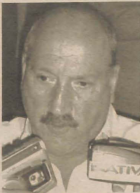
Governador quer crescimento no setor turístico da região

O encontro aconteceu na prefeitura de Itajaí e na pauta da reunião os presentes discutiram a formação de um "pool" de cidades catarinenses que deverão participar da "Seatrade", - Feira de Equipamentos e Turismo Náutico que acontece em março, em Miami (EUA). Luiz Henrique, inicialmente, lembrou da importância do setor turístico ao