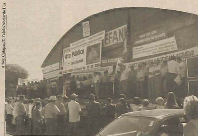
O ato de protesto culminou com uma "Carta Aberta"

ora é omissa, ora é tendenciosa e nada faz em favor da paz e da tranquilidade. Ao contrário, sua atuação, além de meramente reativa, é marcada pela influência de ONGs patrocinadas por organismos internacionais. Há muitos anos as comunidades rurais vêm sendo aterrorizadas pela Funai com invasões e expropriações para criação de novas terras indígenas ou decorrentes da ampliação das já existentes. Lamentavelmente, a Funai faz uma interpretação própria da legislação, além de não ter isenção na questão dos conflitos entre produtores e índios".