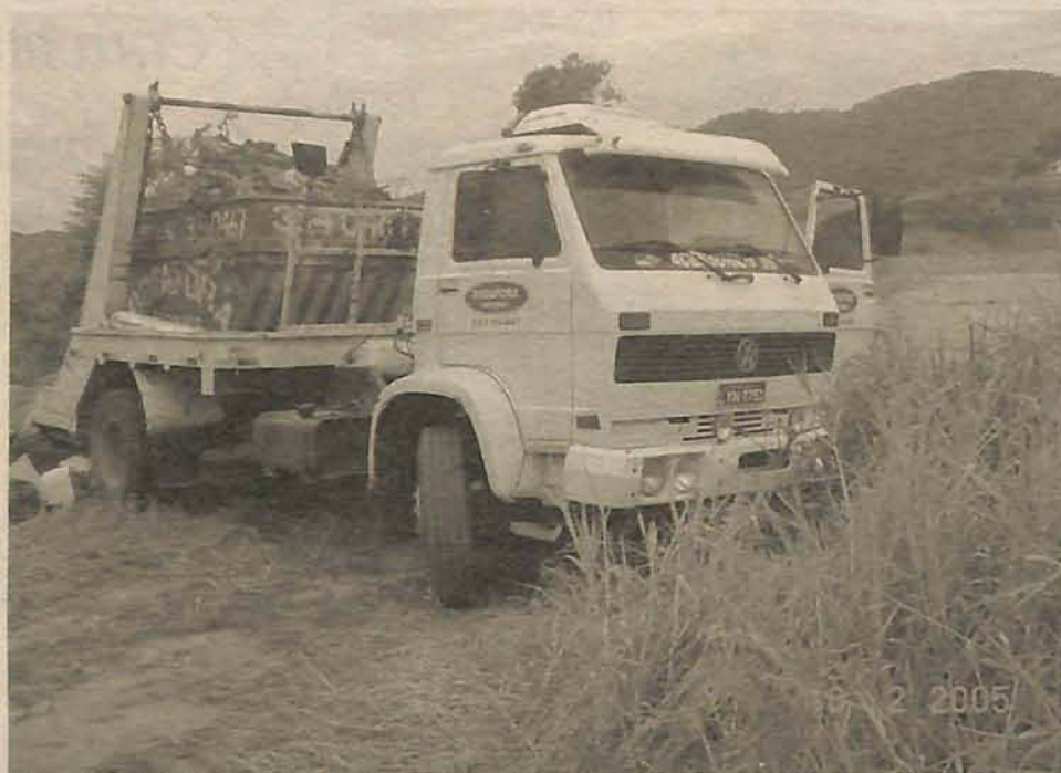
Proprietário não havia permitido o depósito, realizado por uma empresa de Blumenau