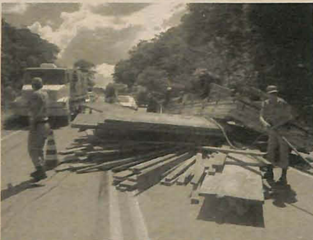
Motorista ficou preso nas ferragens, mas teve ferimentos leves

Um caminhão que carregava madeira tombou na BR-470, próximo à entrada do Belchior, na tarde da última segunda-feira, 14. O acidente causou congestionamento por mais de uma hora na rodovia. O Corpo de Bombeiros e a Polícia Militar estiveram no local do acidente. Ninguém saiu ferido.