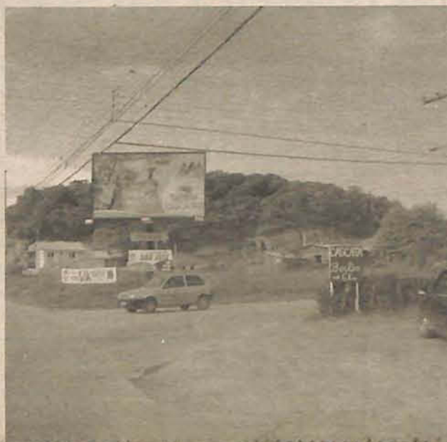
Famílias tradicionais residem neste local

No local, passa ônibus e todos os moradores têm acesso aos serviços básicos como saneamento, água, luz, telefone e entrega de correios. As famílias mais tradicionais da Cananéia são os Metter, os Reinert e os Guesser.