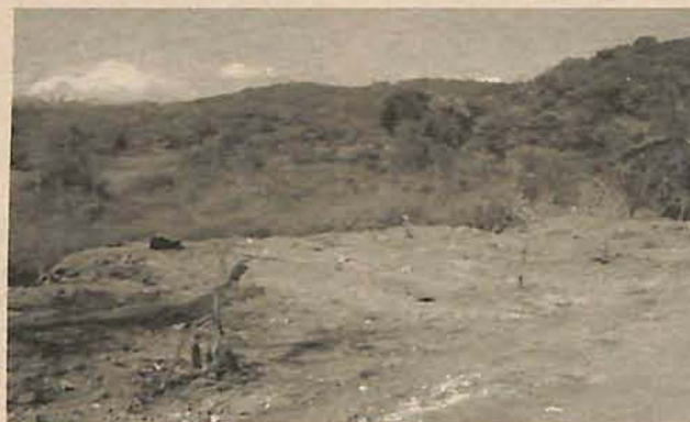
A a limpeza do local aconteceu esta semana

Segundo o fiscal, o terreno onde esta empresa estava depositando os entulhos é uma área de preservação permanente, pois passa um córrego ao lado, por isso, o limite para desmatamento ou aproveitamento do solo é de 30 metros. "Eles estão depositando os entulhos exatamente ao lado do ribeirão, isso é um crime contra a natureza e tem punição",