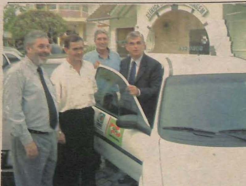
Através da parceria, secretaria da Agricultura recebeu um automóvel

zer a inspeção da Cidasc, continuará exercendo sua função na Secretaria. “Com a parceria poderemos manter a permanente vigilância no sentido de assegurar ao estado a condição de que o gado em Gaspar está livres da febre aftosa”, destacou o secretário.