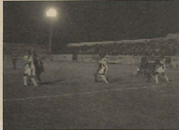
Equipe de Itajaí segue na briga pela classificação

O Marcílio Dias conquistou nesta quarta-feira, dia 16, sua primeira vitória em casa neste Campeonato Catarinense 2005, diante do Metropolitano, por 2 a 1. Com o resultado, o Marinheiro assume a vice-liderança isolada do grupo B, com 12 pontos ganhos - três a menos que o líder Joinville, próximo adversário do Marcílio. Mais uma vez o Marcílio começou a partida pressionando o adversário, principalmente em jogadas do estreante Paranhos no ataque. Logo aos nove minutos o árbitro Luis Henrique da Silva deixou de dar um pênalti para o Marcílio Dias, quando o zagueiro Cris cortou a bola com a mão na grande área.