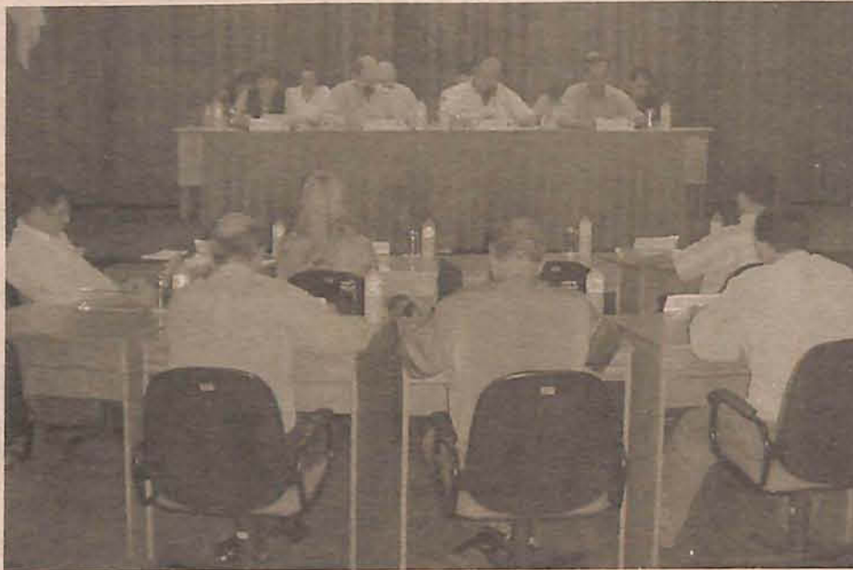
Indicação de vereador deve causar polêmica na Câmara

Cooperação Técnica entre o Arquivo Histórico Documental Leopoldo Jorge T. Schmalz e Biblioteca Pública de Santa Catarina