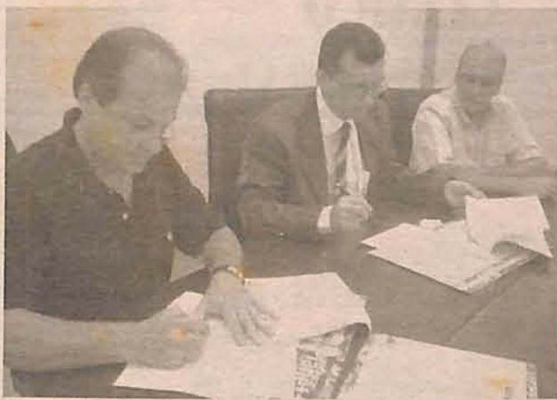
Bunge investirá R$2,5 milhões no CDA

O CDA é um dos maiores empreendimentos para preservação do meio ambiente no Vale do Itajaí, realizado com recursos privados. O Centro é uma iniciativa da Bunge Alimentos e está sendo construído junto a Associação de Lazer da Bunge, no Poço Grande. A Bunge está investindo cerca de R$ 2,5 milhões com a criação do CDA, e o convênio com a Furb viabilizará o apoio técnico