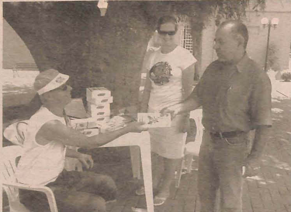
Campanha de prevenção a Aids tem a parceria do governo do estado

A campanha teve início na terça-feira, 1. No decorrer da semana, a equipe distribuiu material informativo e preservativos nos semáforos da cidade, na praça Getúlio Vargas, no comércio Central e em bares e casas noturnas da cidade. Faixas com dizeres de prevenção também foram espalhadas pela cidade.