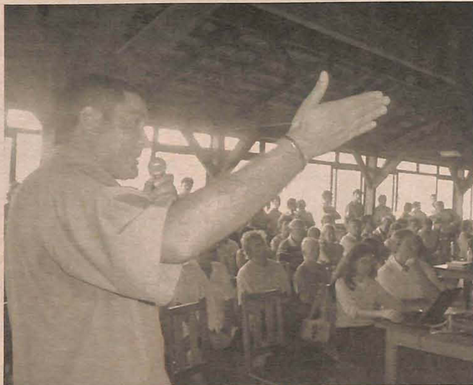
Empresário mostra aos moradores a legalidade e projeto da empresa

A Preserve Ambiental adquiriu uma área de seis hectares no bairro Belchior Baixo e pretende gerar 20 empregos no