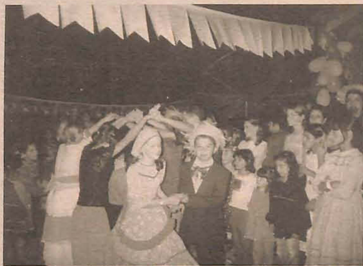
Atividades culturais também fazem parte do programa

Em novembro do ano passado, iniciou o repasse financeiro do Ministério do Desenvolvimento Social e Combate à Fome através do Fundo Nacional de Assistência Social ao município, mas como os trabalhos não foram executados