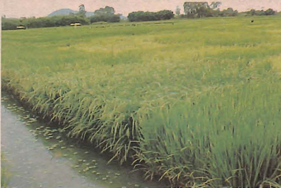
Assistência dada aos produtores garante a boa safra e venda do produto

A empresa trabalha com um atendimento personalizado ao produtor rural; para tal, está funcionando em dois turnos, inclusive aos finais de semana e feriados. “Estamos trabalhando arduamente para agilizar todo o processo de descarga de caminhões vindo de qualquer município da região de maneira a não prejudicar o produtor rural quan-