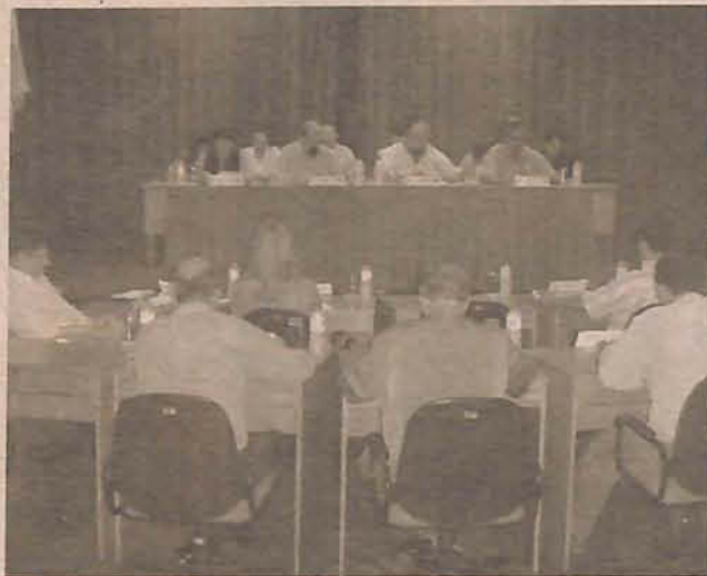
Reforma no plenário não agradou o público