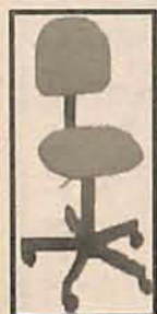
Cadeira Giratória tecido digitador