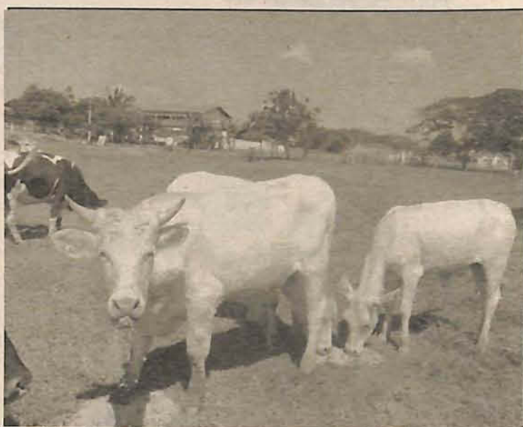
Espécies são boa alternativa para pastagens de gado

Uma nova espécie para pastejo, para Santa Catarina, grama missionária gigante ( Axonopus catarinensis ) também foi introduzida no canteiro. Gramínea perene de ve-