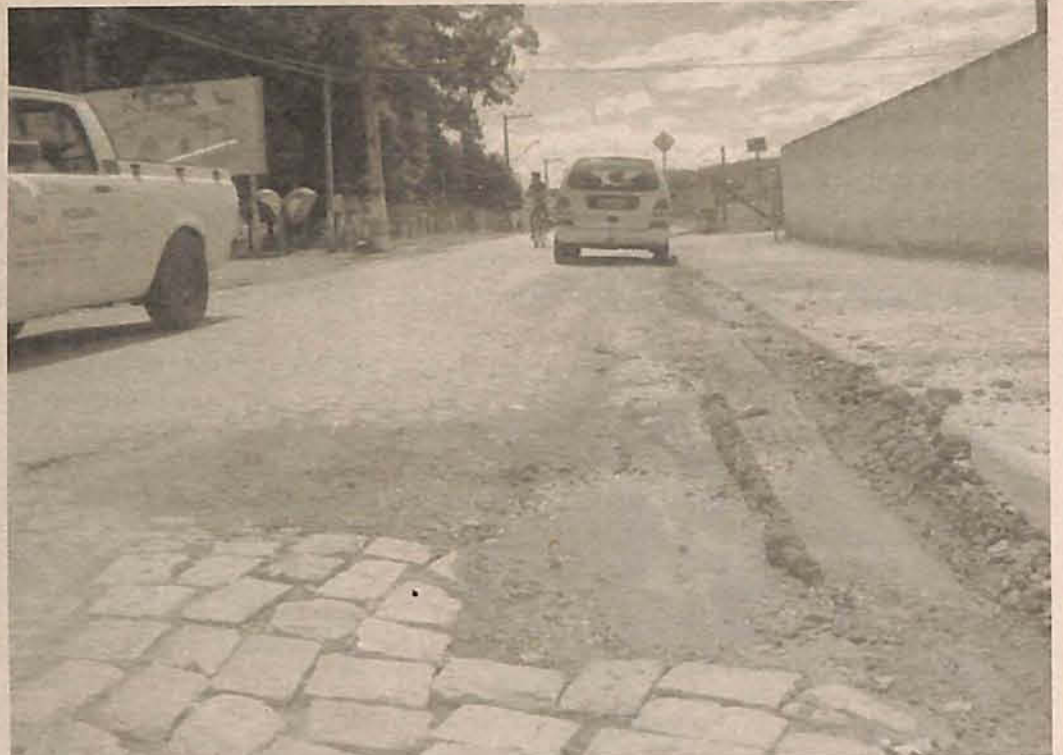
Descaso deixou ruas do Bela Vista em situação lamentável para o tráfego

garante que obteve boas indicações de que os reparos serão feitos em breve, melhorando as condições de trafegabilidade e de segurança do local.