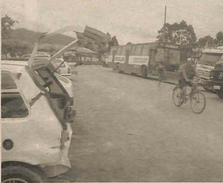
Veículos sem condições ficaram expostos no centro da cidade

havia nenhuma condição de trabalho”, desabafou o prefeito que pede paciên-