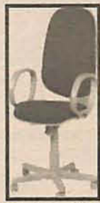
Cadeira em tecido Tipo Presidente