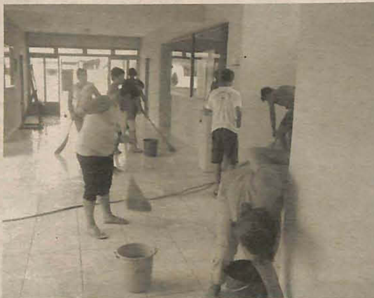
Grupo de voluntárias realizou a limpeza do prédio da prefeitura

Na terça-feira, 3, um grupo de cerca de dez mulheres voluntárias fez uma operação limpeza. Com lava-jato, vassouras, rodos e escovão lavaram a prefeitura da 8h da manhã até às 17h. “Não