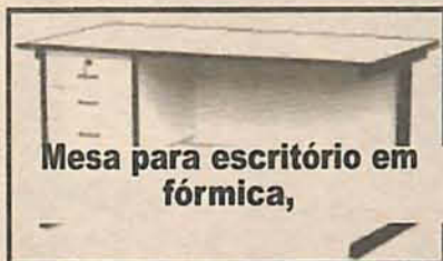
Mesa para escritório em fórmica,

Mesa para Escritório em fórmica, bege ou cinza. Medindo 120 x 60 com 2 gavetas com chave