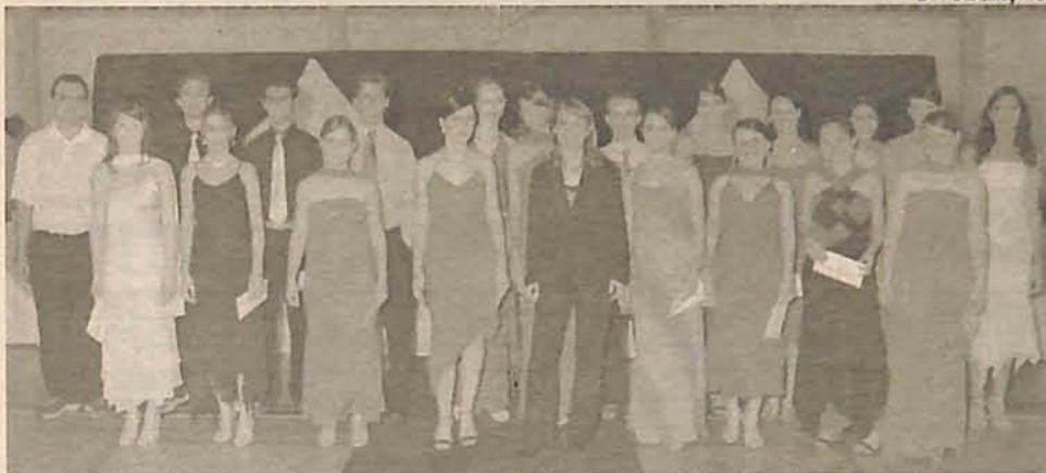
A turma de formandos do 2º Grau do Colégio Frei Godofredo que se formou no mês de dezembro/04.