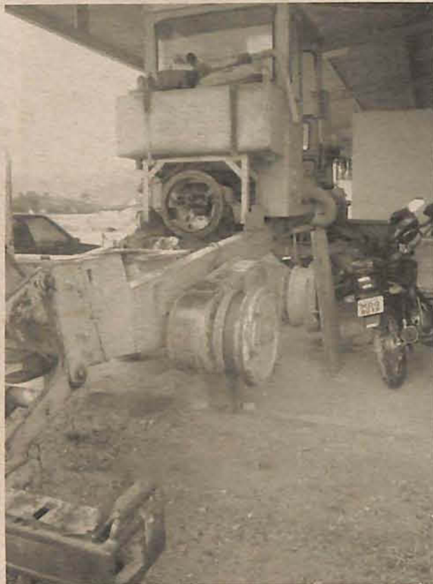
Patrulas estão sem peças para reposição e manutenção