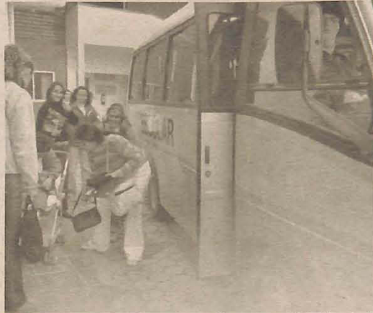
Na Apae, recursos complementarão verba para aquisição do veículo

Em 2004, a Bunge Alimentos concentrou grande parte das suas doações em Gaspar, com o objetivo de comprar a nova sede da Casa Lar, a qual abriga crianças com problemas de integração familiar. Naquele ano, foram destinados R$180 mil para o Fundo da Infância e Adolescência, dos quais R$165 mil serviram para a compra do novo imóvel da Casa Lar. No mesmo ano, o Hospital Perpétuo Socor-