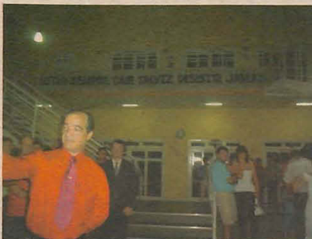
Zuchi deixa a Prefeitura de cabeça erguida e a sensação de dever cumprido