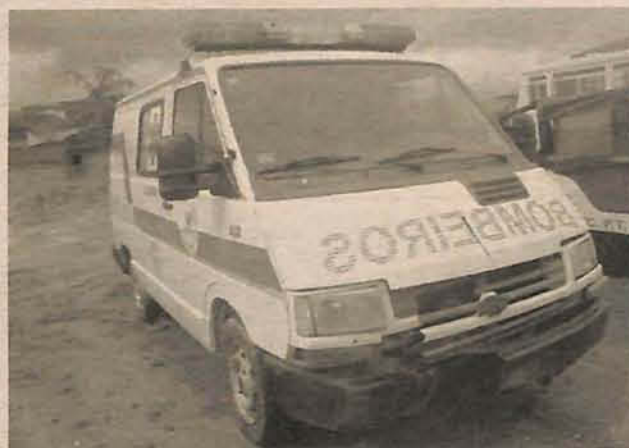
Vários veículos não têm condições de trafegabilidade