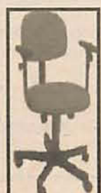
Cadeira Digitador em tecido