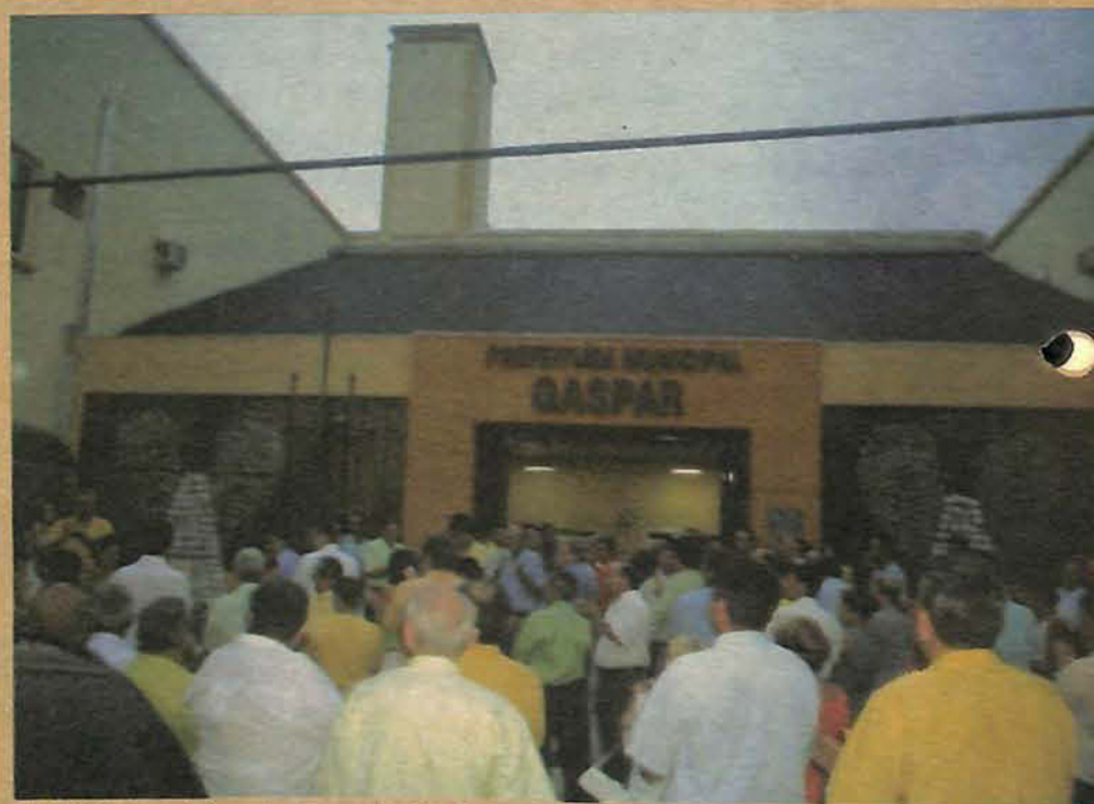
Multidão participa da transmissão do cargo na Prefeitura