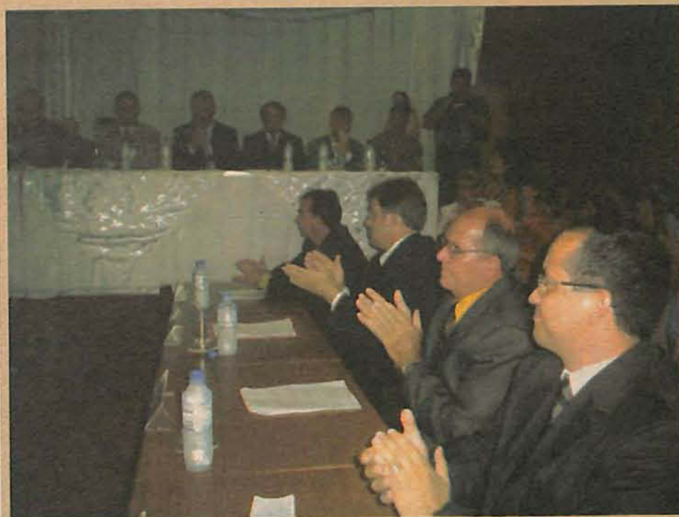
Os dez vereadores tomam posse na Câmara