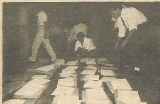
Urnas foram entregues no ginásio sem problemas