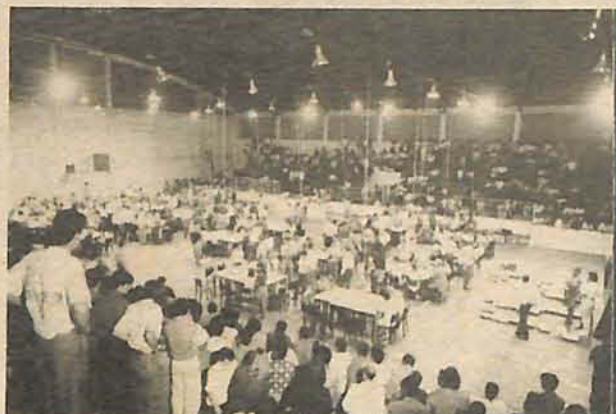
Grande público acompanha a apuração dos votos