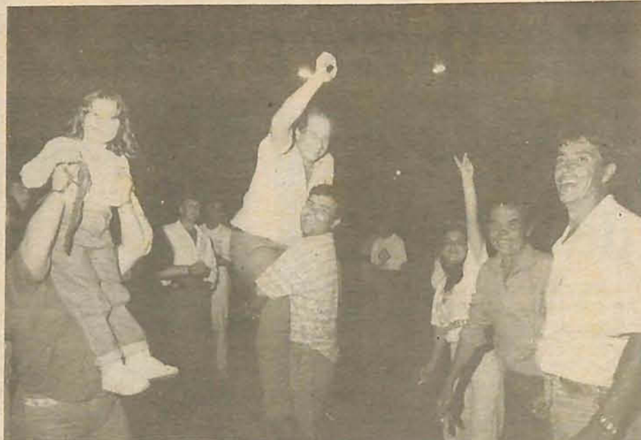
Hércules é levantado pelos eleitores