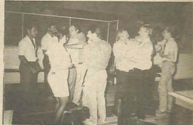
Depois da tensão, amigos festejam com candidato