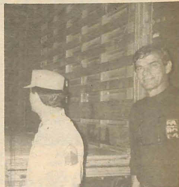
PM checou caminhões suspeitos no Bela Vista