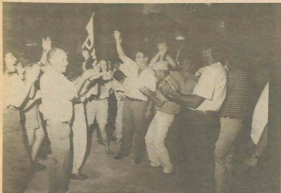
PMDB de Ilhota vibra no ginásio de esportes