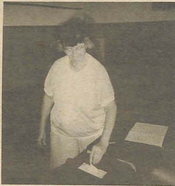
Comunidade votou tranquila; a maioria pela manhã

Na noite de sexta para sábado, os policiais chamados para averiguar uma denúncia de distribuição de sacolões de alimentos no bairro Bela Vista em troca de dividendos eleitorais. "Alguns caminhões suspeitos foram checados pela PM, mas esta denúncia também não se confirmou", disse o tenente.