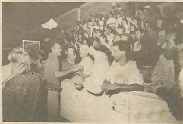
Eleitores acudiram em massa ao ginásio