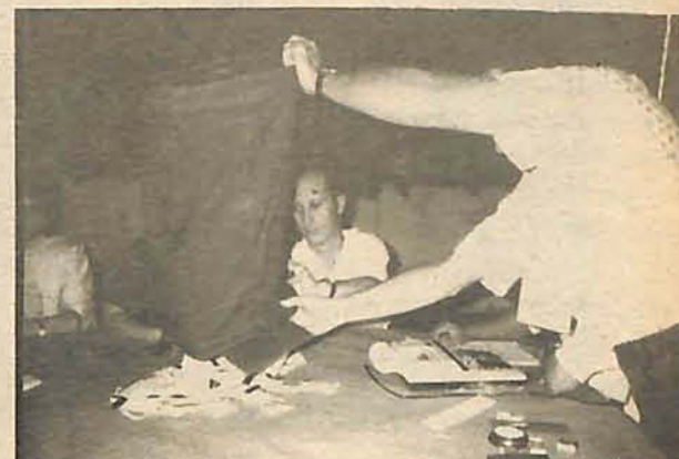
20 mesas foram abertas para realizar apuração

VIAÇÃO VERDE VALE A EMPRESA DA INTEGRAÇÃO