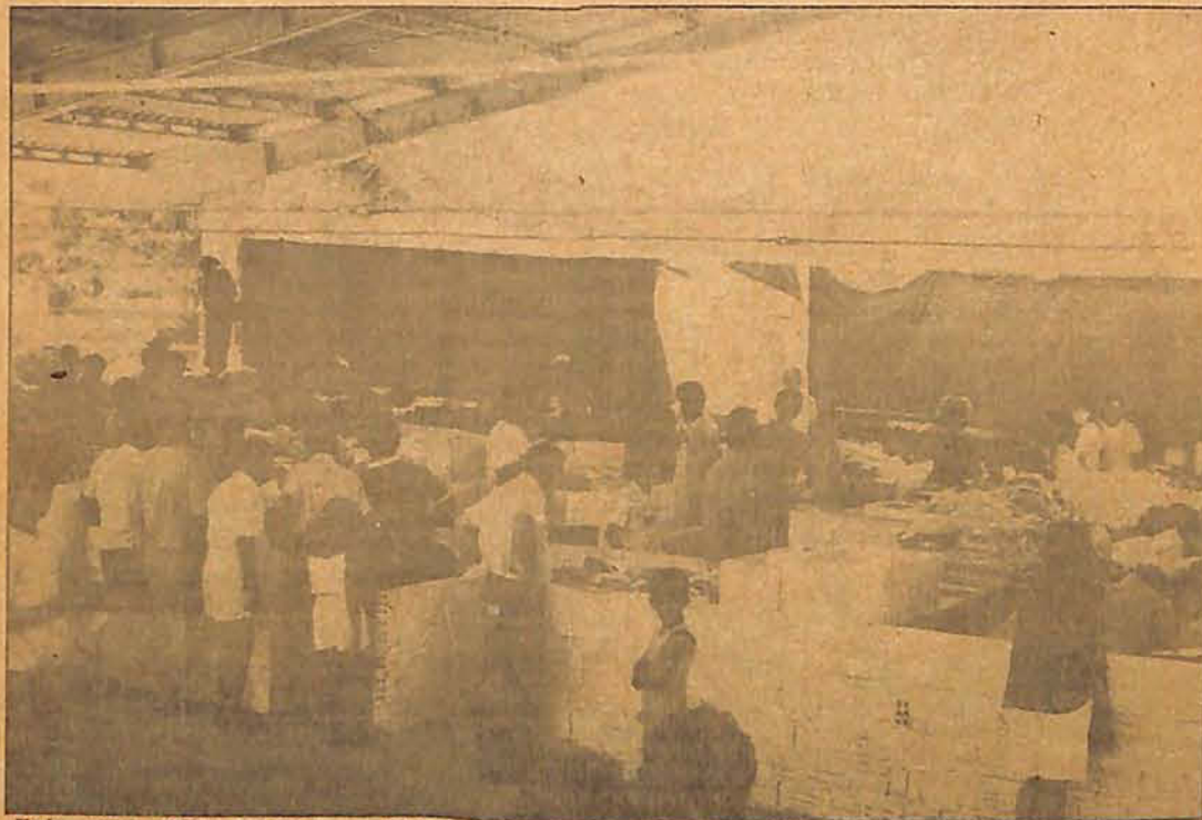
Falta espaço físico dentro do pavilhão que é muito alto e desabrigado da chuva, do sol e dos ventos

Os feirantes apontam várias falhas que certamente serão corrigidas logo pela prefeitura: falta espaço físico; o pavilhão é alto e não possui nenhum abrigo contra o sol e a chuva; os boxes são mal divididos exigindo grande esforço dos feirantes e desconforto para os fregueses da feira