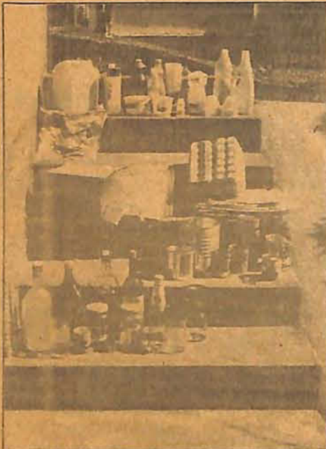
O projeto consiste em seleção e reciclagem do lixo encontrado para venda, separando o lixo seco, como na foto: plástico, papel, metais, vidros.

GASPAR — Com o objetivo de aperfeiçoar sistemas e alcançar altos níveis de qualidade de vida na cidade, a prefeitura de Curitiba vem implantando projetos que se caracterizam pela praticidade de seu conteúdo e pela rapidez no alcance de resultados que venham ao encontro das necessidades atuais do País. Sem o vultuosismo de grandes projetos que envolvem estruturas burocráticas complexas e demandam altos custos financeiros, a administração municipal implantou o projeto "O lixo que não é lixo". Iniciativa esta que vem elevando a Capital paranaense à posição de Capital Lógica do Brasil, vindo de exemplo para outras cidades brasileiras.