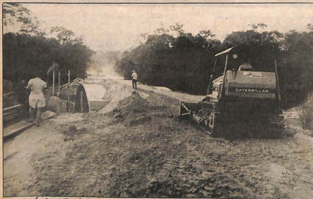
Segundo túnel metálico de Brusque, liberado ao tráfego neste final de semana

BRUSQUE — Neste final de semana será liberado ao tráfego de veículos, o túnel metálico Armco, com as mesmas características do que foi montando à Margem Esquerda do Rio Itajai-Mirim, na cabeceira da ponte Arthur Schlosser construído pela Secretaria de Urbanismo e Obras Públicas na rua Luiz Morelli, bairro Dom Joaquim.