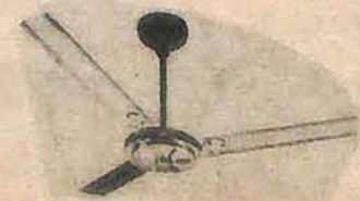
VENTILADOR PÁS DE AÇO COM REVERSÃO Preço: 10.900,00

TEMOS: BEBEDOURO VENTILADOR DE PAREDE VENTILADOR DE PEDESTAL