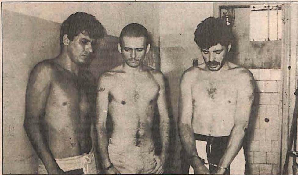
Os três foragidos, já de volta à cadeia de Gaspar

O cabo Rafael e os soldados Leonir e César, da PM de Ilhota, tiveram pouco trabalho para recapturar os foragidos, que foram encontrados na estrada de Laranjeiras, nas proximidades do município de Brusque. Após escaparem da cadeia pública, usando uma serra de aço, com a qual fizeram um buraco na porta do cubículo onde estavam, os detentos conseguiram uma