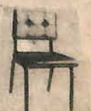
CADEIRA FIXA ESTOFADO MOD. 130-01 Marca Estil. Preço: 3.000,00