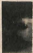
CADEIRA GIRATÓRIA, EM TECIDO diversas cores Preço: 10.000,00