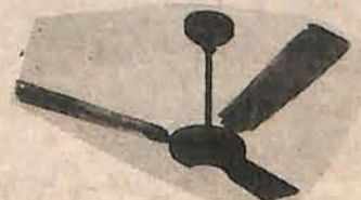
VENTILADOR DE TETO C/PÁS DE MADEIRA. LUSTRE E CONTROLE DE VELOCIDADE Preço: 17.000,00