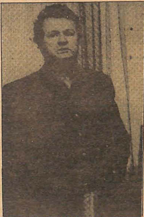
Prefeito Francisco Hostins de Gaspar

Mesmo assim, o relatório da Secretaria de Obras vem recheado de novas melhorias para o município, como: instalação de 1.572 tubos, ampliando a rede de abastecimento de água de Gaspar em quase 1,6 quilômetro; construção de 12 travessas de vala em estradas rurais, com tubos de bueiros com bitolas variando entre 1 e 1,5 metro de bitola; construção e inauguração de uma ponte na estrada da Carolina, em Belchior; limpeza de 4.390 metros de valas; construção de 14 novas bocas de lobo; conservação de 44 bueiros em diversos pon-