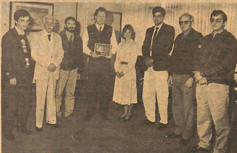
Foto da solenidade em que a Somejur entregou uma placa ao governador Casildo Maldaner que aparece ao lado dos representantes da classe de Gaspar.

Outras autoridades foram da mesma forma homenageadas, entre elas deputados e desembargadores. O desembargador