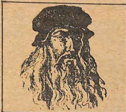
Leonardo da Vinci

A briu nesta terça-feira (11) a exposição "A Aventura do Gênio Universal", às 20 horas, na Galeria Municipal de Arte de Blumenau. "Todo o nosso conhecimento", escreveu Leonardo da Vinci, "tem origem em nossas percepções". E foi ele o primeiro a emprestar o treinamento, a imaginação e a percepção de um artista à busca do conhecimento, a que ele se referia como "o desejo natural dos homens bons. Para ele, ciência e arte eram a mesma coisa, e seu objetivo era levar a verdade, a um entendimento dos segredos do homem e do universo. Ao passar dos 20 anos, Leonardo havia se tornado famoso como pintor e escultor, músico acabado e poderoso atleta