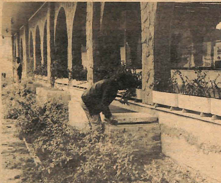
O preparo de canteiros artificiais é muito importante