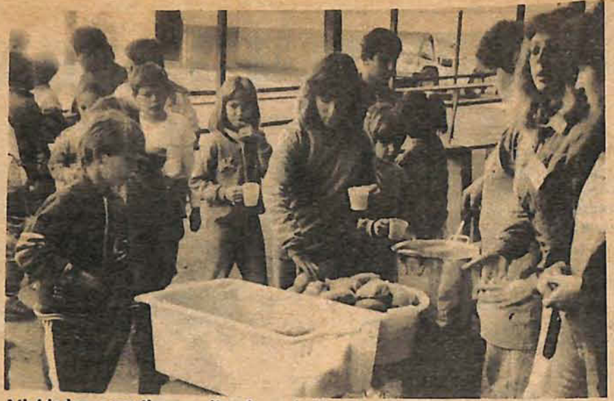
Atividades esportivas, culturais, palestras, mas...

Para alimentar as 6.300 crianças que estão participando do Projeto Recreio, a Prefeitura de Blumenau — através de uma verba da FCBIA, comprou produtos que fazem uma alimentação adequada, como arroz, feijão, carne, batata, frutas e verduras em geral, num custo de Cr$ ..... 1.500.000,00.