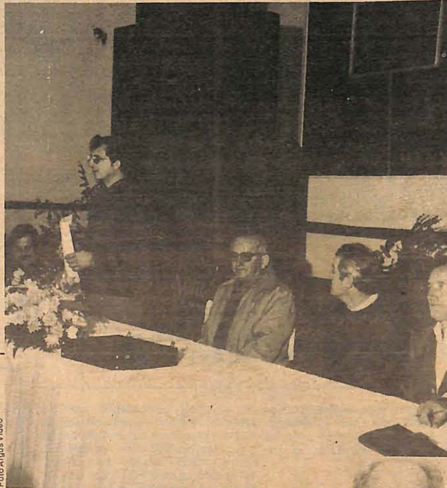
Mesa que presidia os trabalhos da reunião sindical de juizes

No último domingo, Pamplona comemorou, em Gaspar, onde está a sede do sindicato, os seis meses de fundação da entidade. Convidou os associados do in-