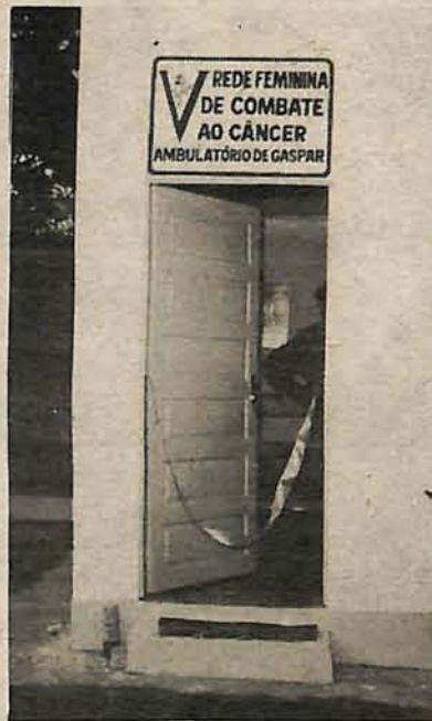
Ambulatório da Rede, em Gaspar