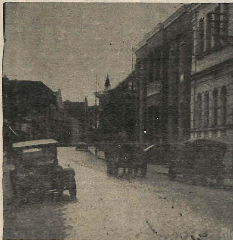
No começo dos anos 30 havia muitos carrões como estes nas ruas de Blumenau

O Blumenau Autos Veteranen Club possui 140 filiados e mais de 200 carros antigos, sendo que o mais antigo é um Fort T fabricado em 1927. O clube está coligado com o Veteran Card Club do Brasil, com sede no Rio de Janeiro e com outros idênticos da Alemanha, Estados Unidos, Uruguai e Argentina.