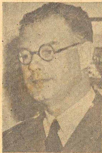
Major Brigadeiro Eduardo Gomes, glória do Brasil, a que se devotou de corpo e alma.