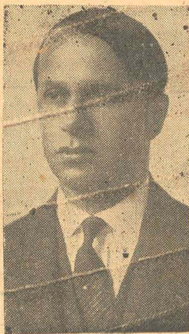
O sr. Adolfo Konder Ex-Governador de Santa Catarina, prestigioso chefe democrata.