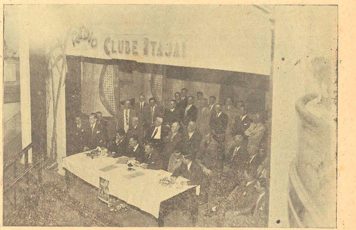
O POVO do Itajaí desde o primeiro instante colocou-se ao lado daqueles que defendem a democracia do Brasil, engrossando as fileiras da UNIAO DEMOCRATICA NACIONAL e apoiando entusiasticamente candidatura do major-brigadeiro EDUARDO GOMES. Nos flagrantes acima, de uma reunião inicial do Directorio da U. D. N. na progressista cidade do norte catarinense, vemos a mesa que dirigiu os trabalhos e a numerosa assistencia que lotou as dependencias do Cine Teatro Guarani.