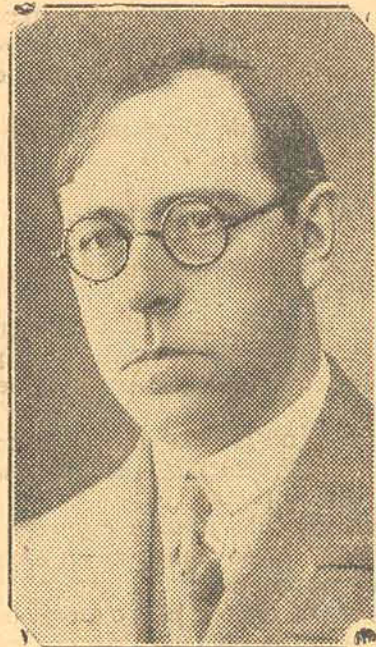
O sr. Nereu Ramos, interventor federal

O sr. Interventor Nereu Ramos recebeu o seguinte telegrama do comandante da 5ª região Militar: