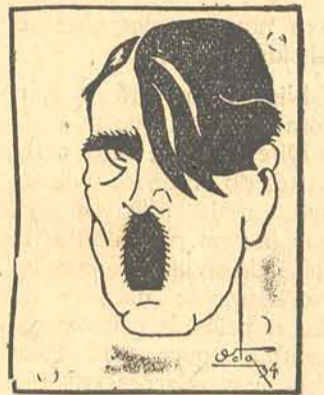
Sr. Adolfo Hitler

Segundo o mesmo jornal cada um dos anarquistas