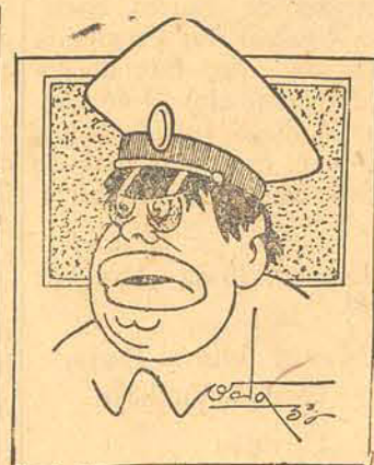
GAL. GÓIS MONTEIRO

Em verdade, cada povo deve realizar uma atividade propria e atingir um fim particular, dentro dos imperativos da evolução humana; e é precisamente esta dis-