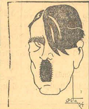
Sr. Adolfo Hitler