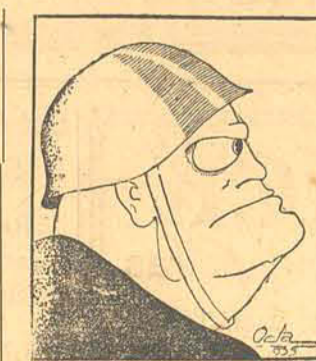
Sr. Benito Mussolini

A noite, presidirá uma reunião íntima, na qual soprará as nove velas do seu bolo de aniversário. Depois disso, segundo informou sua mãe, a sra. George Temple, Shirley irá deitar-se cedo, como sempre, pois nem mesmo nesse dia permitirá que ela fique acordada uma hora, sequer.