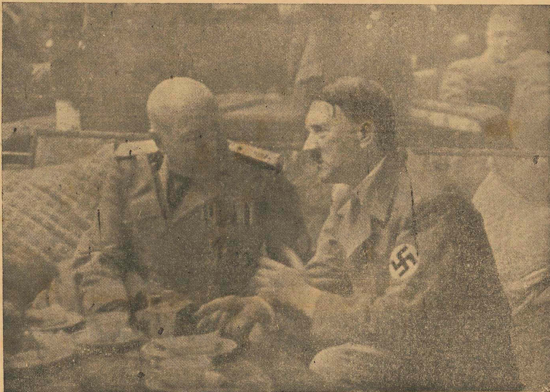
Sr. Adolfo Hitler, chefe do governo alemão, conferência, em sua residência, com o sr. Benito Mussolini