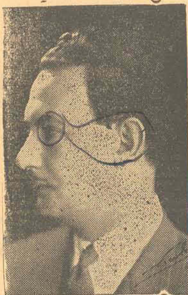
SR. FILINTO MULLER