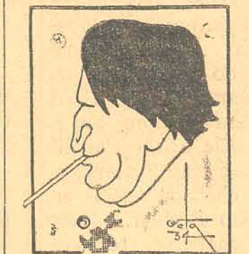
Sr. Osvaldo Aranha

tra junto ao governo central. Da bancada que apoia o sr. Nerêu Ramos, quer na Câmara, quer no Senado, saíram os dois relatores do estado-de-guerra. Isto concorreu para que o atual governante barriga-verde obtivesse, ao