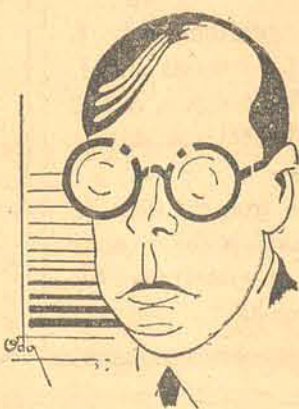
Sr. Nerêu Ramos