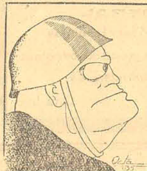
Sr. Benito Mussolini

«A palavra de ordem do décimo sexto ano facista é paz. As chamadas democracias reacionárias muito têm usado e abusado dessa palavra; mas, quando ela sai dos nossos lábios, dos lábios daqueles que combateram e estão prontos para combater outra vez, adquire uma significação verdadeira, solene, original e humana».