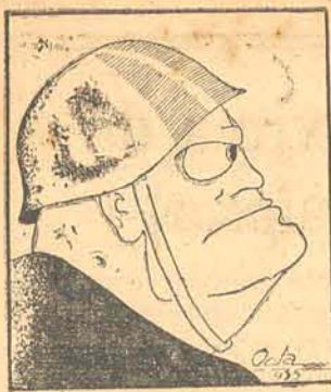
Sr. Benito Mussolini

O Fuehrer, convidado pelo sr. Mussolini, visitará a Italia o mais breve possível PARIS, 28. — O jornal EXCELSIOR informa de boa fonte, que o sr. Benito Mussolini convidou o sr. Adolf Hitler a visitar a Italia o mais breve possível e que o Fuehrer aceitou o convite.