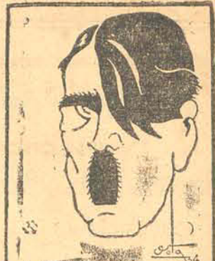
Sr. Adolf Hitler

O Fuehrer, convidado pelo sr. Mussolini, visitará a Italia o mais breve possível PARIS, 28. — O jornal EXCELSIOR informa de boa fonte, que o sr. Benito Mussolini convidou o sr. Adolf Hitler a visitar a Italia o mais breve possível e que o Fuehrer aceitou o convite.