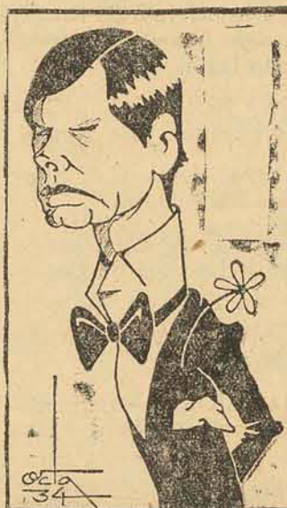
Sr. Adolfo Konder

A pedido do Presidente Artur Bernardes, fui a S. Paulo tentar a acomodação do P. C. com o P. R. P. Nada conseguí. Nem os constitucionalistas admitiam