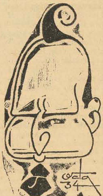
Sr. Getulio Vargas

ram ultimamente no cenário politico do Estado e da Republica — afim de que, assim de tudo informados, possam decidir com acôrto.