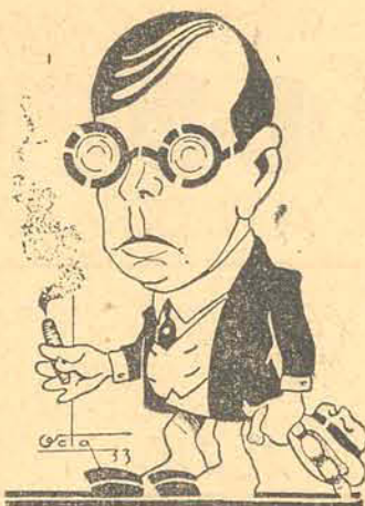
Sr. Nerêu Ramos