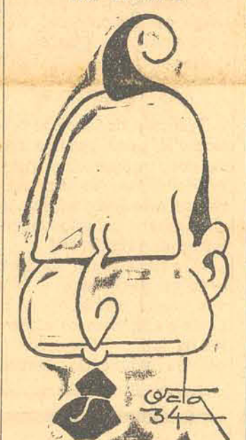
Sr. Getúlio Vargas

RIO, 4. — Estamos seguramente informados, de que o sr. Osvaldo Aranha manteve, ontem, prolongada conferência telefonica com o sr. Getúlio Vargas, que se acha em Poços de Caldas.