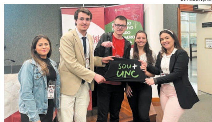
Estudantes de Direito que participaram do estágio