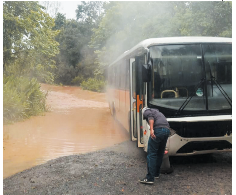
Ônibus escolar passando por estrada alagada em Papanduva