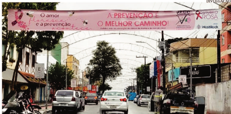
Faixa da campanha na rua Francisco de Paula Pereira

Mais informações pelo WhatsApp: 3622 2310.