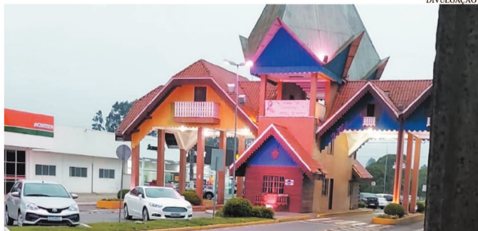
Portal de Canoinhas decorado para o Outubro Rosa