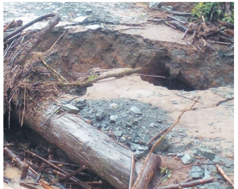
Estrada da zona rural de Papanduva desmoronou com as chuvas