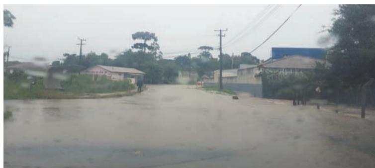
Bairro Piedade, em Canoinhas