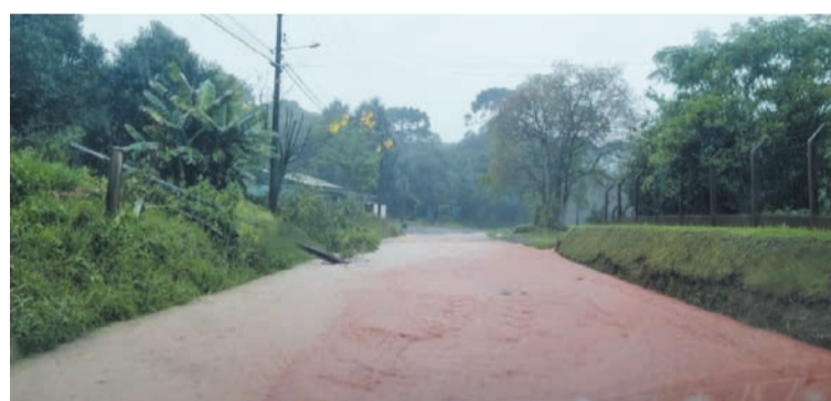
Estrada alagada no interior de Canoinhas

Barra Grande e Canoinhas. Deste total, 61 pessoas estão divididas nos dois abrigos municipais que são os ginásios de esportes Ione Cyríaco de Souza e da escola estadual Frei Menandro Kamps, no distrito de São Cristóvão. As demais foram levadas para casas de parentes e/ou amigos.