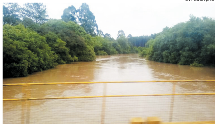
Ponte sobre o Rio Canoinhas, na divisa entre Canoinhas e Três Barras

A secretaria da Defesa Civil informou no início desta semana, que há 141 pessoas desalojadas em Três Barras devido às inundações provocadas pelos três rios que banham o município: Negro,