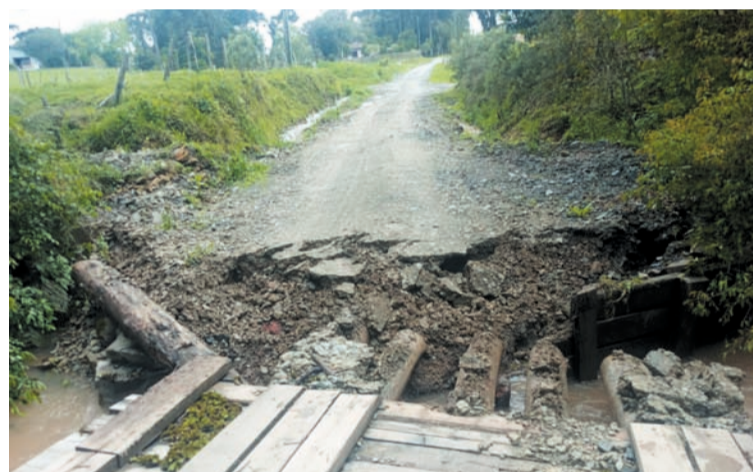
Ponte dos Schipitoski entre as localidades de Rio Bonito e Gralha, em Bela Vista do Toldo