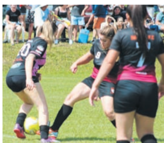
Competição teve três categorias e atraiu grande público para as finais

forma: o título na categoria feminina foi para o Império FC, na categoria de veteranos o Guarani sagrou-se campeão ganhando nos agregados, e na categoria principal, o Atlético Pinhal levou para casa o título de campeão, o mesmo já havia vencido fora de casa.