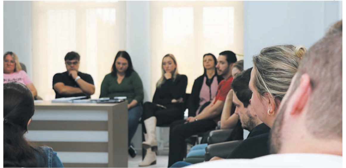
Reunião aconteceu nas instalações do SUS central

A assessoria do município destaca ainda que o Governo do Município reitera seu empenho em garantir um acesso eficiente e abrangente aos serviços médicos, trabalhando para assegurar que cada cidadão receba o cuidado adequado quando mais precisa. “A busca constante por melhorias reflete o compromisso sólido de am-