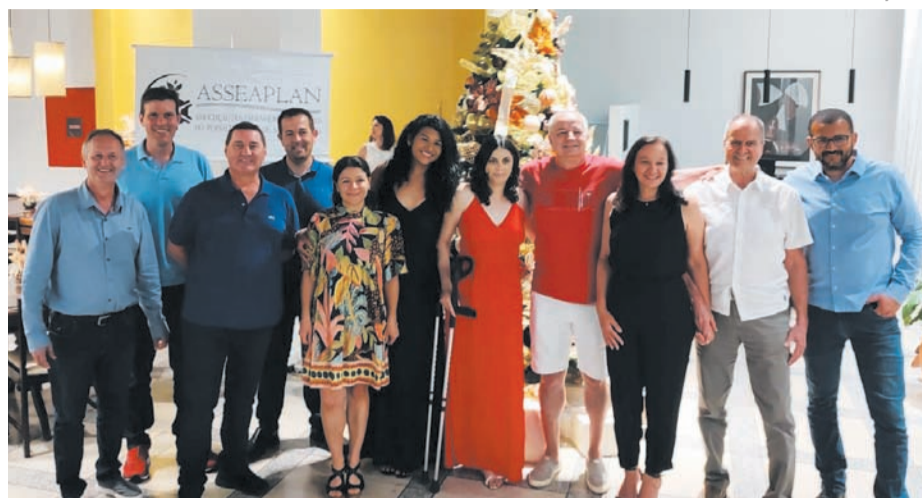
Engenheiros-agrônomos do Planalto Norte em evento comemorativo aos 10 anos da Asseaplan

Se você é um Eng o -agrônomo(a) na região ou estudante de Agronomia venha fazer parte da Asseaplan e usufrua dos benefícios de estar fortalecendo nossa classe