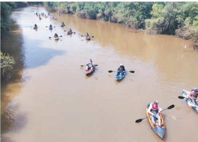
5º Encontro dos Caiaqueiros de Canoinhas, aconteceu nesse domingo dia 3/11