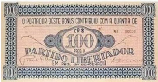
O político gaúcho Raul Pilla e a cédula que deu origem à palavra 'pila' como sinônimo de dinheiro.