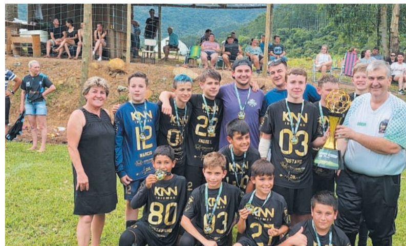
Golden sagrou-se campeão

A secretária de esportes conta que aproximadamente 150 atletas participaram da competição. “Tivemos oito equipes vindas de localidades como Rio Vermelho, Pedra Branca, Km20, São Pascoal, além dos times da cidade. Eventos como esse já tem um espaço em nossa programação anual de ativi-