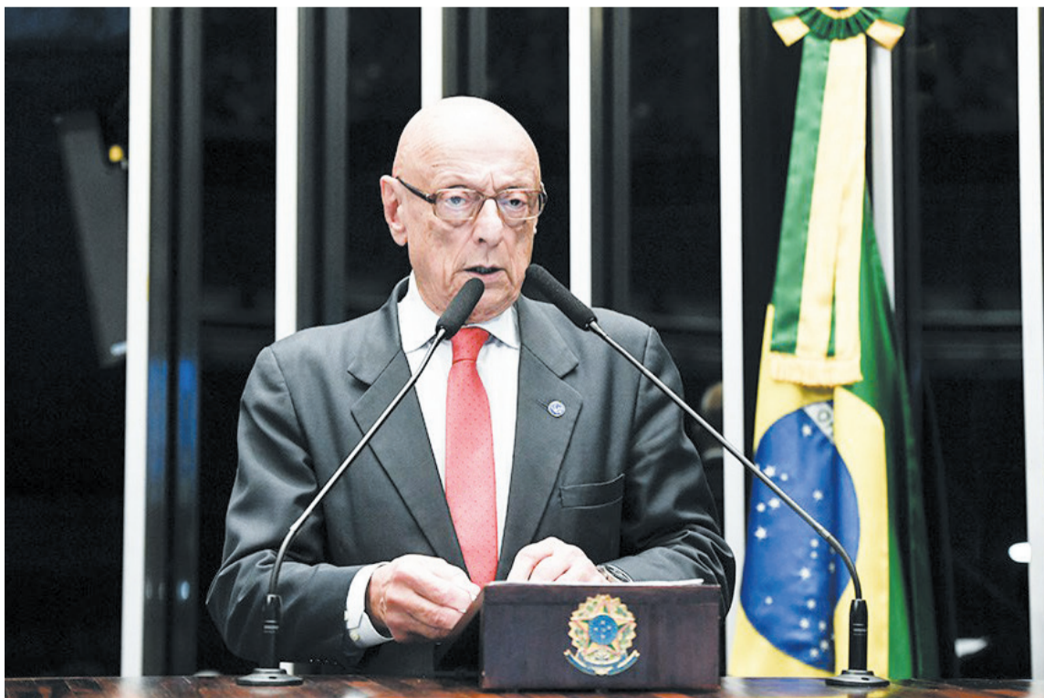
Amin no Senado