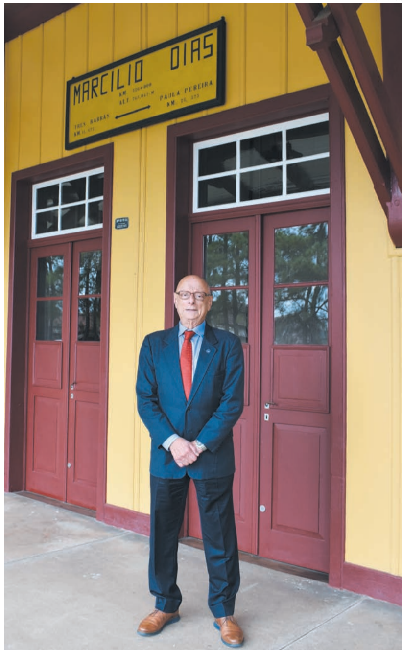
Esperidião Amin na estação de Marcílio Dias

A PEC, que acrescenta dispositivo ao artigo 5º da Constituição, estabelece que “a lei considerará crime a posse e o porte, independentemente da quantidade, de entorpecentes e drogas afins sem autorização ou em desacordo com determinação legal ou regulamentar”. Na justificativa, Pacheco ressalta que a saúde é direito de todos e dever do Estado, conforme prevê a Constituição, e destaca diversos dispositivos e normas legais que tratam da prevenção e do combate ao abuso de drogas, os quais configuram política pública essencial para a preservação da saúde dos brasileiros.