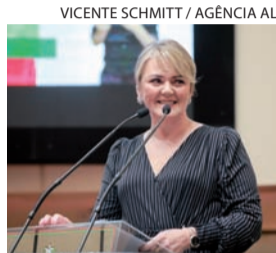
VICENTE SCHMITT / AGÊNCIA AL