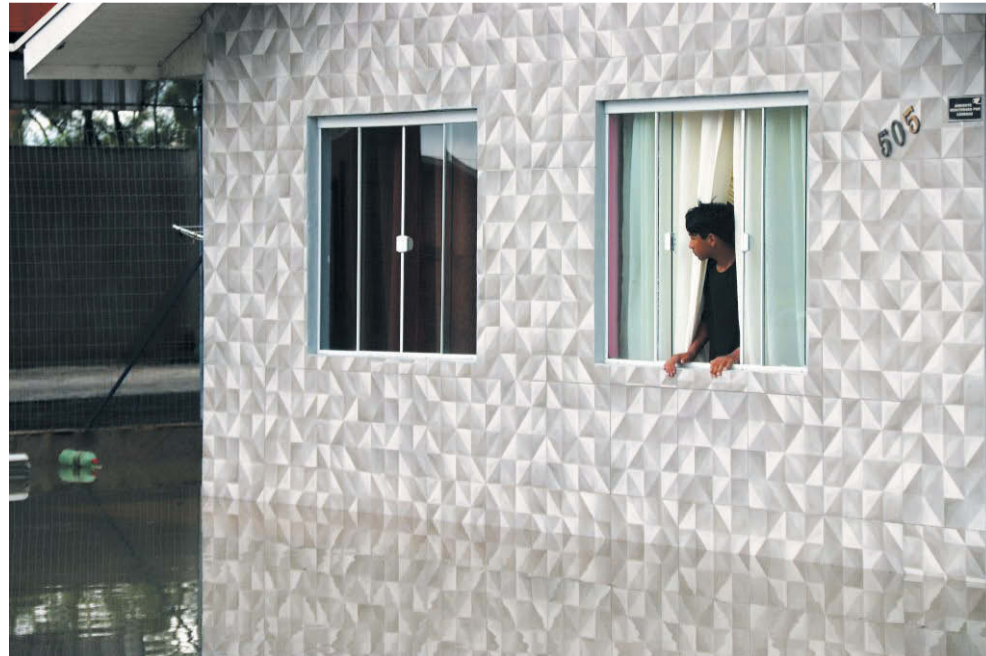
Morador olha o pátio de sua casa alagado em Canoinhas