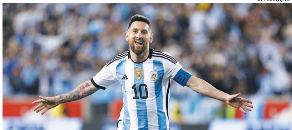
Atacante foi o principal jogador da Argentina no tricampeonato mundial

Já o prêmio feminino foi conquistado por Aitana Bonmatí, atleta do Barcelona (Espanha) que se sagrou campeã na Copa do Mundo de futebol feminino este ano.