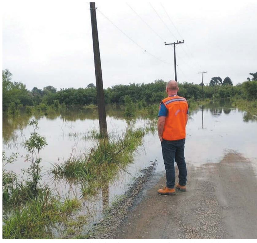
Nível das águas começando a subir em Três Barras, na primeira semana de outubro