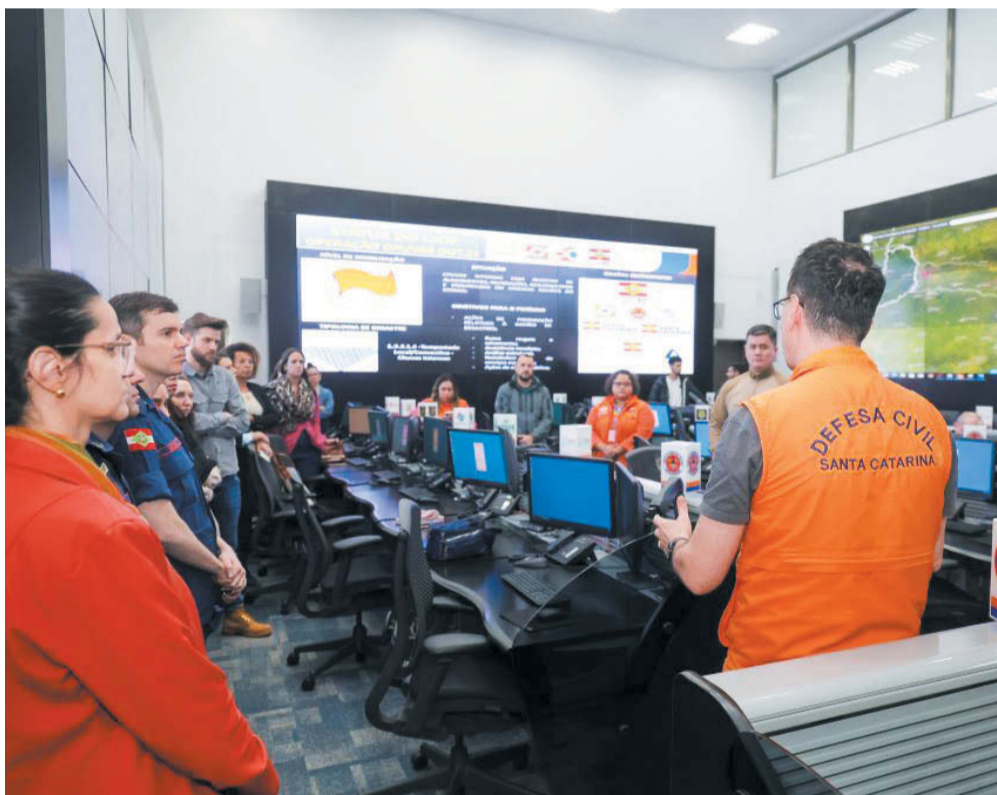
Reunião de lideranças da Defesa Civil de SC no dia 5 de outubro

tarina, divulgou que já haviam no Estado, 78 cidades com ocorrências e 31 municípios em situação de emergência. Um dia antes, o município de Papanduva havia decretado estado de emergência. Entretanto nessa época, o nível do Rio Canoinhas, que banha o Planalto Norte, estava em 4,9 metros, o que era considerado normal, entretanto, no dia 8 de outubro, um comunicado da prefeitura de Canoinhas apontava que algumas comunidades do interior já estavam sem acesso. Na mesma data, Santa Catarina tinha 120 cidades com ocorrências