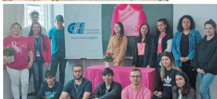
Na UVG também aconteceu um momento especial com a participação dos acadêmicos na Palestra Outubro Rosa