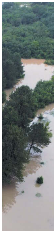
ite a enchente

O CN continua atualizando as informações sobre as enchentes através das próximas edições, e também, pelos meios digitais.