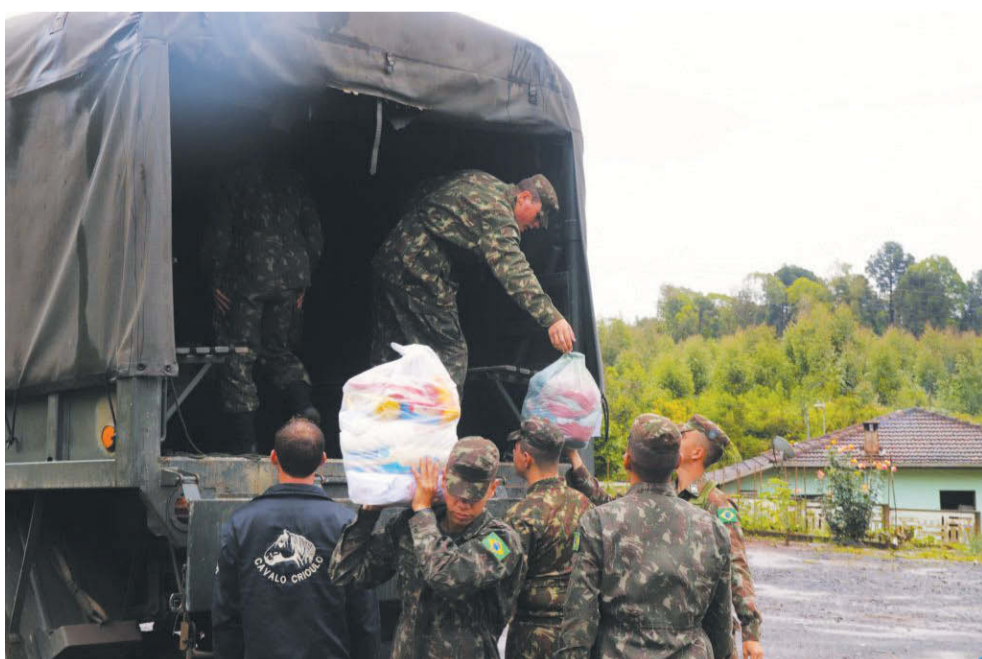
Moradores do interior de Canoinhas recebem alimentos de militares do exército