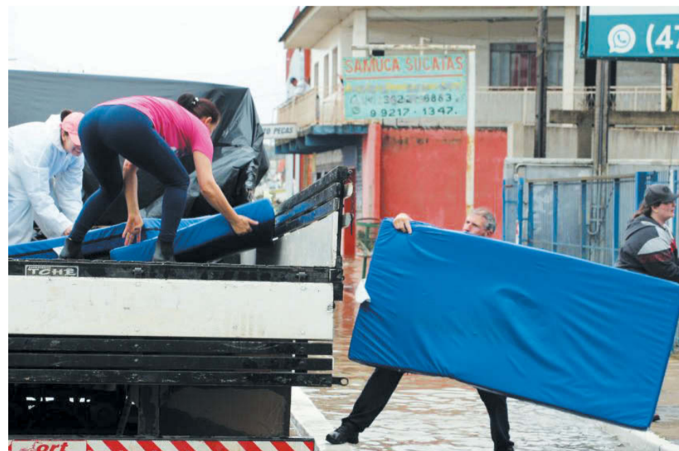
Famílias saindo de suas casas na Avenida Rubens Ribeiro, em Canoinhas