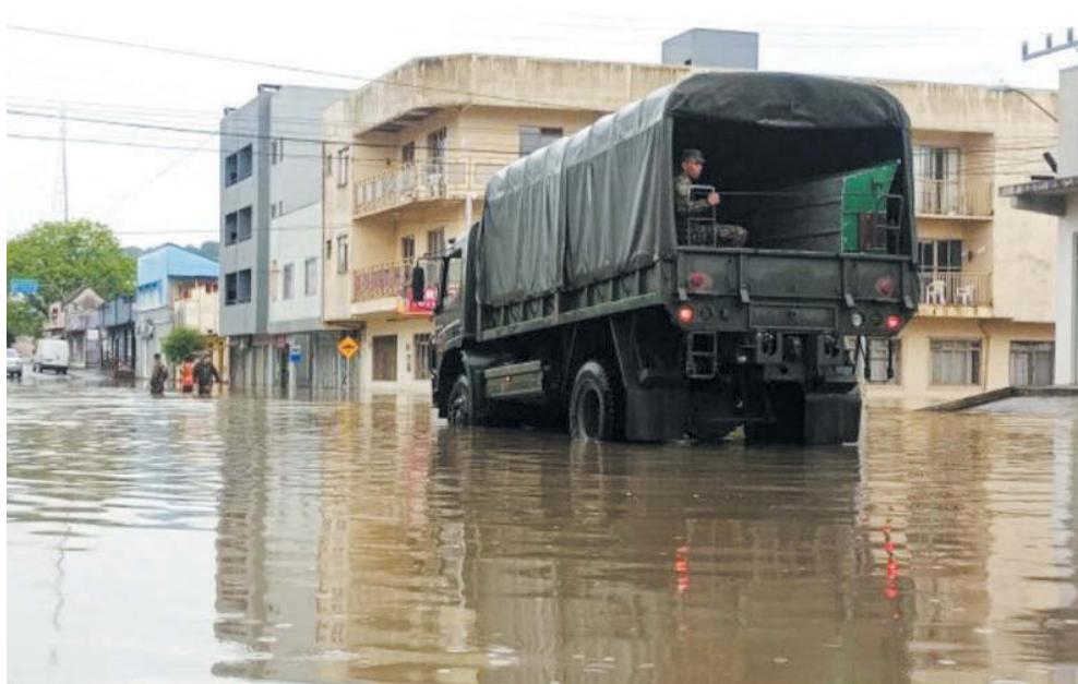
Militares do Campo de Instrução Marechal Hermes auxiliam as vítimas da enchente no centro de Canoinhas