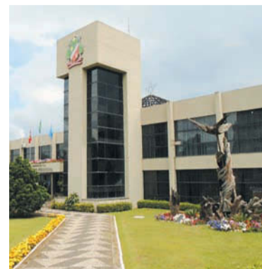
Prefeitura de Canoinhas