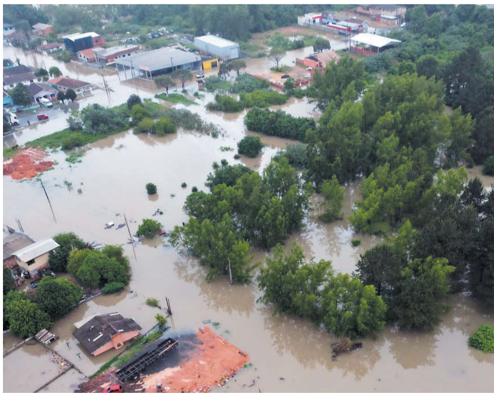
Vista aérea de Canoinhas durante as enchentes