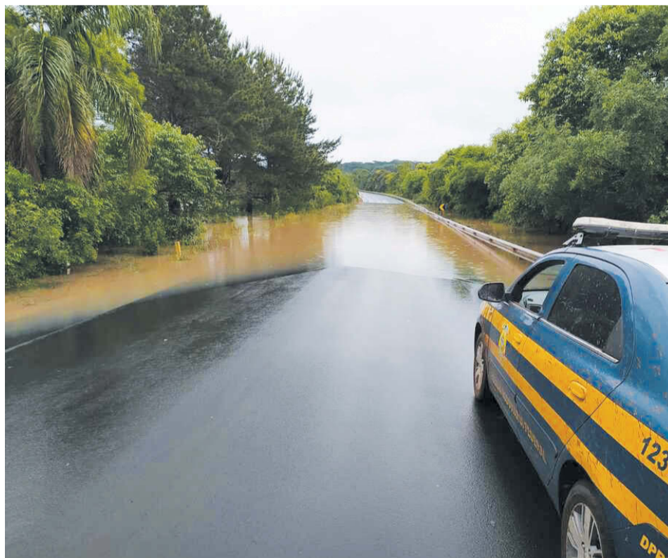
BR-280 interditada em São Pascoal, no município de Irineópolis