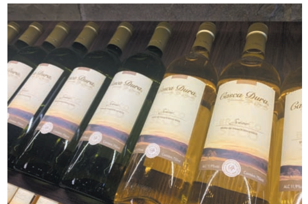
O vinho Casca Dura é um dos carros-chefe da vinícola Di Sandi

Uma uva com casca resistente e rosada, de cacho compacto, com bagas pequenas e que apresenta baixa produção nos parreirais. A descrição mais comum da uva denominada Casca Dura (ou Martha), poderia fazer com que muitos produtores passassem longe dessa cultivar e, em grande parte do país, a premissa se mostra verdadeira. – Menos em Bituruna.