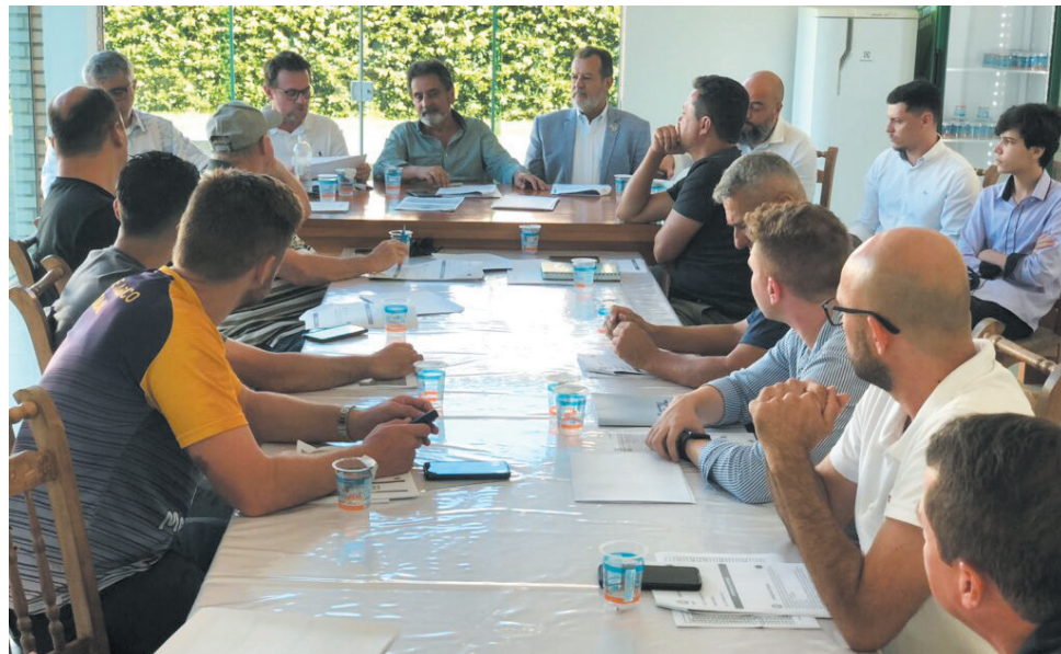
Representantes das equipes participaram do pré-conselho técnico da Série C do Catarinense

O Conselho Técnico para a disputa da base será no dia 28 de abril e do profissional no dia 31 de maio. Campeão e vice da Série C garantem vaga na Série B do Estadual em 2024. Em 2022, Santa Catarina, o campeão, e o Caçador, vice, garantiram o acesso para a Série B de 2023.