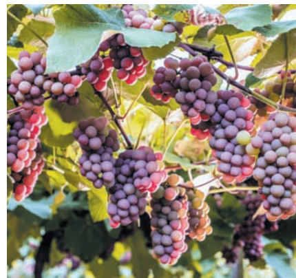
Produção da uva Casca Dura em Bituruna

A tradição da vitivinicultura foi passada de geração em geração e, hoje, Bituruna é a primeira cidade do Paraná a obter um selo de Indicação Geográfica (IG) pela produção de vinhos. A confirmação da conquista da indicação de procedência Vinhos de Bituruna veio em outubro de 2022, três anos após o início do processo no Instituto Nacional da Propriedade Industrial (INPI). - O pedido foi formalizado pela Associação dos Produtores de Uva e Vinho do Município de Bituruna (Apruvibi), entidade formada por representantes de quatro vinícolas produtoras da variedade Casca Dura no município: Sanber, Bertolletti, Di Sandi e Dell Mont. O selo contempla o vinho Bordô, além do Casca Dura.