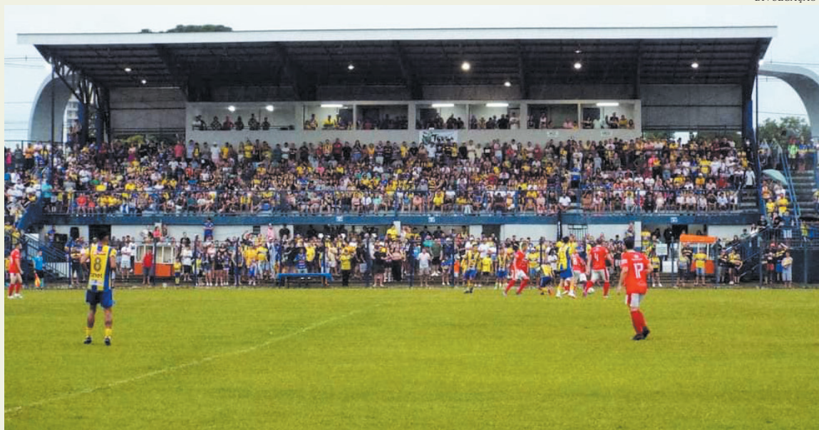
Final aconteceu em União da Vitória com estádio lotado

“A Liga Esportiva Canoinhense parabeniza a todas as 16 equipes participantes, a Diretoria da Liga e seu quadro de arbitragem, e também o patrocinador Charles Uniformes. Gostaríamos também de agradecer a imprensa que acompanhou o evento, pessoal da segurança e prestação de socorro”, publicou o perfil oficial do LEC, organizador da competição, nas redes sociais.