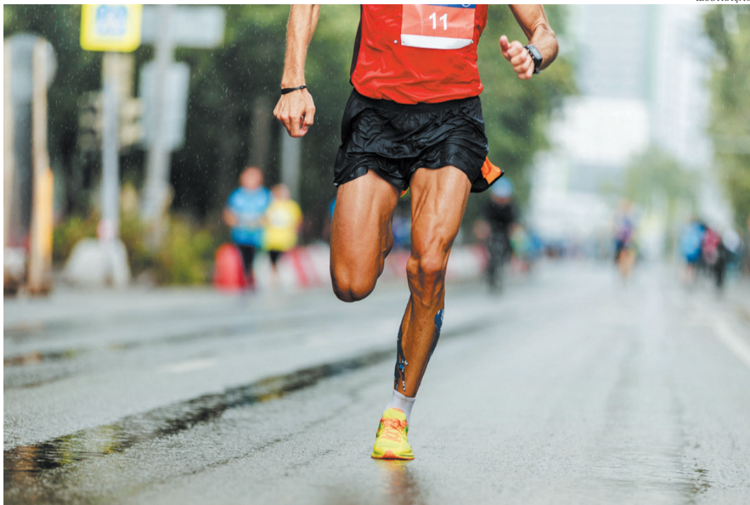
Competição reúne atletas de diversos estados

Os valores em dinheiro variam de R$ 200,00 (5º lugar) a R$ 500,00 (1º lugar) na Meia Maratona; e de R$ 100,00 (5º lugar) a R$