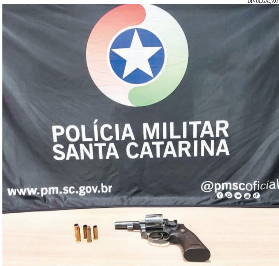
Revólver foi apreendido com o autor dos disparos

A Polícia Civil compareceu no local logo após os fatos e acompanhou a ocorrência.