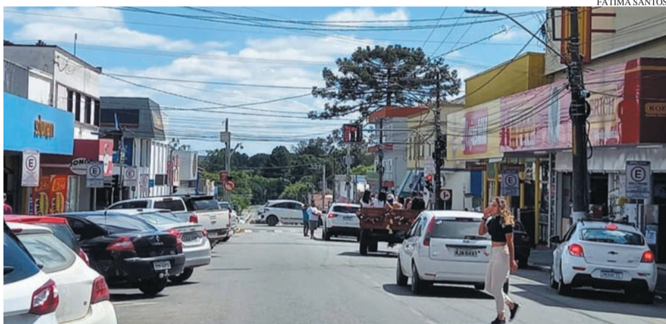
Para o comércio, expectativa é de boas vendas neste fim de ano, com perspectiva de desenvolvimento econômico permanente

O presidente ainda falou sobre os primeiros passos a serem dados no ano de 2023, para gerar resultados. “Em janeiro de 2023, passando essa avalanche política a qual estamos vivendo, queremos que as coisas se alinhem. Faremos uma reunião de diretoria para discutir projetos sérios e pontuais, os quais queremos que tragam resultados significativos, não só para o ano que vem, mas para o futuro. Defender com o escudo e a espada da Associação Empresarial nossos associados, levantando a bandeiras pró-desenvolvimento e apoiando reformas estruturais, infraestrutura, cursos, palestras, eventos, reuniões, núcleos empresariais, conselhos, lobby político etc. Também oferecemos diversas soluções para que nossos associados usufruam para que eles tornem-se mais competitivos e sintam-se muito bem representados. Assim, nossa parte é arregaçar as mangas e trabalhar em prol nossos associados e sociedade”, concluiu o presidente.