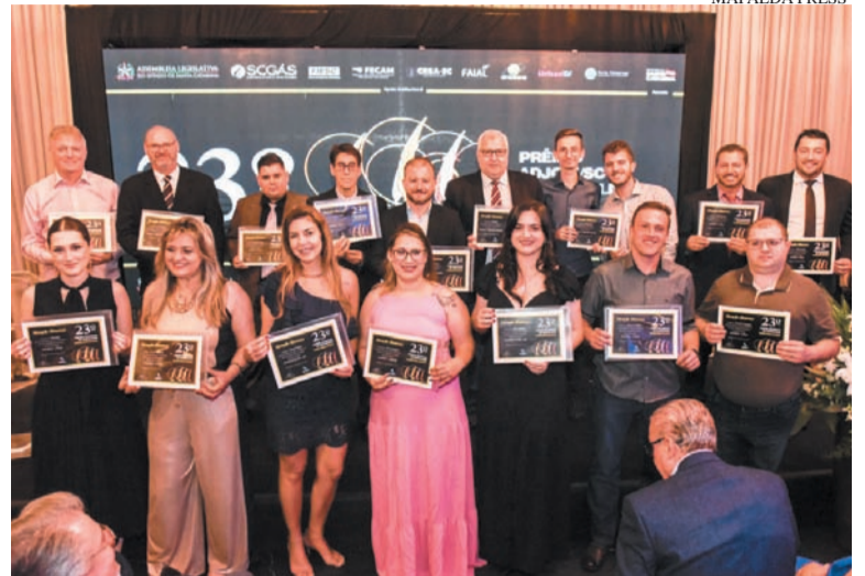
Além de integrar o top 10 das três diferentes categorias, Correio do Norte recebeu menção honrosa durante a premiação