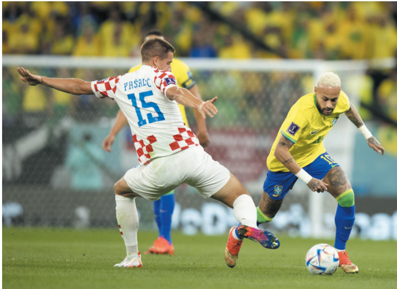
Após empate em 1 a 1 na prorrogação, Brasil foi derrotado nos pênaltis pela atual vice-campeã mundial