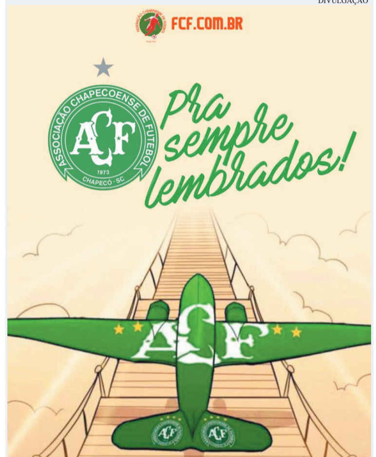
Homenagem prestada pela Federação Catarinense de Futebol