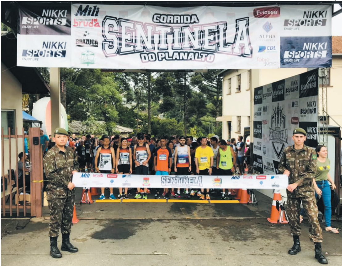
Corrida aconteceu no último final de semana