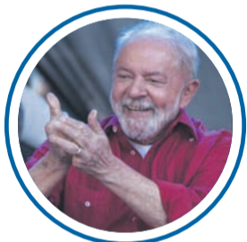
Lula (PT) Geraldo Alckmin (PSB) Nº 13