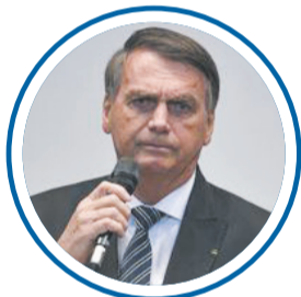
Jair Bolsonaro (PL) Vice Braga Netto (PL) Nº 22