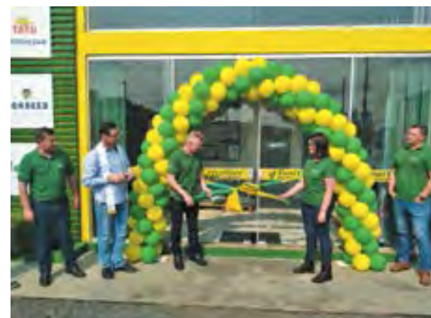
Parabéns para a equipe do Toni Cerealista, que no dia 09/09 abriu sua filial em Canoinhas. Muito sucesso nesse novo empreendimento, e que os empreendimentos prosperem cada vez mais para essa equipe séria e vencedora, que potencializa o agronegócio da região, gerando emprego e renda.