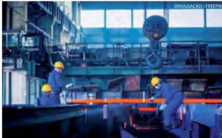
Em Santa Catarina, indústria avança acima da média nacional

Veículos - Outro indicador que demonstra o aquecimento da economia brasileira é