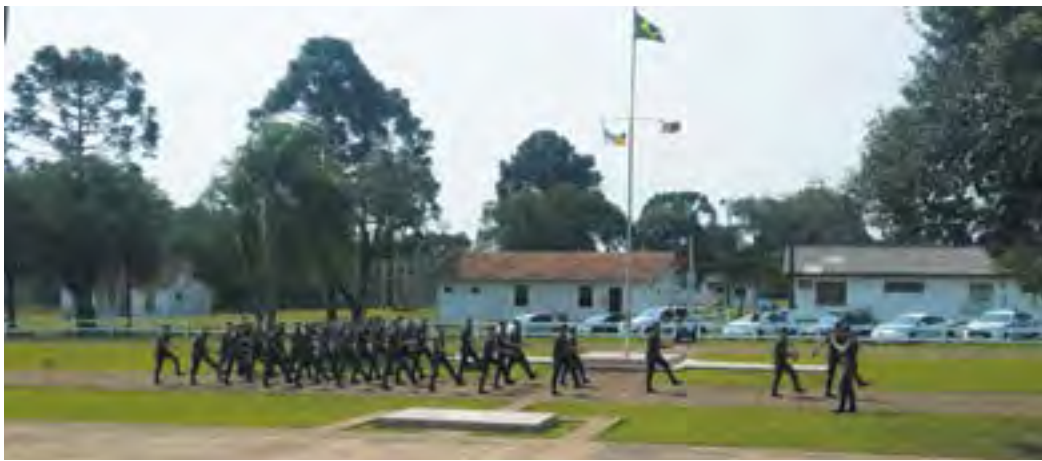
CERIMONIA DE 70 ANOS DO CAMPO DE INSTRUÇÕES MARECHAL HERMES (CIMH)