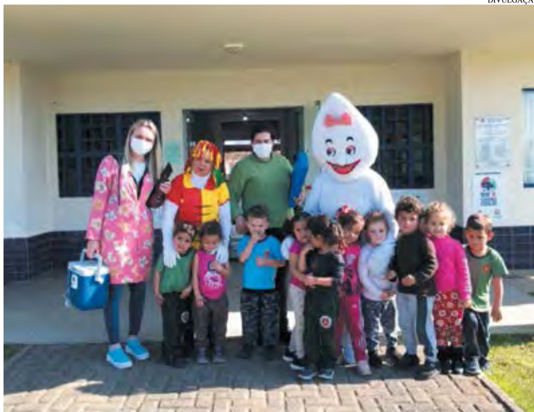
Números da vacinação foram apresentados em parcial na última sexta-feira

A campanha segue até hoje, dia 9 de setembro em todas as salas de vacina da cidade e inte-