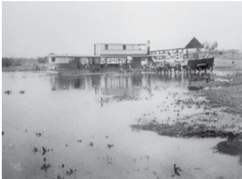
Na enchente de 1927, em registro de Curt Uhlig, embarcação não identificada atracou no porto do Canoinhas, junto a ponte coberta.