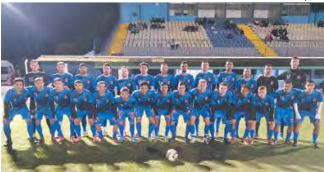
CAC disputou um amistoso diante da seleção de Canoinhas, no Ditão

A primeira rodada do Campeonato Catarinense da Série C foi concluída