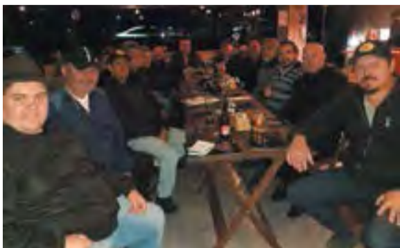
Sócios do Canoinhas Clube de Carros Antigos se reuniram no Container Burger Bar