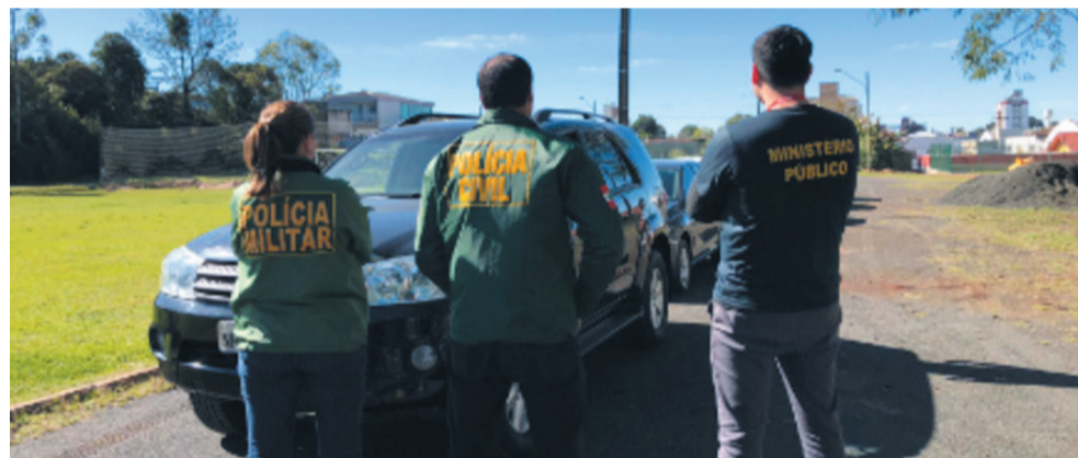
Ação do GAECO aconteceu na última sexta-feira

Esta fase da investigação ainda corre em segredo de justiça, e novas informações que surjam sobre a Et Pater Filium, podem ser acompanhadas no site do CN.