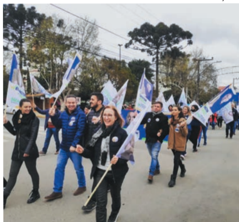
reuniu vários apoiadores no centro de Canoinhas