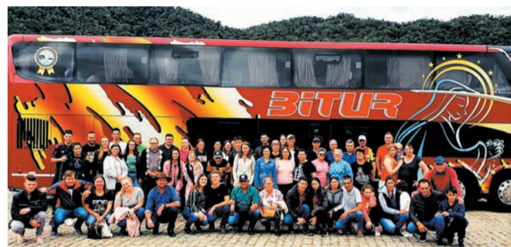
Romeiros dos municípios de Irineópolis, Porto União e Canoinhas, após o almoço de volta, domingo, 21, no Restaurante do Grupo Batistella, em Miracatú-SP