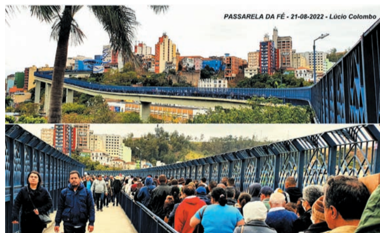
Desde sexta-feira, 19, até domingo, 21, cerca de 250 mil peregrinos atravessaram a "Passarela da Fé", com 400 metros de comprimento e 72 metros de altura, que liga o Santuário Nacional e a Basílica Velha

soberbos, mas dá a sua graça aos humildes". De fato, Deus se deixa seduzir pela humildade", concluiu.