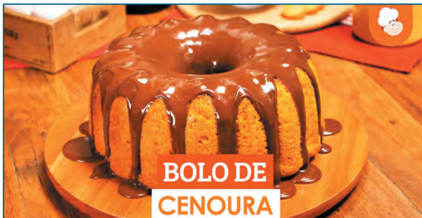
BOLO DE CENOURA