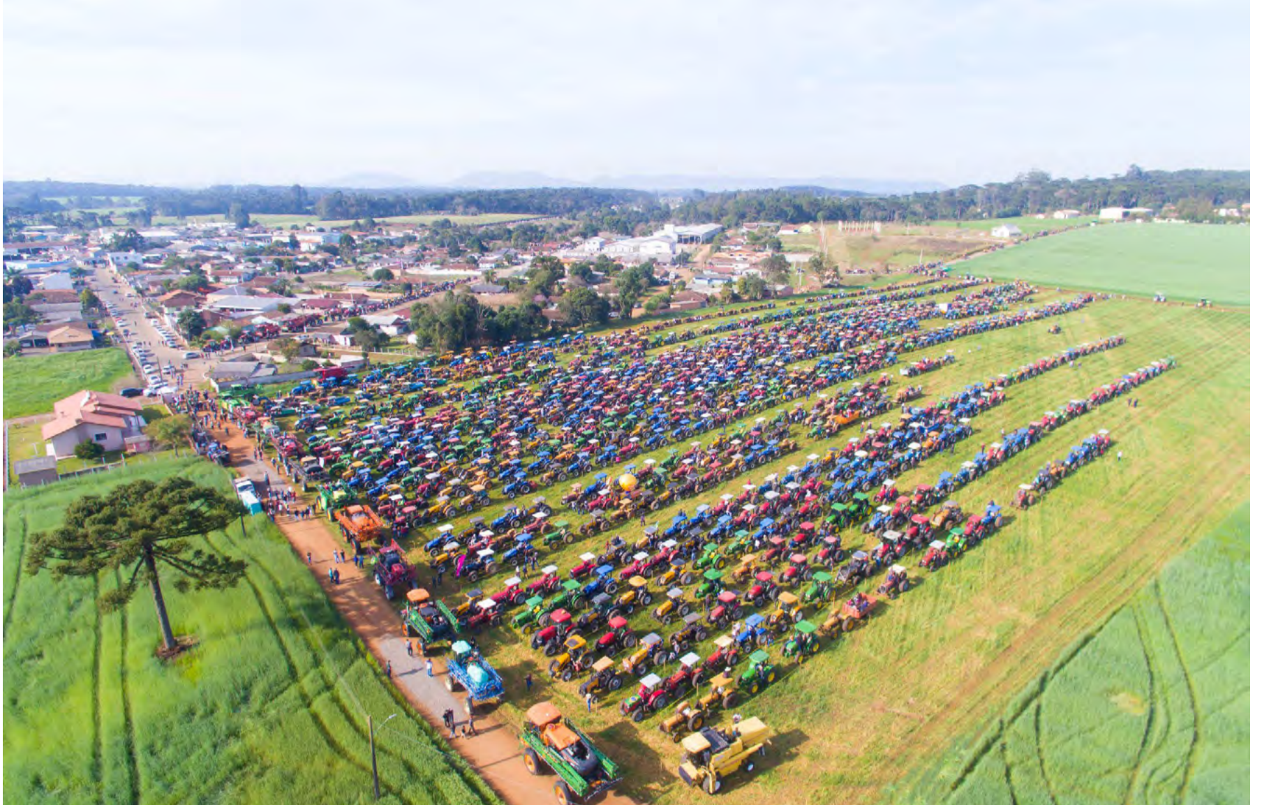
Concentração dos tratores para o início do desfile