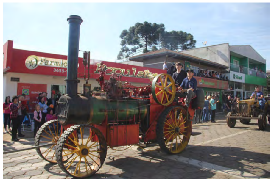
Trator movido a vapor, com mais de 100 anos, participando do desfile