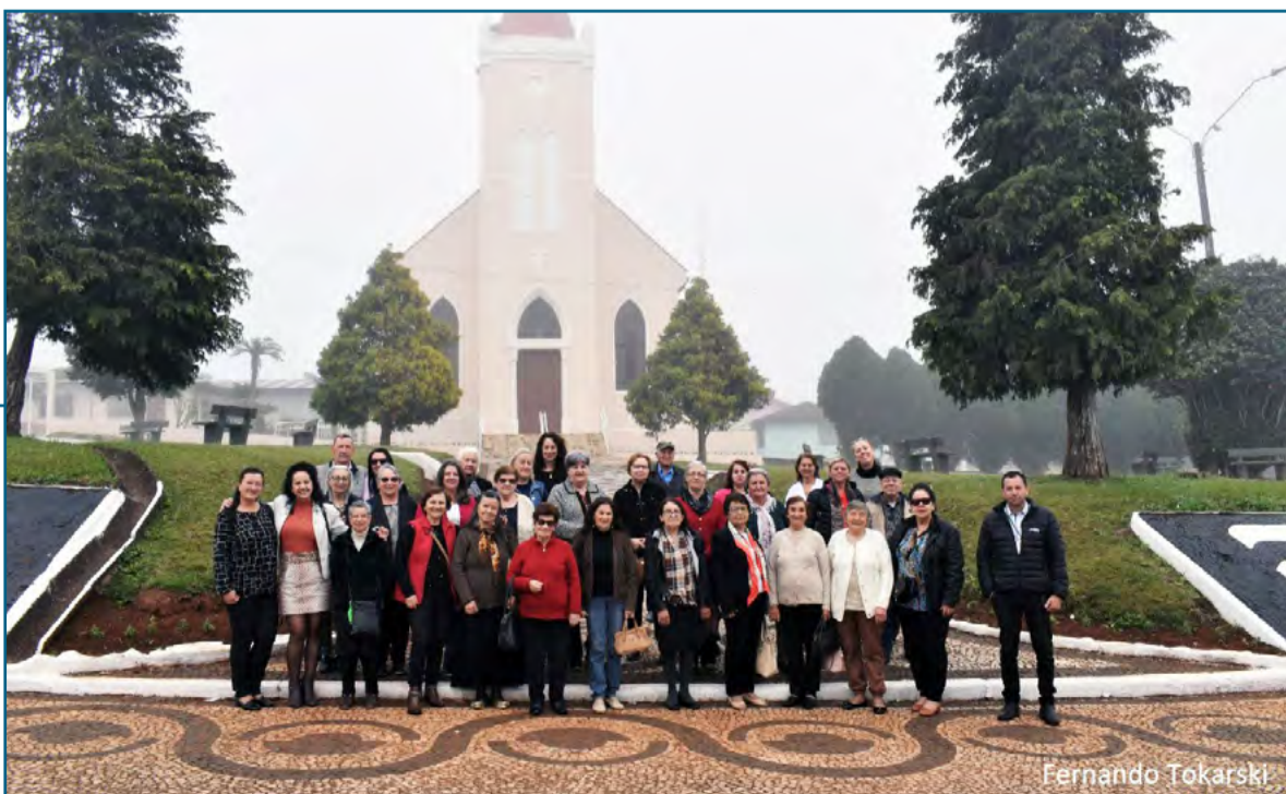
Grupo de canoinhenses prestigiando a Festa do Trator, em Irineópolis.