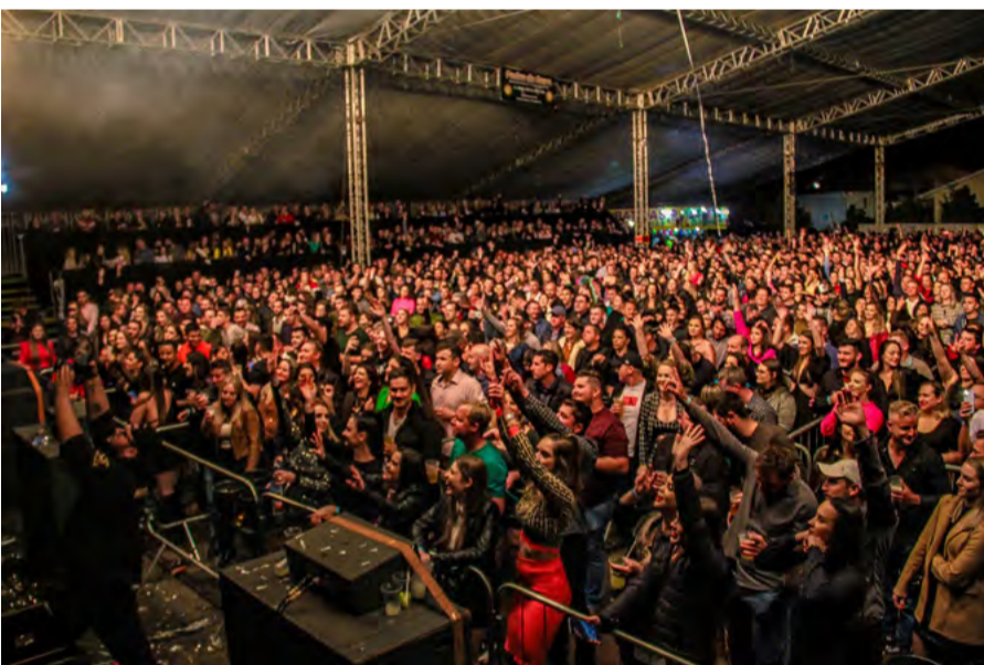
Atrações musicais reuniram milhares de pessoas