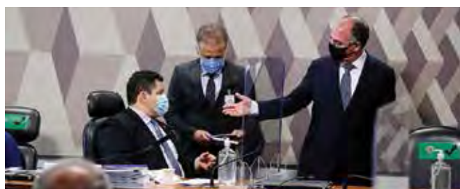
O presidente da CCJ, Davi Alcolumbre, e o relator da PEC, Fernando Bezerra, na reunião desta quarta

Senadores pediram aperfeiçoamentos na Proposta de Emenda à Constituição (PEC) 23/2021, a PEC dos Precatórios, cujo relatório foi lido na manhã desta quarta-feira, 24, na Comissão de Constituição de Justiça (CCJ) do Senado. A PEC abre espaço fiscal no Orçamento de 2022 para o pagamento do programa social batizado como Auxílio Brasil, sucessor do Bolsa Família. Para isso, altera a base de correção do