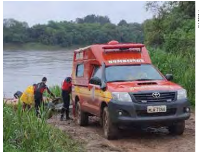
Bombeiros durante busca no Rio Iguauçú

Segundo dados apurados pela BBC, o afogamento é a causa acidental mais comum de mortes de crianças, mas os adultos também devem ficar atentos. Em reportagem divulgada no fim de 2019, o G1 informou que em média 300 mil adultos morrem anualmente no mundo afogados após ingerirem bebidas alcoólicas. Inclusive, o uso de álcool é responsável pela redução na avaliação do risco no local e superestimação dos limites individuais em mais de 20% dos casos. Em águas turvas, como as de rios ou tanques, os bombeiros orientam que antes do mergulho, as pessoas se