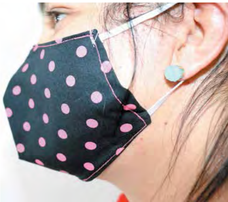
Máscaras estavam sendo exigidas em ambientes abertos desde o início da pandemia