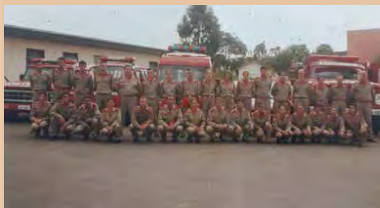
Primeira e segunda turma em frente às viaturas da época