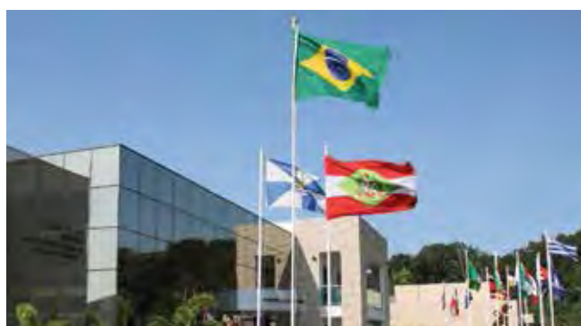
Sede da FCF em Balneário Camboriú

Quatro clubes filiados junto a Federação Catarinense de Futebol (FCF) garantiram vaga na edição 2022 da Copa São Paulo de Futebol Júnior, promovido pela Federação Paulista de Futebol (FPF). Vão representar Santa Catarina na competição: Avaí, Criciúma, Joinville e Concórdia. A Federação Paulista de Futebol encaminhou o convite à FCF na quinta-feira, 18, com quatro vagas. Dessa forma, os quatro primeiros colocados do Campeonato Catarinense Sub-20 garantiram vaga na disputa.