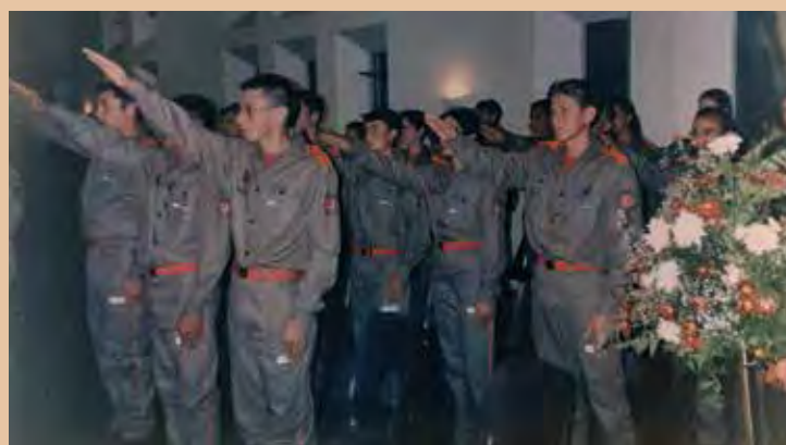
Cerimônia aconteceu no Clube Canoinhense