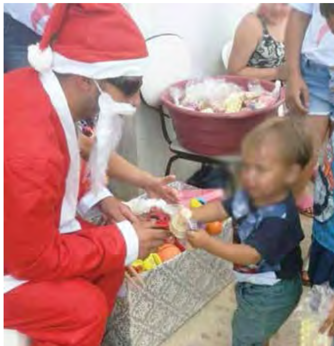
Papai Noel do grupo fazendo a entrega dos donativos em anos anteriores