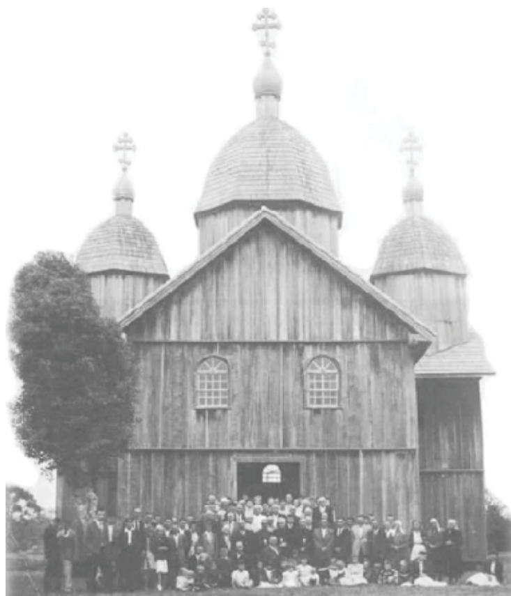
Demolida em 1983, a igreja ortodoxa ucraniana dedicada a São Valdemiro Magno. Foi o maior templo ucraniano do Brasil.