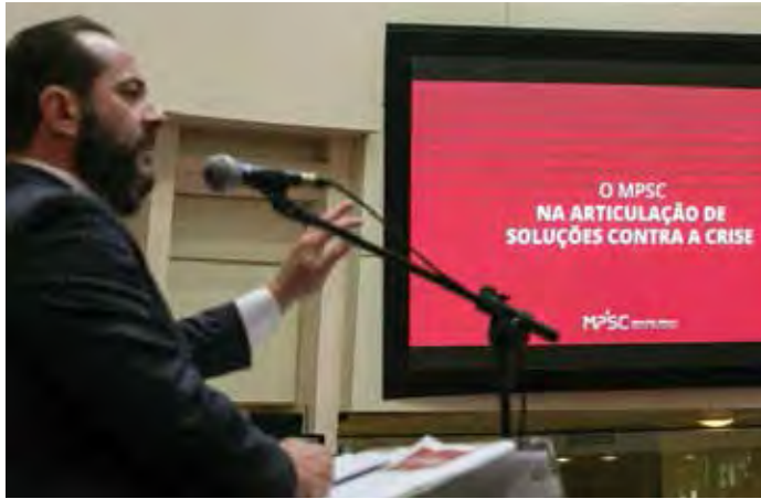
O procurador-geral de Justiça, Fernando Comin, durante a apresentação do Relatório de Gestão Institucional do MPSC

O procurador-geral de Justiça, Fernando Comin, apresentou no plenário da Assembleia Legislativa, na tarde desta quarta-feira, 24, o Relatório de Gestão Institucional do Ministério Público de Santa Catarina (MPSC) referente ao ano de 2020. A apresentação está prevista no artigo 101 da Constituição Estadual. Comin esteve acompanhado do corregedor-geral do MPSC, Ivens José de Carvalho, e do presidente da Associação Catarinense do Ministério Público (ACMP), Marcelo Gomes Silva. Na apresentação, o chefe do MPSC destacou principalmente os impactos da pandemia da Covid-19