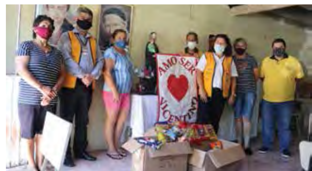
Entrega aconteceu na última segunda-feira

Durante a semana, membros do Canoinhas Clube de Carros Antigos realizaram a entrega dos alimentos não perecíveis arrecadados durante o 5º Encontro Interestadual de Carros Antigos, que aconteceu