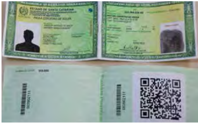
Emissão dos documentos com numeração única começou na última segunda-feira

O objetivo da unificação é evitar fraudes, uma vez que especialistas acreditam que a tecnologia une a biometria, que é única, com um número de identificação nacional, que no caso seria o CPF. Agora, Paraná e Rio Grande do Sul também caminham para adotar um único número de identificação. "No futuro, com o documento vinculado ao número único nacional do CPF e atrelado à biometria