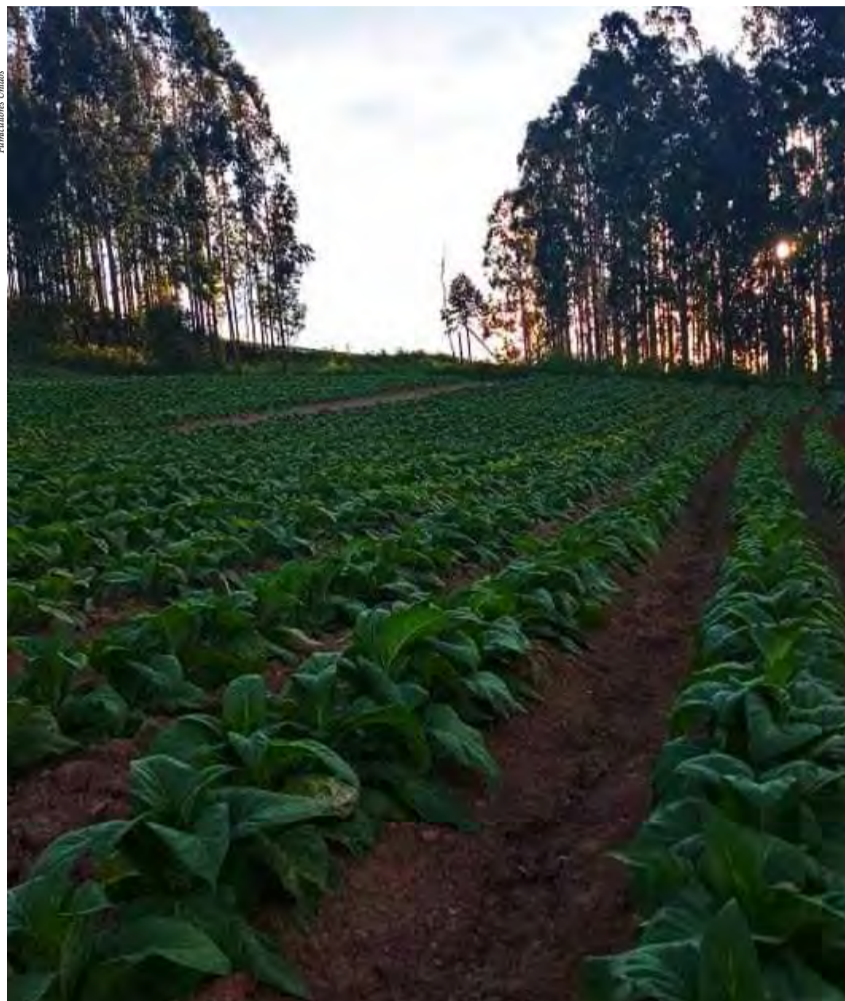
Plantação de tabaco na localidade do Pulador, interior de Major V