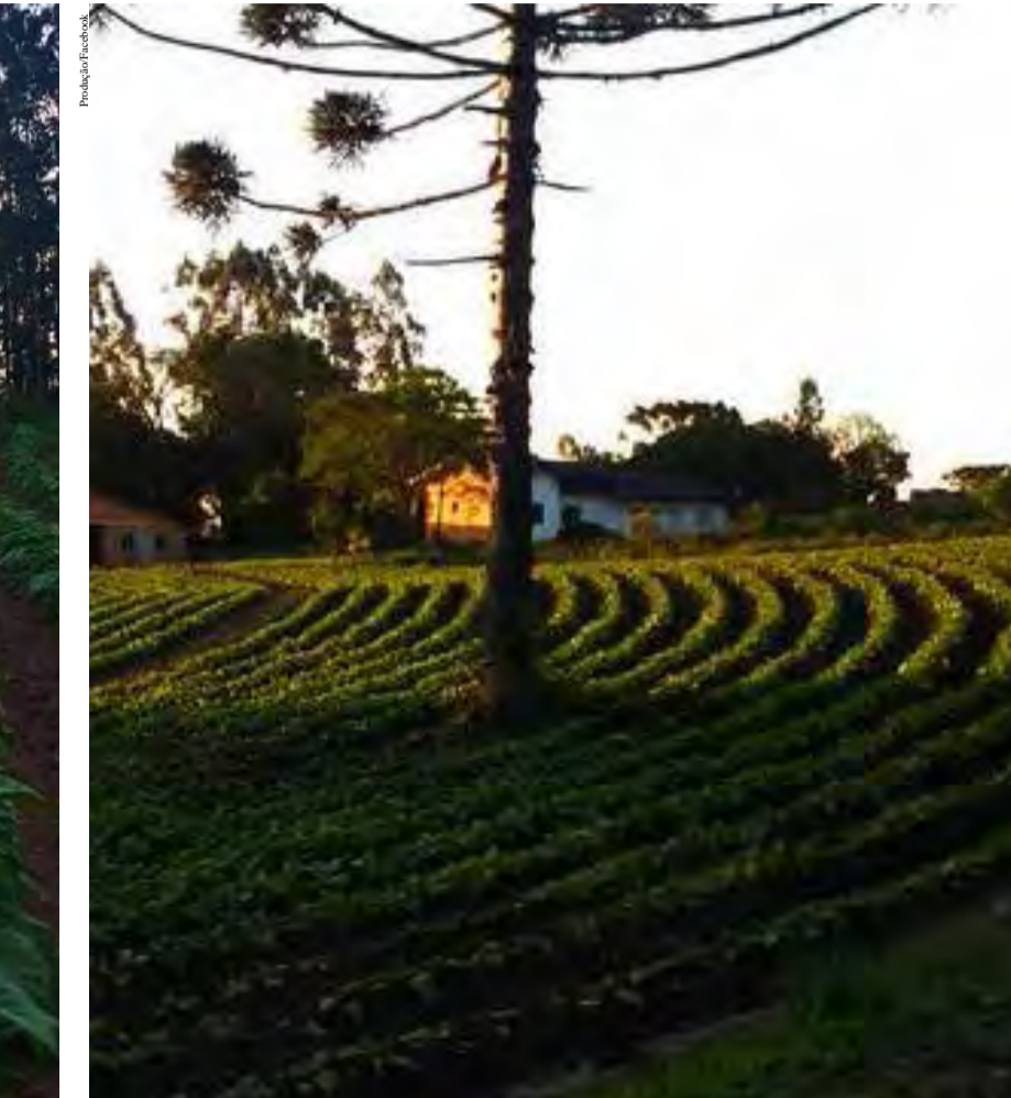
Araucária em meio a plantação de tabaco em Mafrá

...mas, ainda cobram maior fiscalização no cumprimento da Lei da Integração