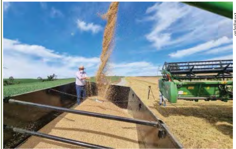
abertura oficial da colheita aconteceu na última semana de outubro.

Com a expectativa de safra recorde de trigo, Santa Catarina dá início à colheita de cereais de inverno, para serem usados em ração animal. Segundo a Epagri/Cepa, o estado deve produzir 348 mil toneladas de trigo, o maior valor dos últimos dez anos. A abertura oficial da colheita aconteceu na última semana de outubro.