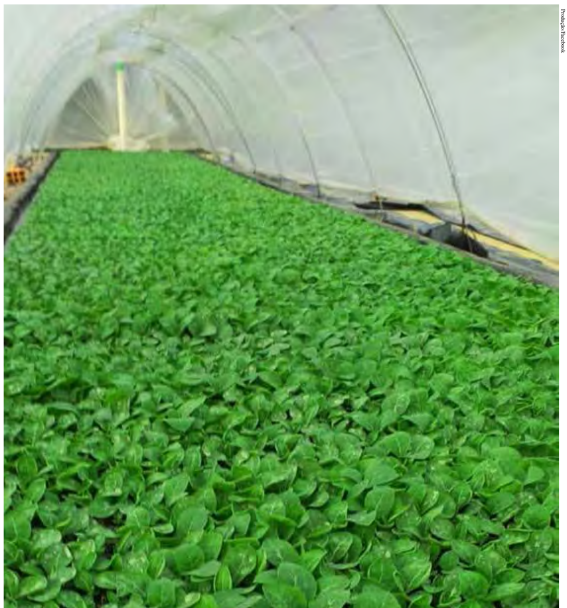
Produção de mudas de tabaco no interior de Itaiópolis