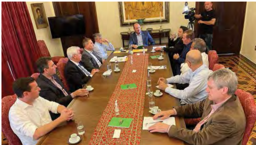
Representantes do agronegócio estiveram reunidos na Casa d'Agrônômica

A convite do governador interino Mauro De Nadal, representantes do agronegócio estiveram na Casa d'Agrônômica, em Florianópolis, nesta quarta-feira, 10, para discutir algumas das principais demandas do setor para 2022. Entre as prioridades estão a manutenção do programa Troca Troca e a definição do ICMS sobre insumos agrícolas. Participaram do encontro os secretários de estado da Fazenda, Paulo Eli, da Agricultura, Altair Silva, e o chefe da Casa Civil, Eron Giordani,